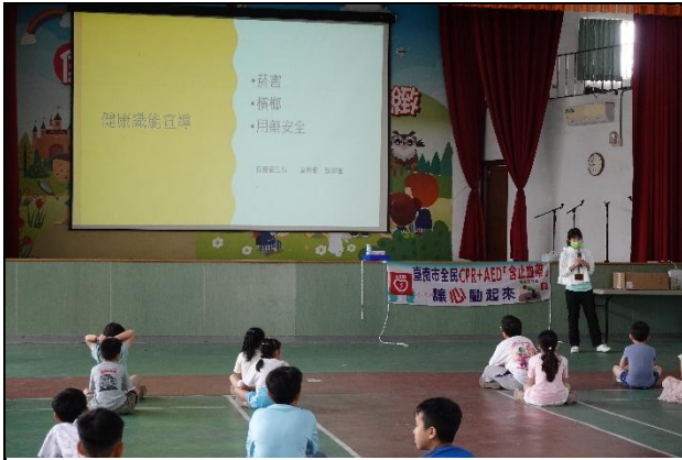
柳營衛生所入校宣導