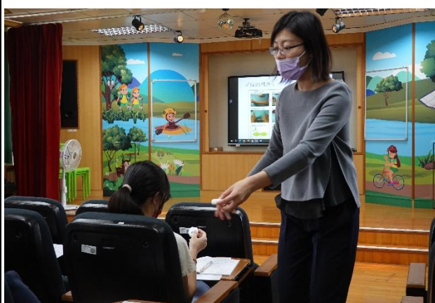
說明：指導委員講解牙線使用方法