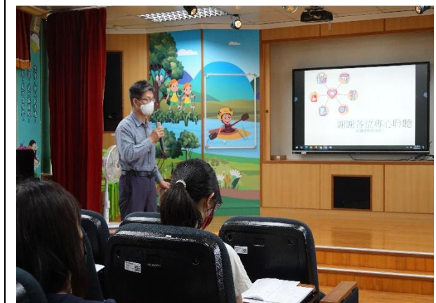
說明：校長全程聆聽口腔保健宣導