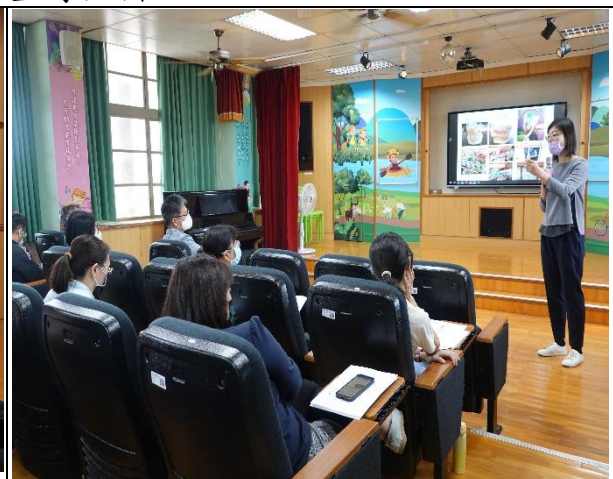
說明：指導委員講解口腔保健內容