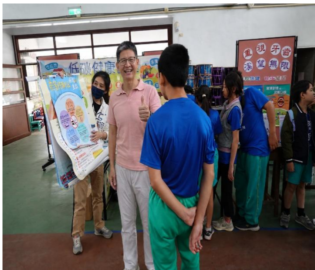
說明：校長參加口腔保健闖關及衛教宣導