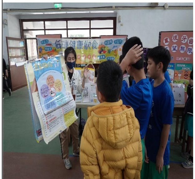
說明：指導委員講解口腔保健內容