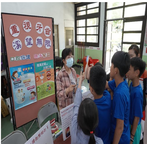
說明：護理師說明保護牙齒的重要性