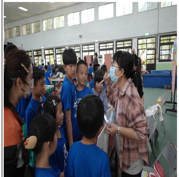
說明：護理師說明保護牙齒的方法