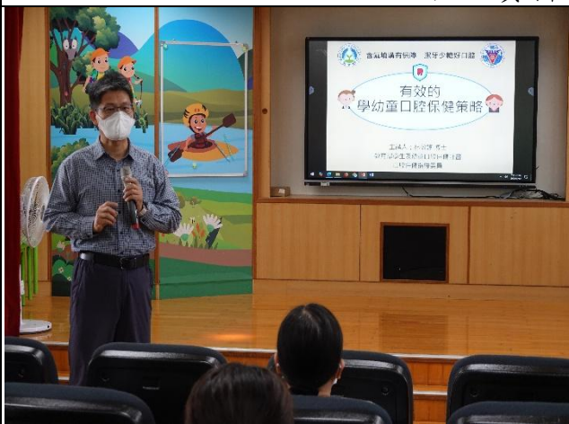
說明：校長介紹口腔保健指導委員