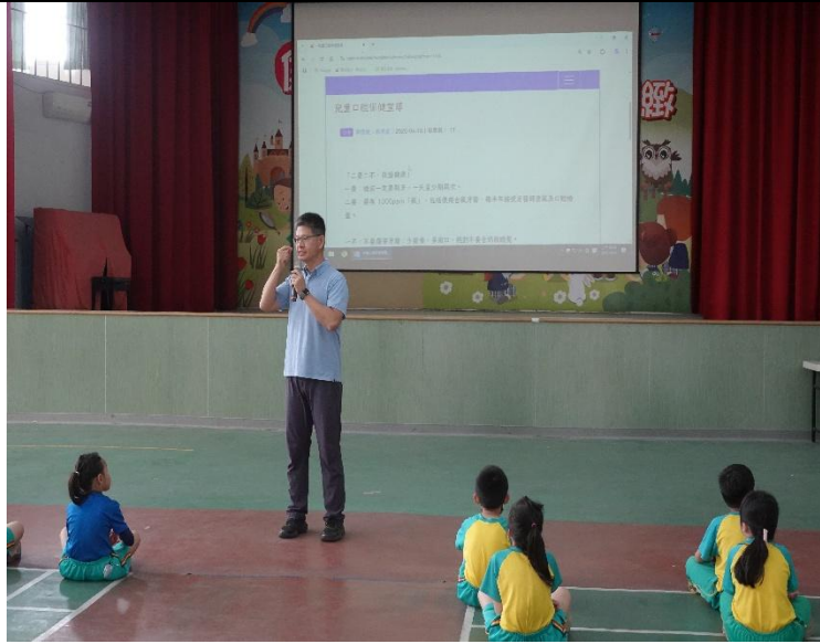
說明：學生晨會時間校長講解口腔保健衛教宣導