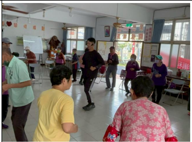
說明：校內體育教師到校園周遭社區進行超慢跑課程，將健康促進風氣延伸至社區