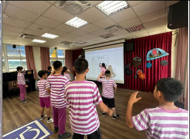
說明：與衛生所合作，替活力班學生提高運動次數