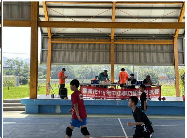
說明：承辦115年度巧固球對抗賽，打造積極向上的運動校園風氣