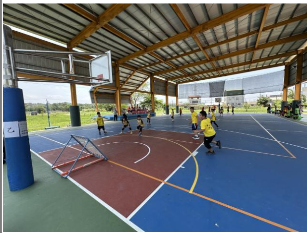
說明：體位班學生加入巧固球隊訓練，以增加運動機會