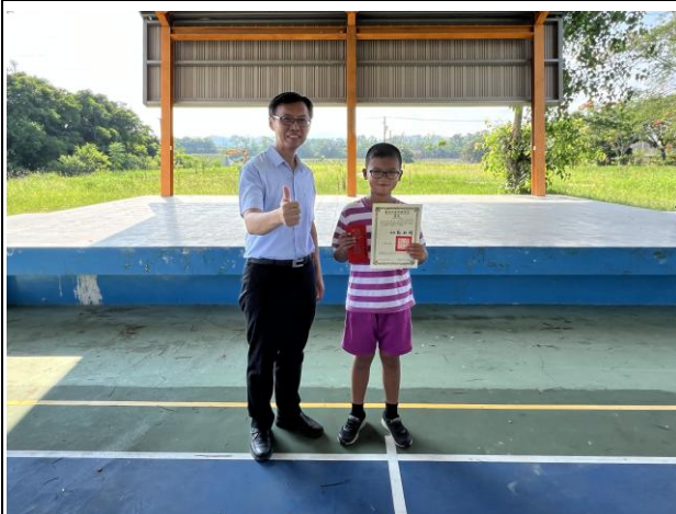
說明：參加台南市健康促進主播評選活動獲得佳作 1