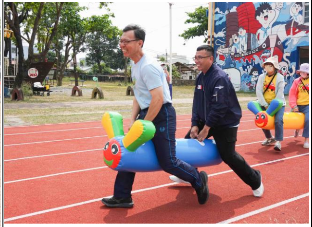
說明：於校慶運動會親師生透過趣味競賽，一起運動，促進身心健康 2