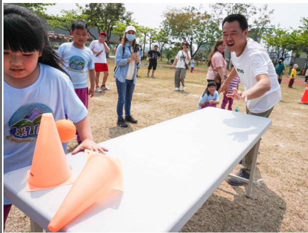
說明：於校慶運動會親師生透過趣味競賽，一起運動，促進身心健康 1