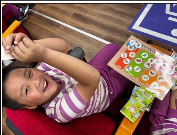
說明：與衛生所合作，替活力班學生加強健康飲食的觀念