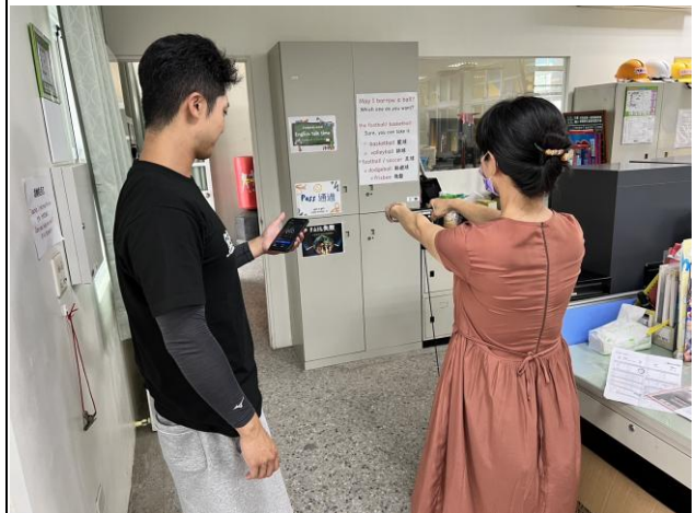
說明：教職員工透過身體組成儀器進行身體質量之監控