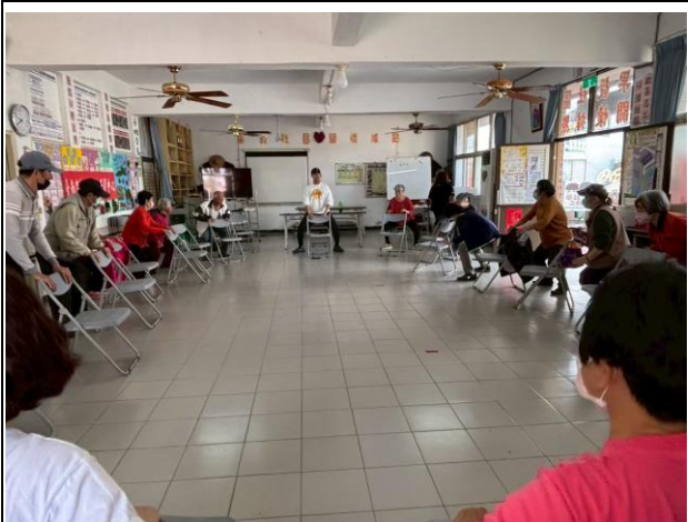
說明：校內體育教師到校園周遭社區進行下肢肌力課程，將健康促進風氣延伸至社區