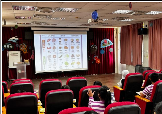
說明：邀請衛生局專家學者到校宣導減鹽