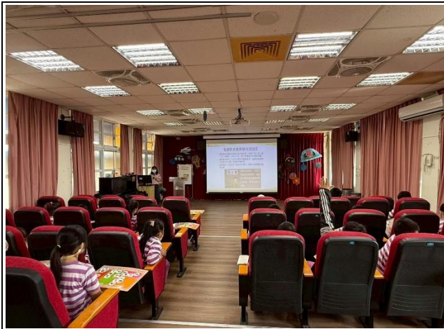
說明：衛生所到校宣導低碳飲食的原則