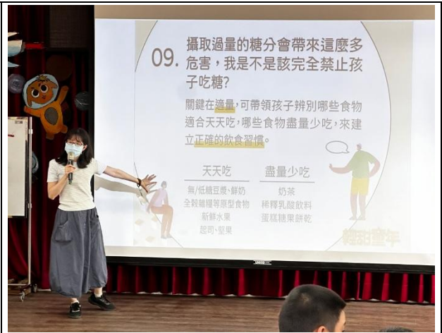
說明：邀請衛生局專家學者到校宣導減糖