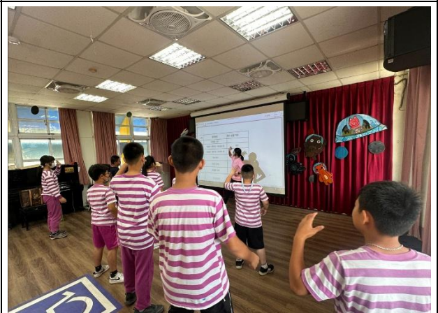
說明：邀請專業運動教練到校帶學生跳舞