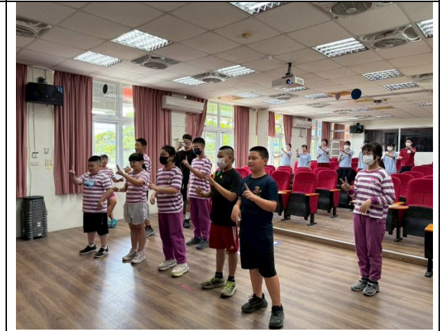
說明：與柳營衛生所合作領導學生參加115年臺南市「FIT 能量校園」創意律動影音徵選