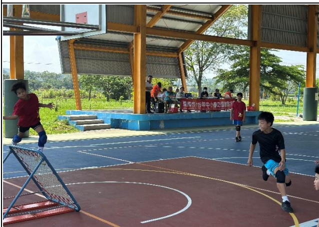
說明：於校內承辦臺南市115年度中小學巧固球對抗賽，校內巧固球隊學生參與其中。