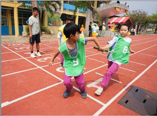
說明：參加校內混齡大隊接力賽