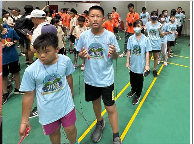
說明：參加普及化跳繩接力賽