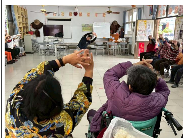
說明：校內體育教師到社區進行健康促進推廣樂齡運動-暖身