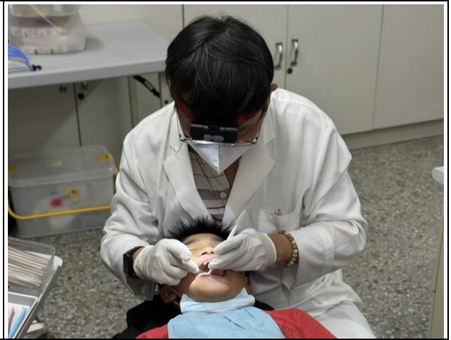
說明：邀請牙醫師到校檢查口腔健康及塗氟