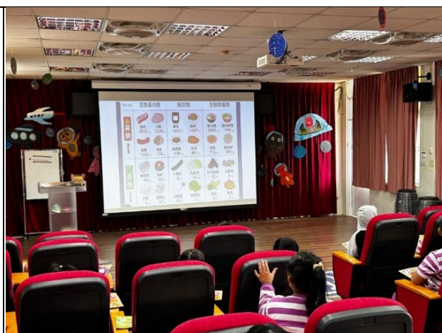
說明：與柳營衛生所合作，邀請衛生局的專家來學校進行減鹽的健康教育