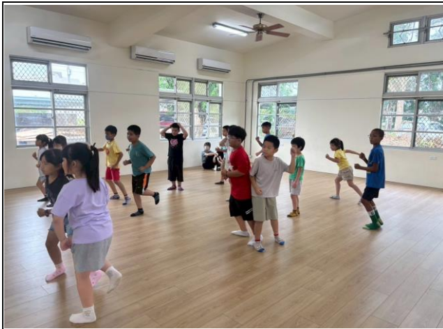
說明：申請夏日樂學計畫，於暑假期間讓學生也能夠持續保持運動量