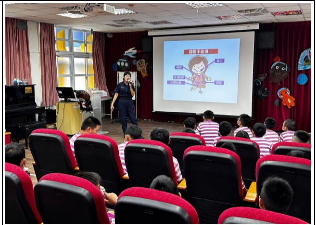
說明：邀請警政單位到校進行性教育宣講