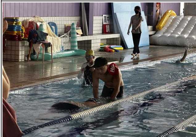
說明：申請游泳課程計畫，讓學生學習水域安全及自救技能