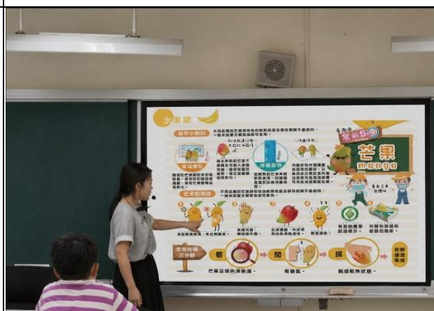
說明：健康課程進行餐前五分鐘專書教學