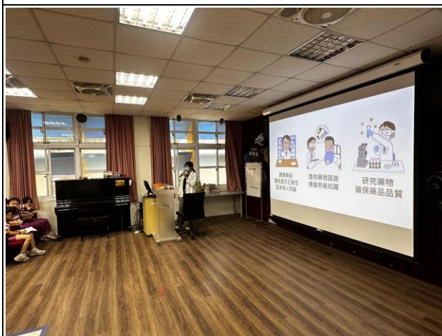
說明：邀請醫院藥師前來宣導全民安全用藥