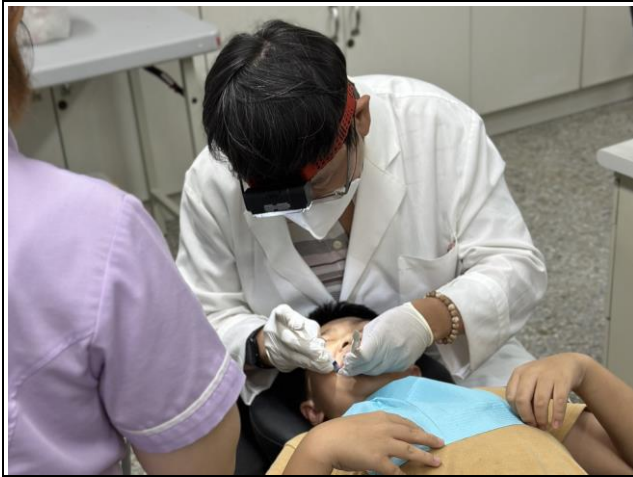
說明：邀請牙醫師到校檢查口腔健康及塗氟