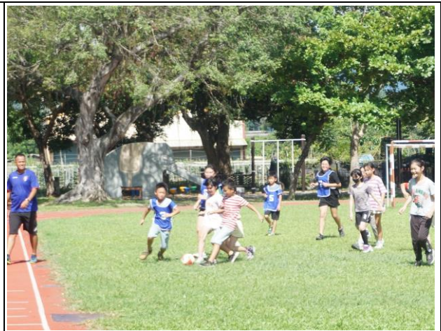
說明：透過夏日樂學計畫，於暑假期間讓學生也能夠持續保持運動量