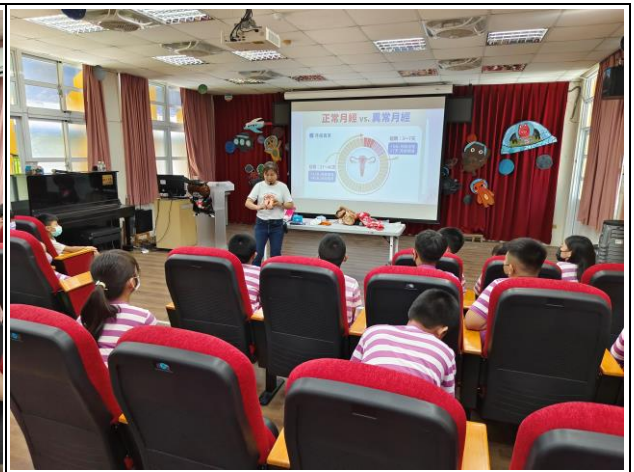
說明：邀請講師向高年級學生進行月經教育