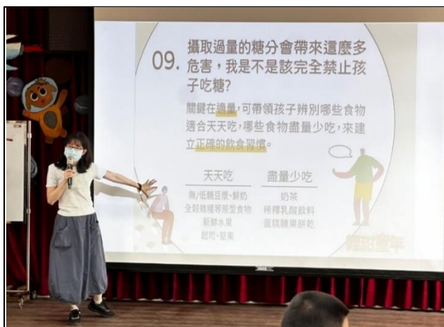
說明：與柳營衛生所合作，邀請衛生局的專家來學校進行減糖的健康教育