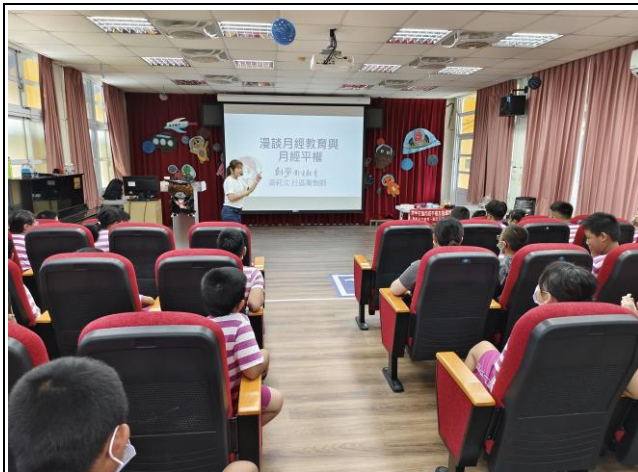
說明：邀請講師向高年級學生進行月經教育