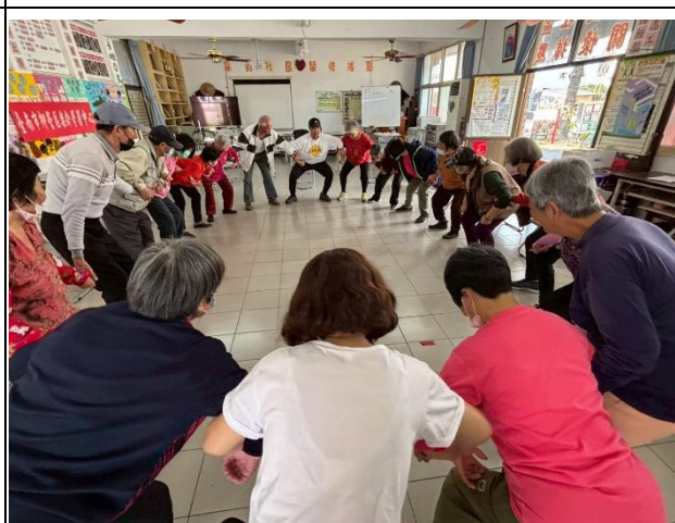
說明：校內體育教師到社區進行健康促進推廣樂齡運動-下肢肌力課程