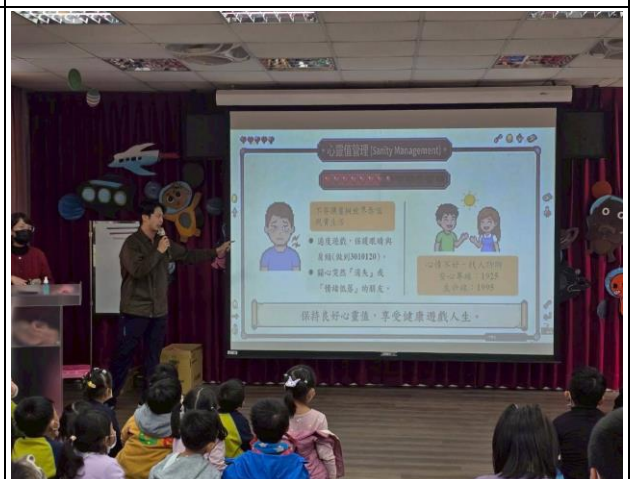
說明：全校正向心理健康促進宣導