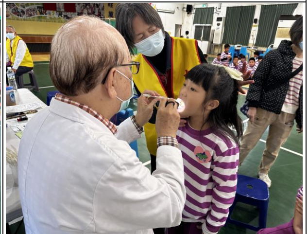
說明：每年例行進行口腔健檢