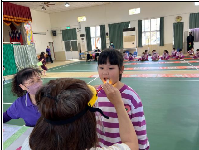
說明：每年例行進行口腔健檢