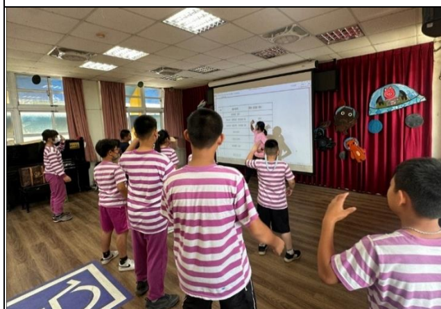
說明：與柳營衛生所合作，邀請運動教練來學校進行律動的課程