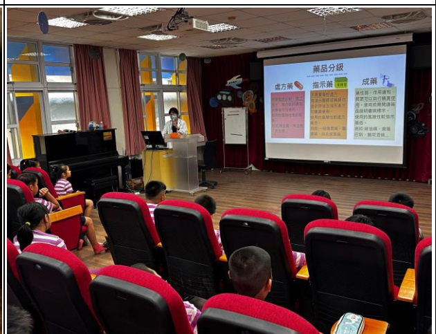
說明：邀請醫院藥師前來宣導藥物分級