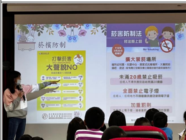
說明：全校菸檳防制宣導