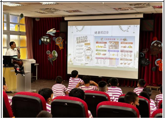
說明：全校85210健康密碼宣導