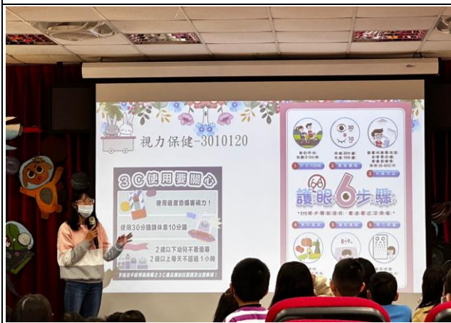
說明：全校視力保健宣導