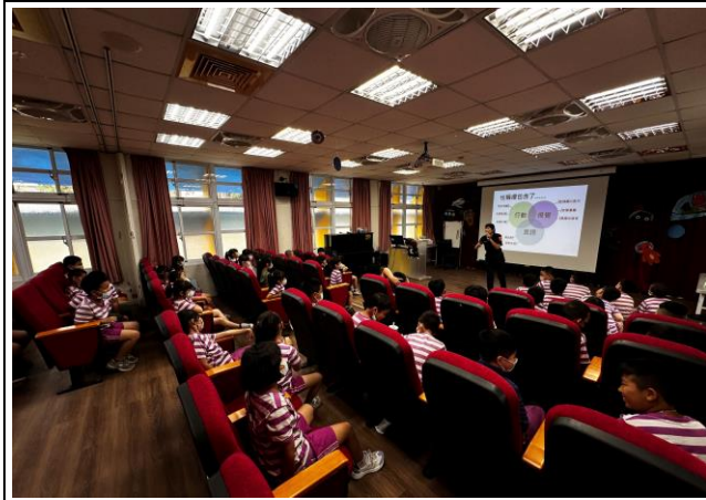
說明：邀請警政單位到校進行性教育宣講