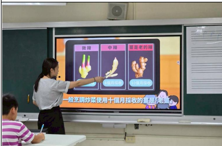
說明：三年級餐前五分鐘影片學習。