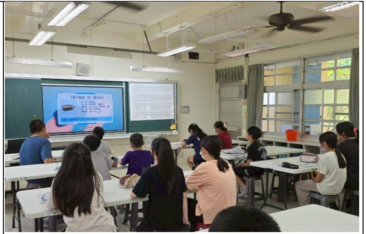
說明：六年級餐前五分鐘影片學習。