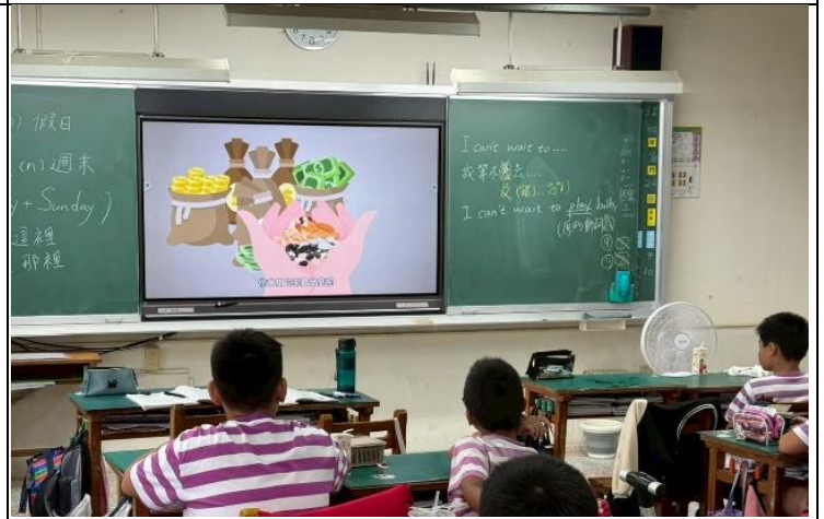
說明：餐前五分鐘專書教學-油脂與堅果種子。