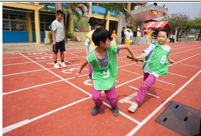
說明：舉辦全校混齡大隊接力賽