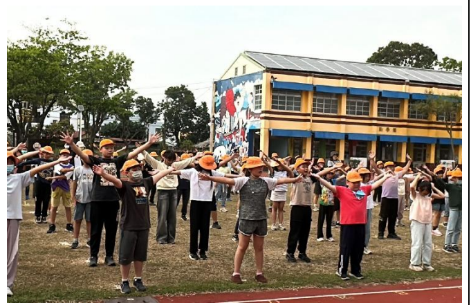
說明：全校課間時間跳健康操