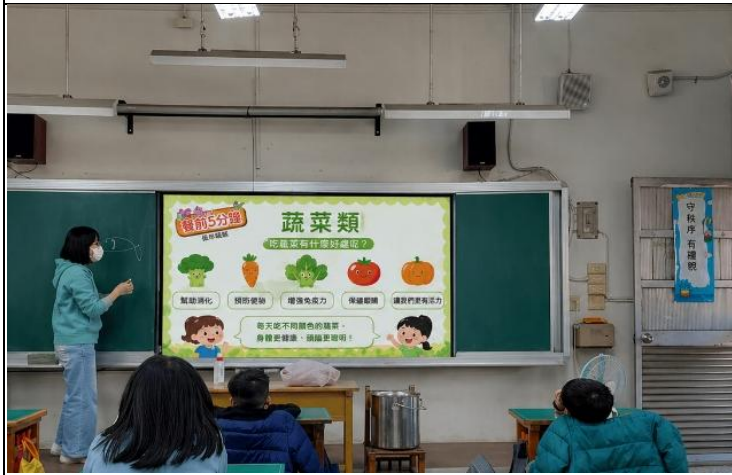
說明：餐前五分鐘專書教學-蔬菜類。