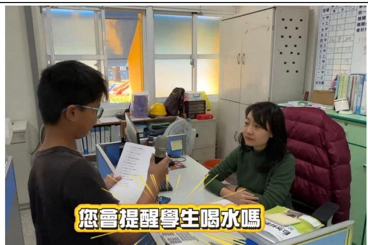
您會提醒學生喝水嗎