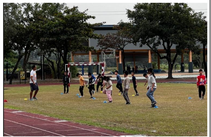
說明：多元體育性社團(足球)