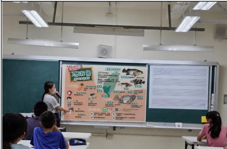
說明：餐前五分鐘專書教學-豆魚蛋肉類。