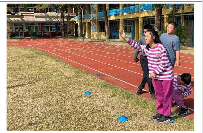
說明：課餘時間體驗多元的運動項目