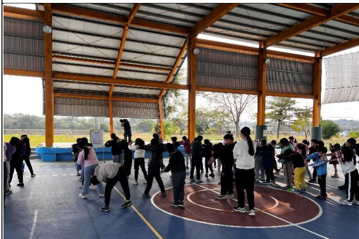
說明：全校運動競賽前暖身活動。