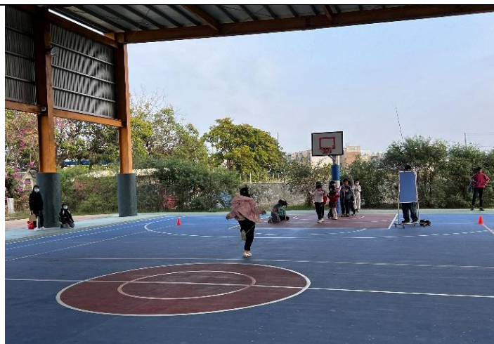
說明：全校混齡跳繩接力競賽。