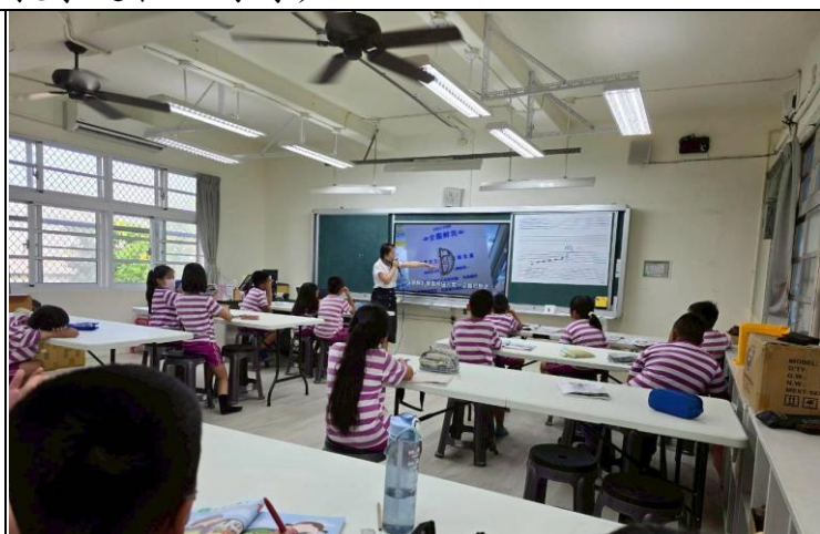
說明：二年級餐前五分鐘影片學習