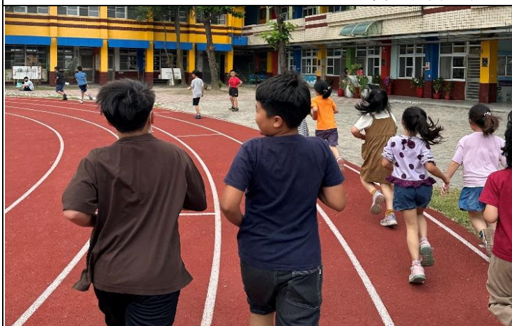
說明：全校大跑步活動