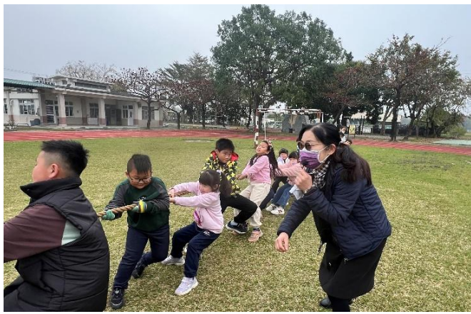
說明：舉辦全校混齡拔河競賽。