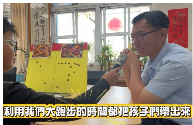
利用我們大跑步的時間都把孩子們帶出來