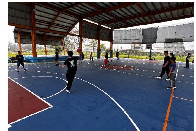
說明：多元體育性社團(巧固球)