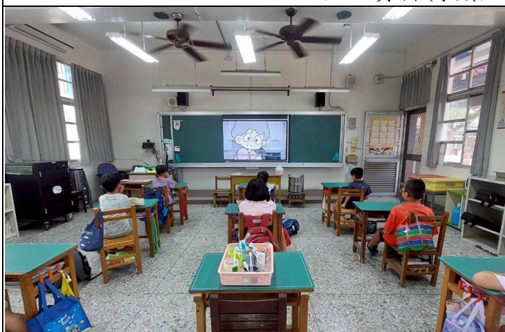
說明：一年級餐前五分鐘影片學習。