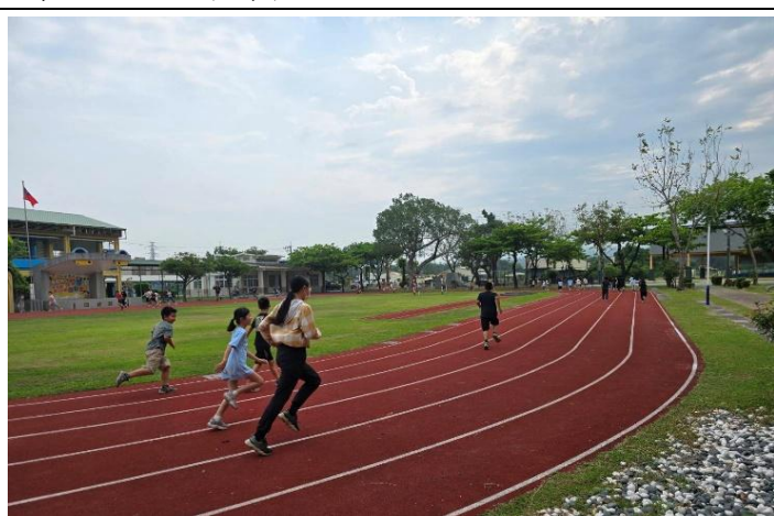
說明：教師與學生一同響應大跑步活動。