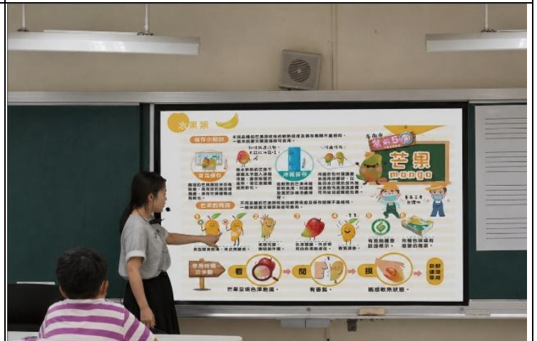
說明：餐前五分鐘專書教學-水果類(芒果)。