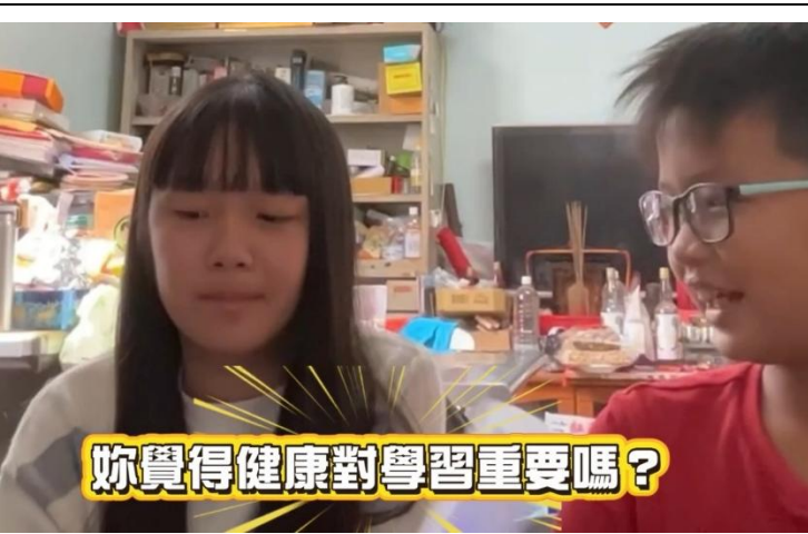
你覺得健康對學習重要嗎？