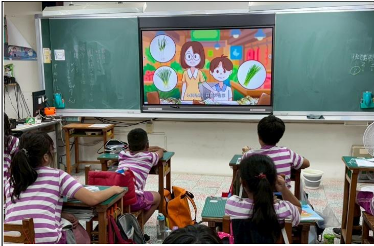
說明：五年級餐前五分鐘影片學習。