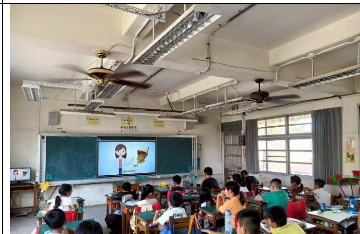
說明：四年級餐前五分鐘影片學習