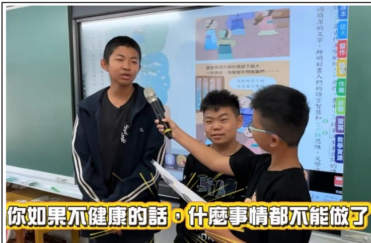
你如果不健康的話，什麼事情都不能做了