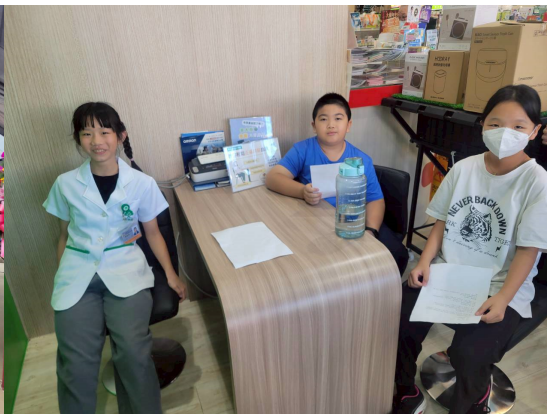
藥局內進行情境模擬