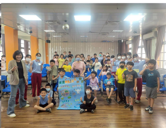
邀請敏惠醫專到校宣導