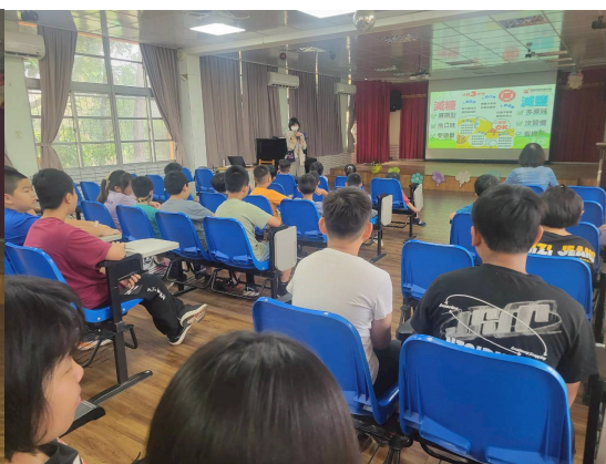
邀請衛生所營養師到校宣導