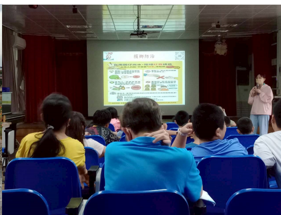
邀請衛生所護理師到校宣導