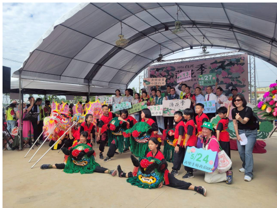
參與蓮花節開幕舞獅表演