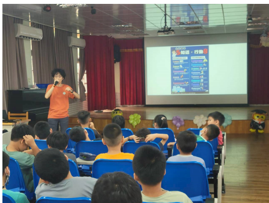
邀請衛生所護理師到校衛教