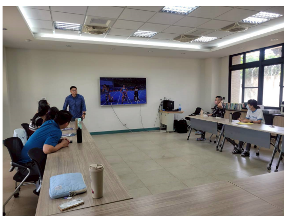
邀請體育教學專家到校增能