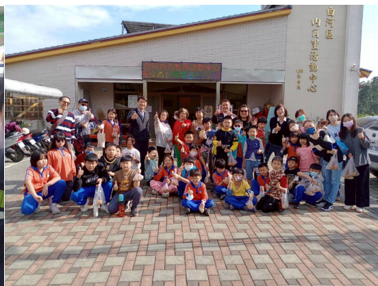
參與社區辦理健康美食製作活動