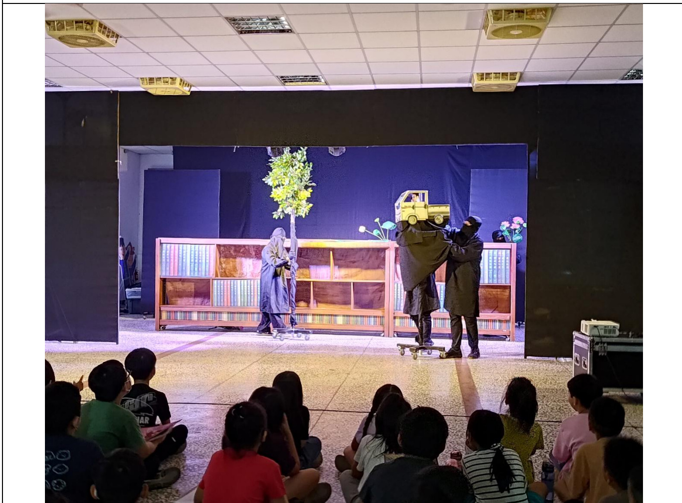
引進各類表演活動，寓教於樂—複合式聲光偶戲