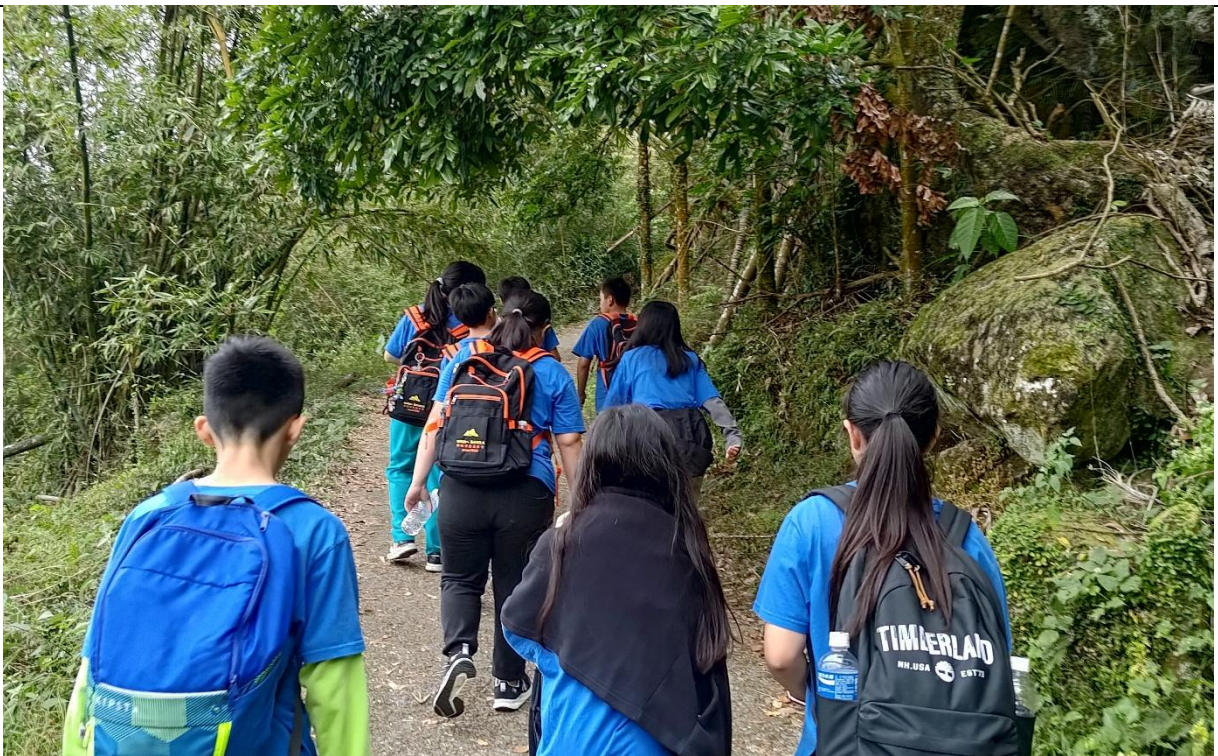
參加白河區山野體驗活動—登大凍山、雞籠山