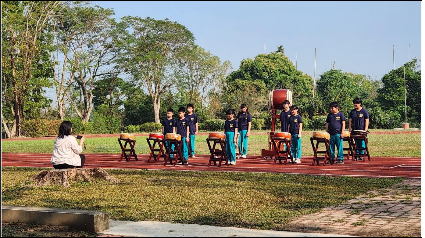
本校特色社團—太鼓隊