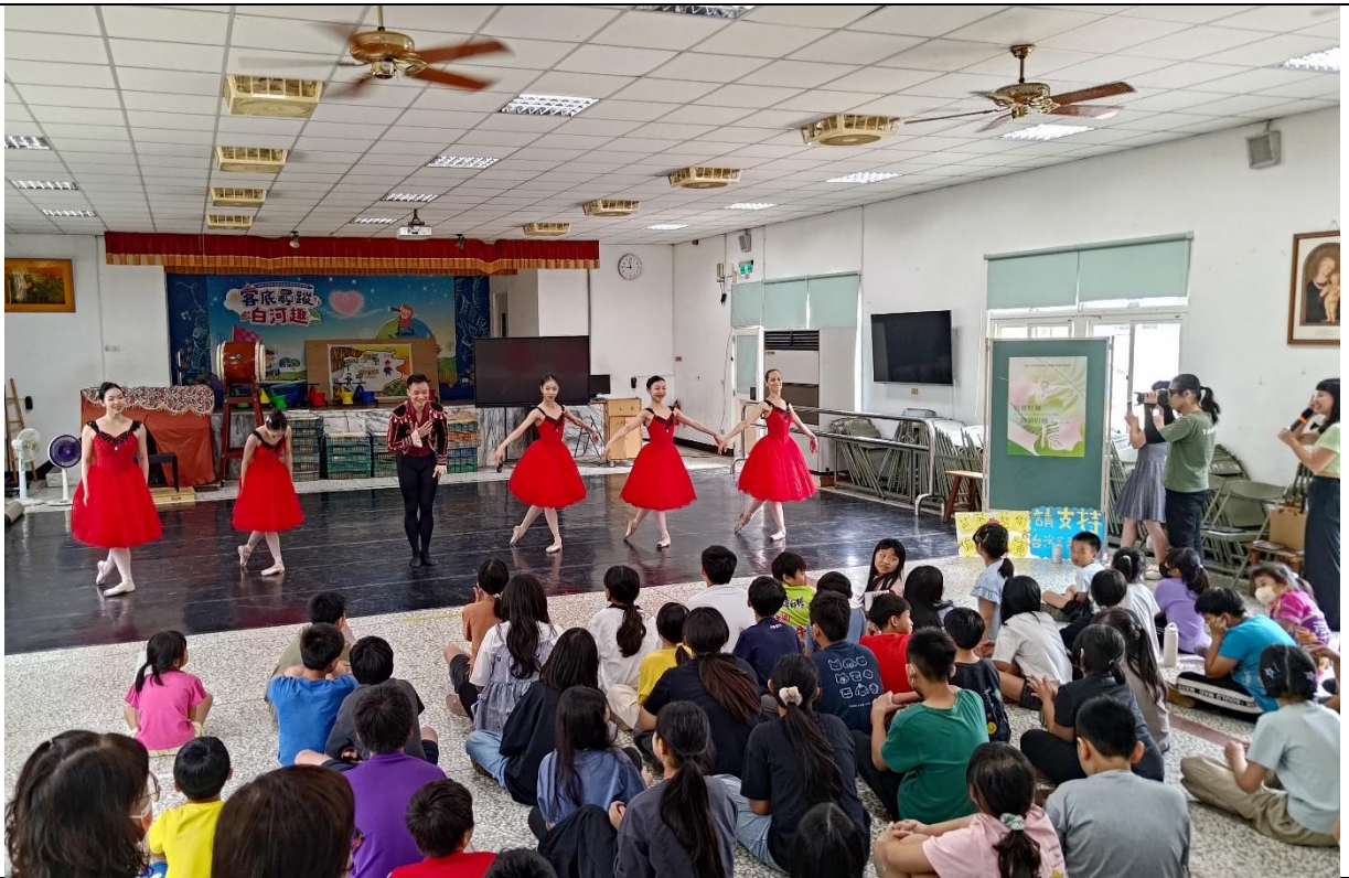
引進各類表演活動，寓教於樂—芭蕾舞表演