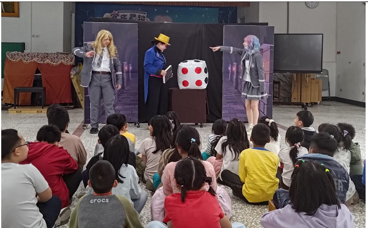
引進各類表演活動，寓教於樂—超現實戲劇表演