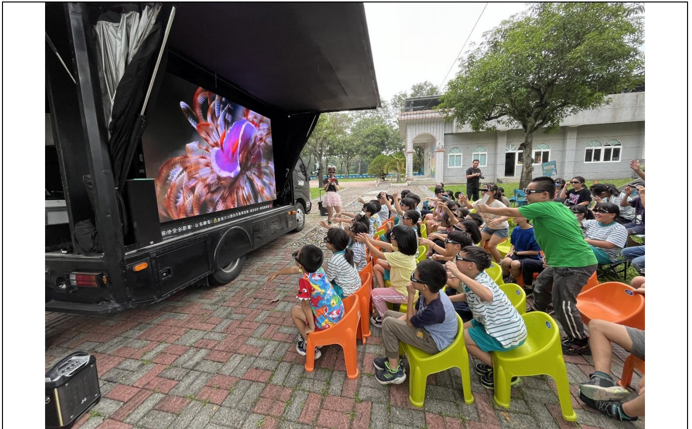
引進各類表演活動，寓教於樂—3D立體生態電影