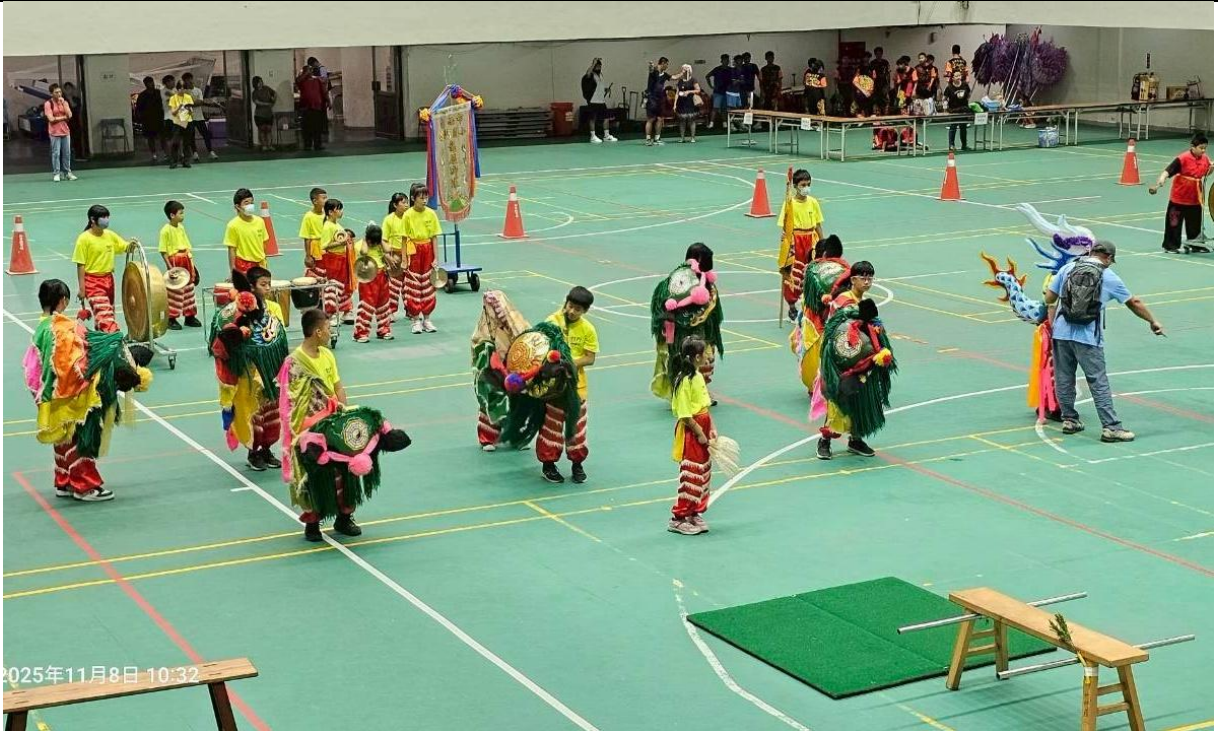
本校特色社團—龍鳳獅