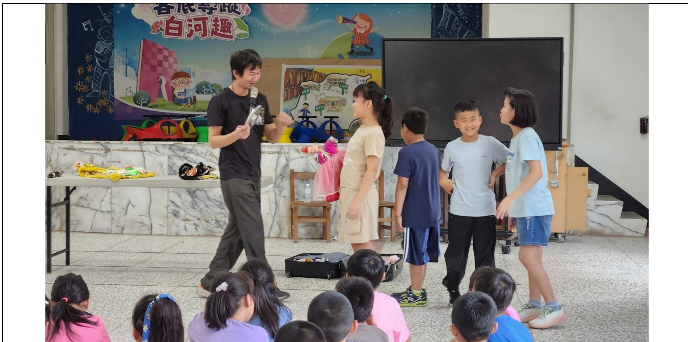
引進各類表演活動，寓教於樂—傳統布袋戲