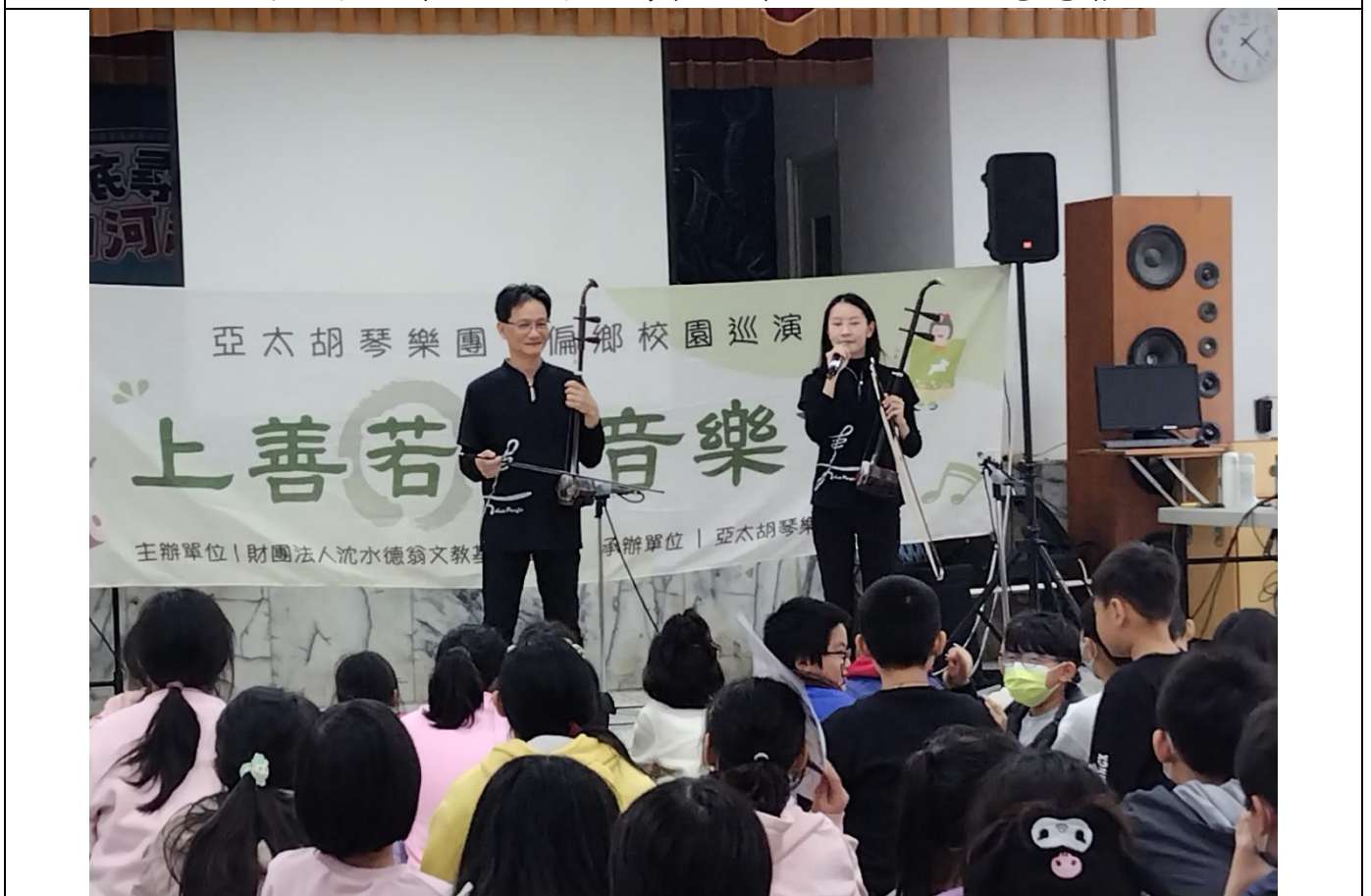
引進各類表演活動，寓教於樂—胡琴表演