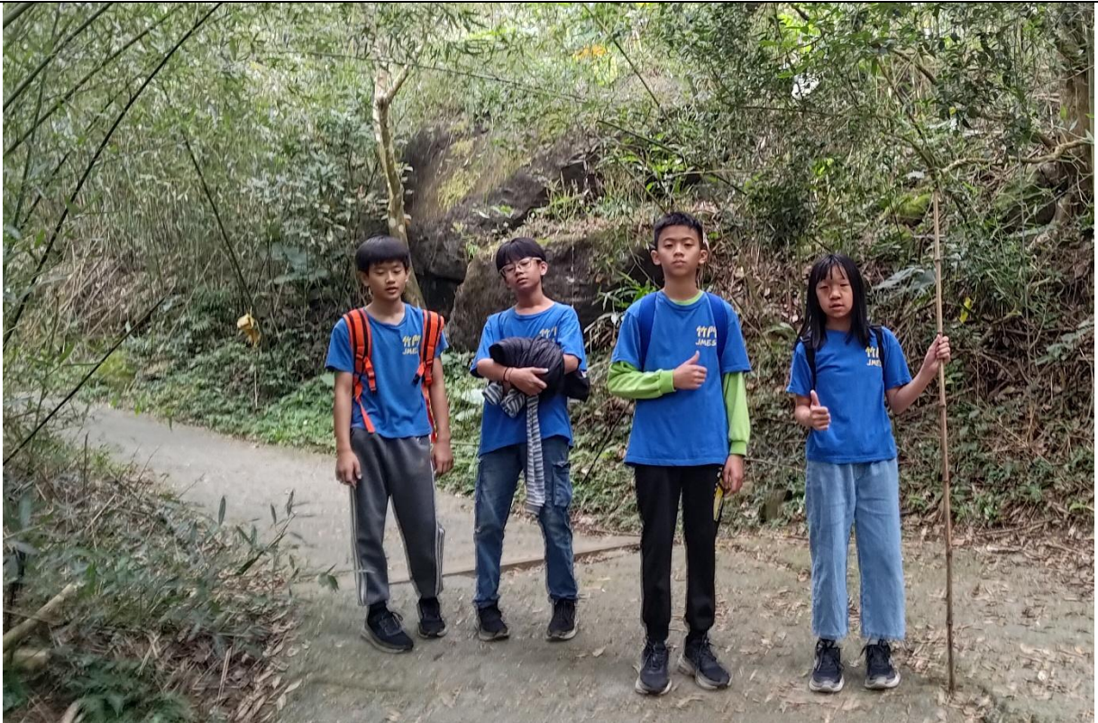
參加白河區山野體驗活動—登大凍山、雞籠山