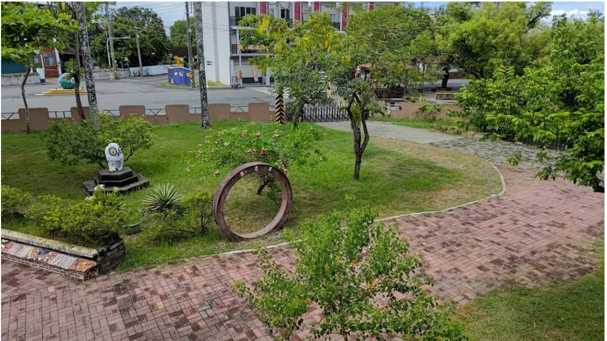
建立綠化美化校園，讓師生在舒適抗壓的環境下活動