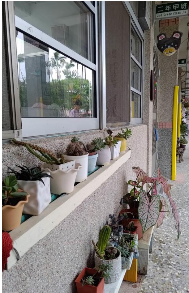
班級外的多肉植物，每一盆都是學生精心照料的小寶貝