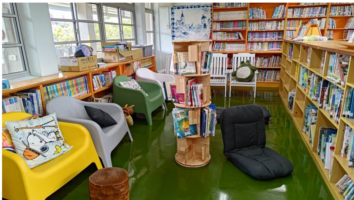
圖書室一角，給孩子舒適自在的閱讀環境