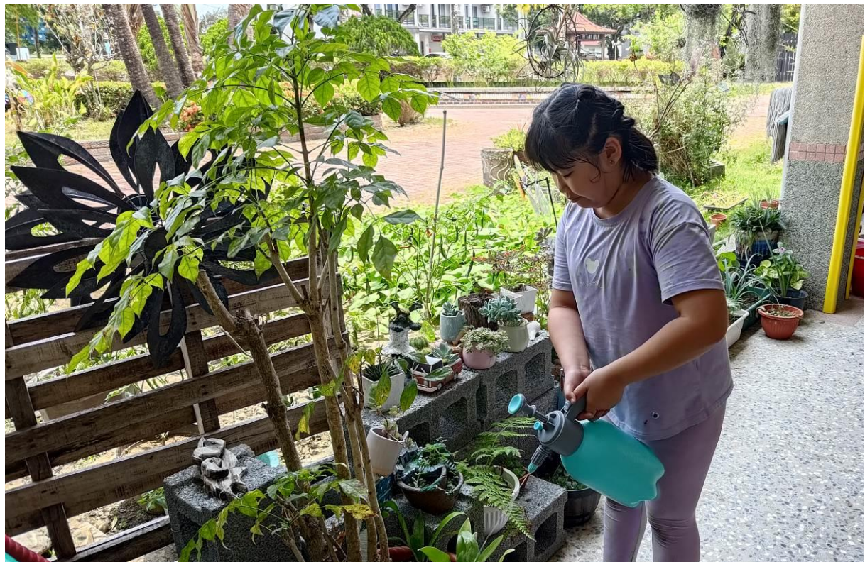
學生於課餘時間可以協助照顧花卉，讓身心得到放鬆