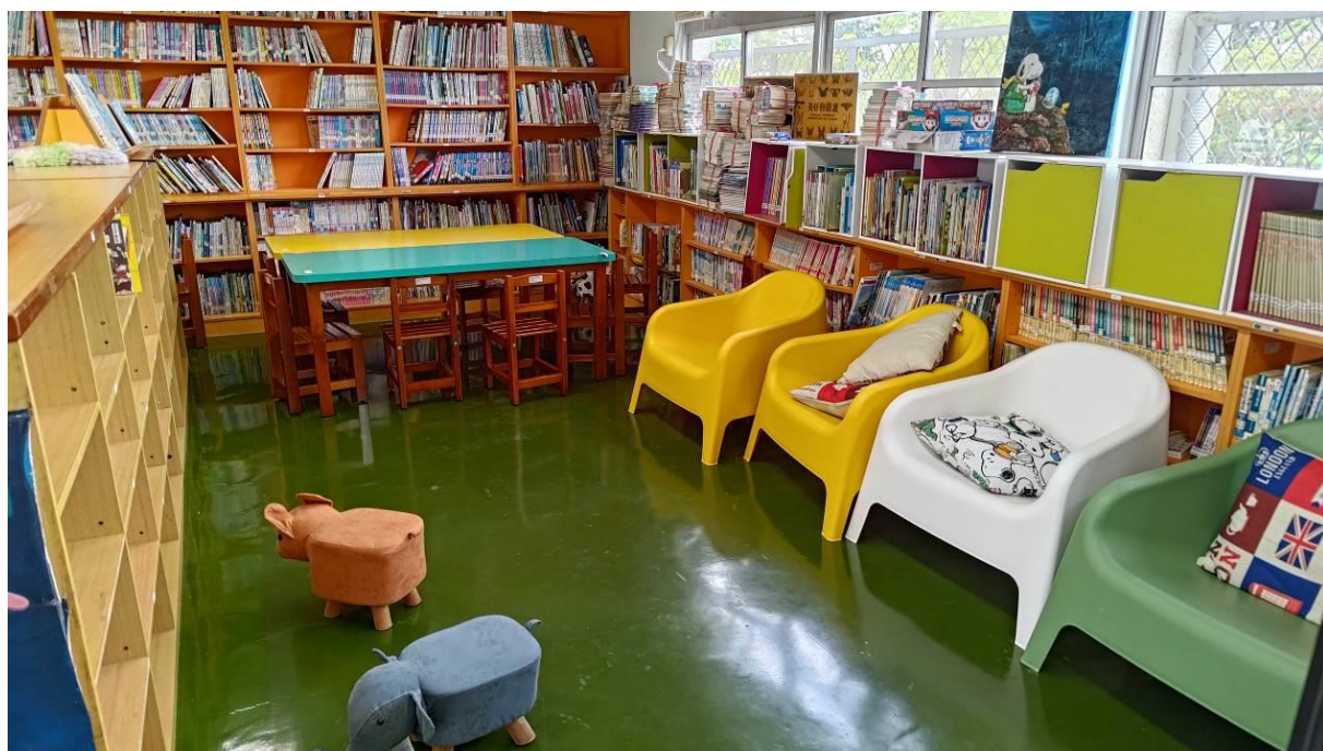
圖書室一角，給孩子舒適自在的閱讀環境