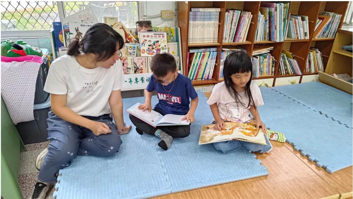
低年級教室一角，學生最喜歡的舒適閱讀小平台