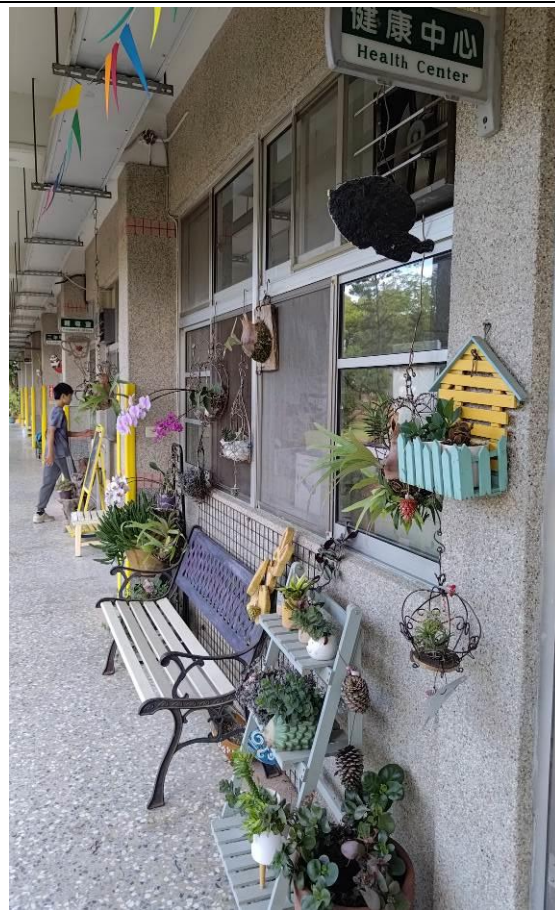
在走廊佈置各類綠色植物或花卉，一眼望去心曠神怡