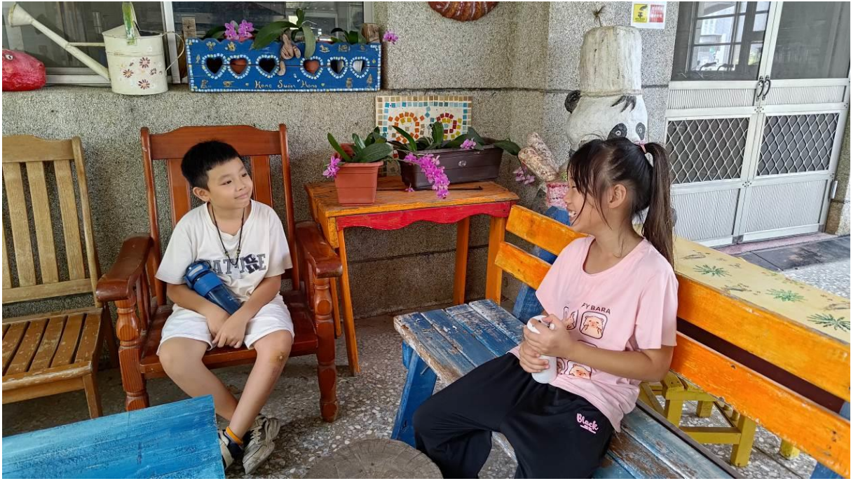
餐廳外一角，提供學生課餘聊天、聯絡情感的好地方