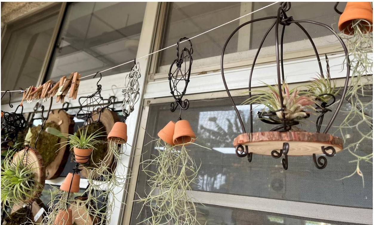
教導主任特別佈置的窗外蕨類植物，有著熱帶雨林的錯覺