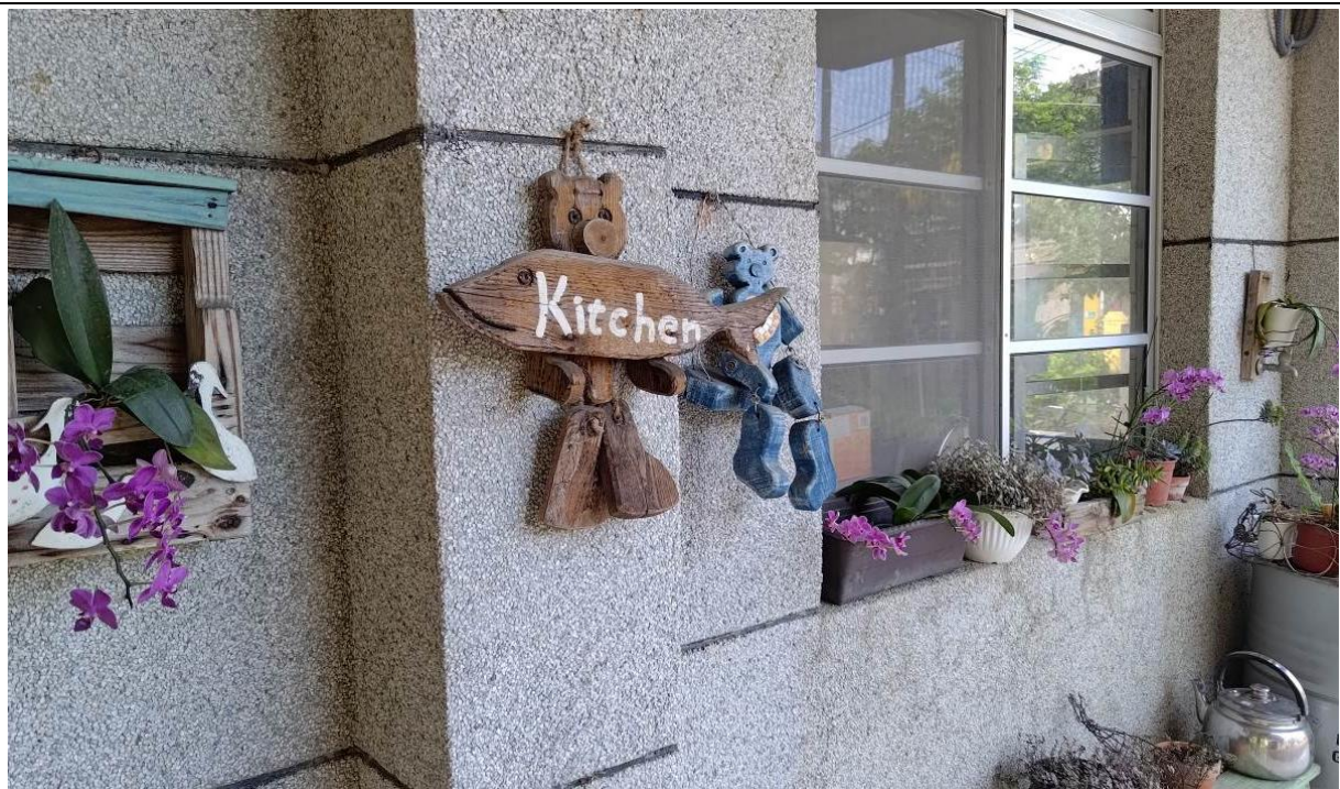
餐廳外牆，以蘭花和木造物裝飾