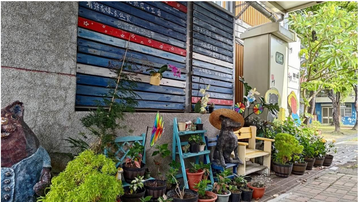
校園的一角，用綠色植物幫冰冷的電箱加溫，就算路過也讓人想駐足欣賞