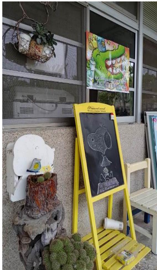
輔導室外塗鴉小黑板，學生可在上畫自己喜歡的角色