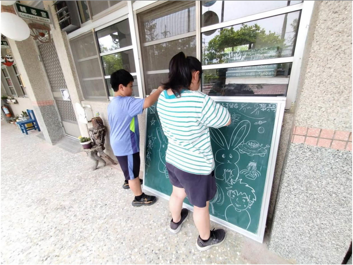
在校園走廊放置塗鴉黑板，讓學生宣洩情感