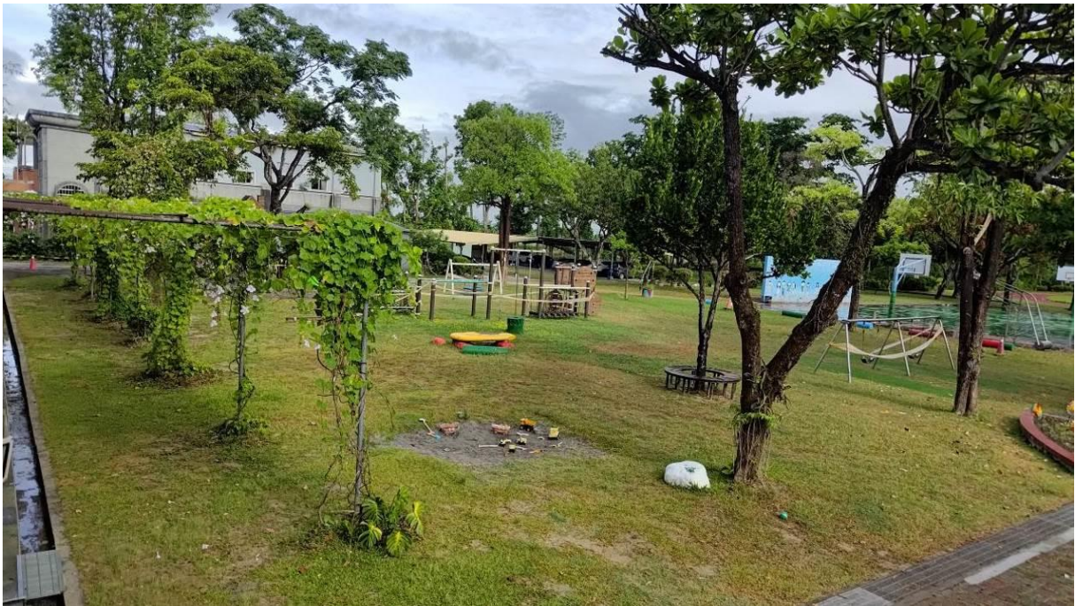
建立綠化美化校園，讓師生在舒適抗壓的環境下活動