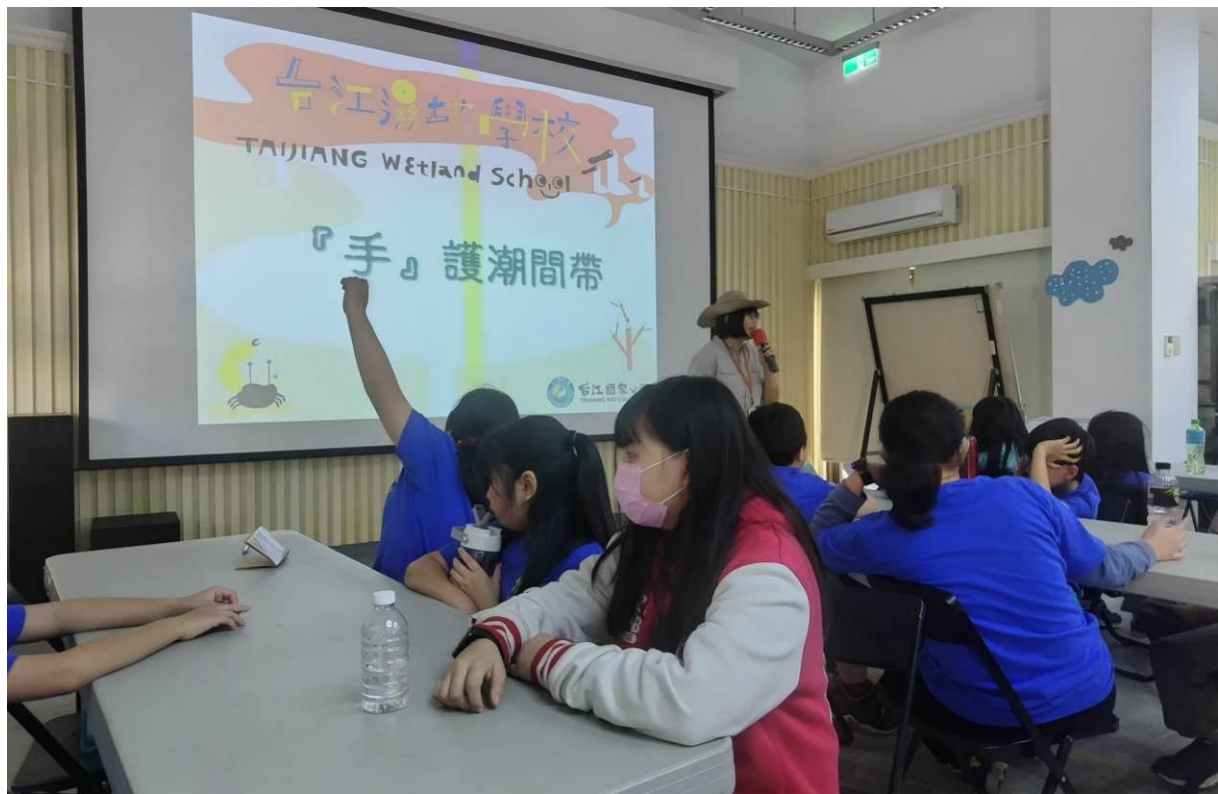
「手」護湖間帶，大家一起來淨灘