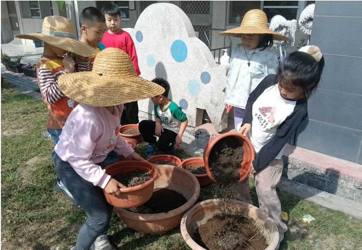
學生先整理大花盆準備來種料理必要材料—青蔥