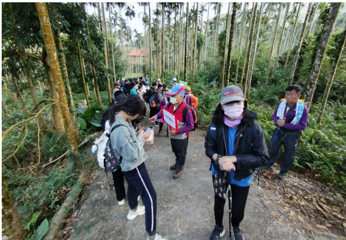
出發前在蔥鬱山林間整裝、分組、準備前進山巔