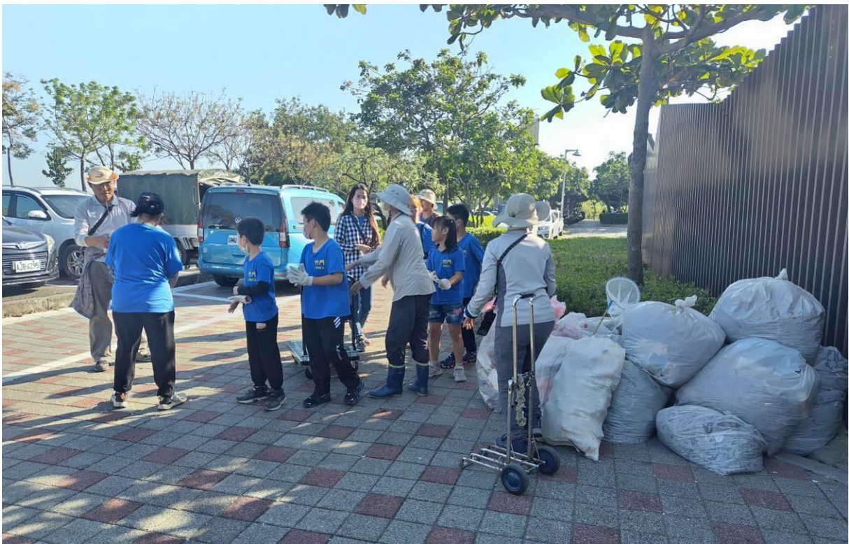
志工們感謝學生們為環境盡一分心，也種下一株愛地球的苗在心中