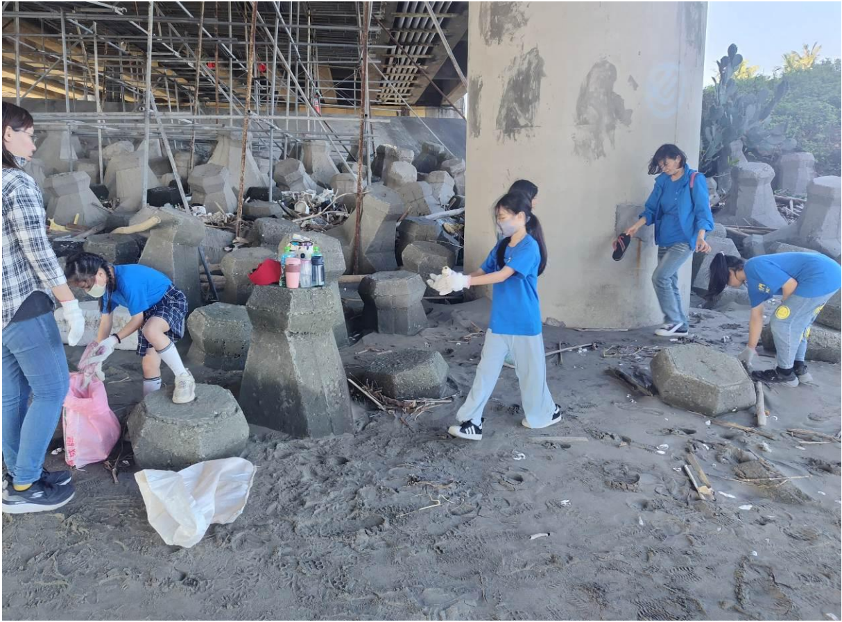
守護潮間帶的生態，大家不落人後