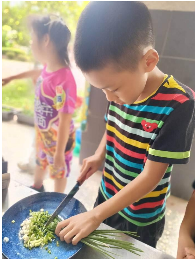
學生自主學習完成越南料理前置作業「切青蔥」