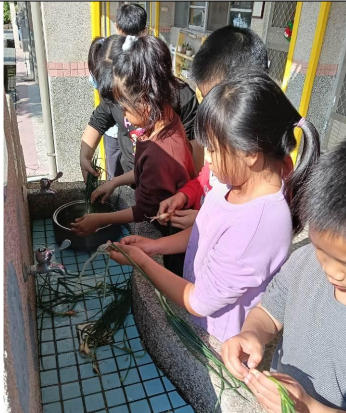
學生學習如何清除泥土與挑去青蔥的敗壞葉