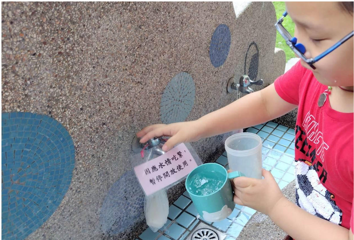
供水吃緊時，於水龍頭掛告示提醒學生用水適量節制