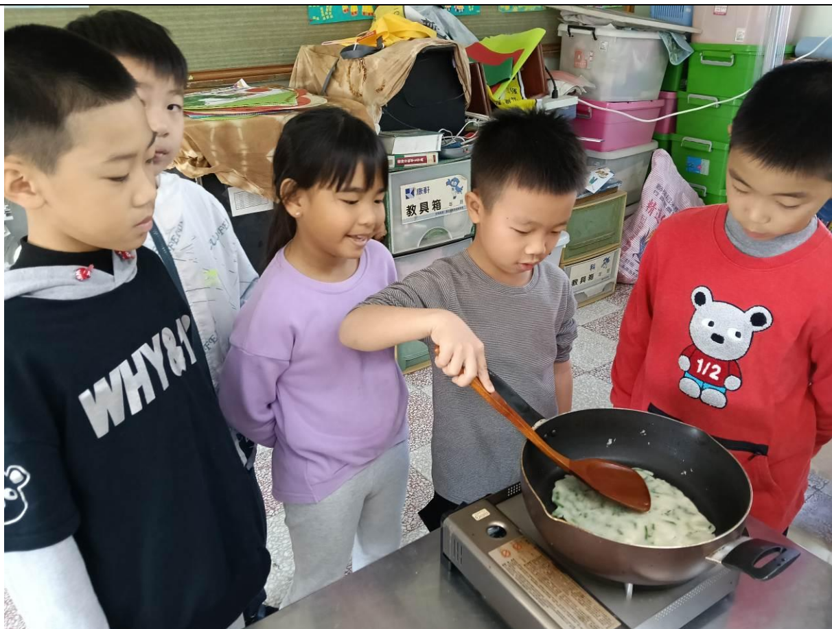
學生輪流幫蔥餅翻面，並注意火候是否剛好