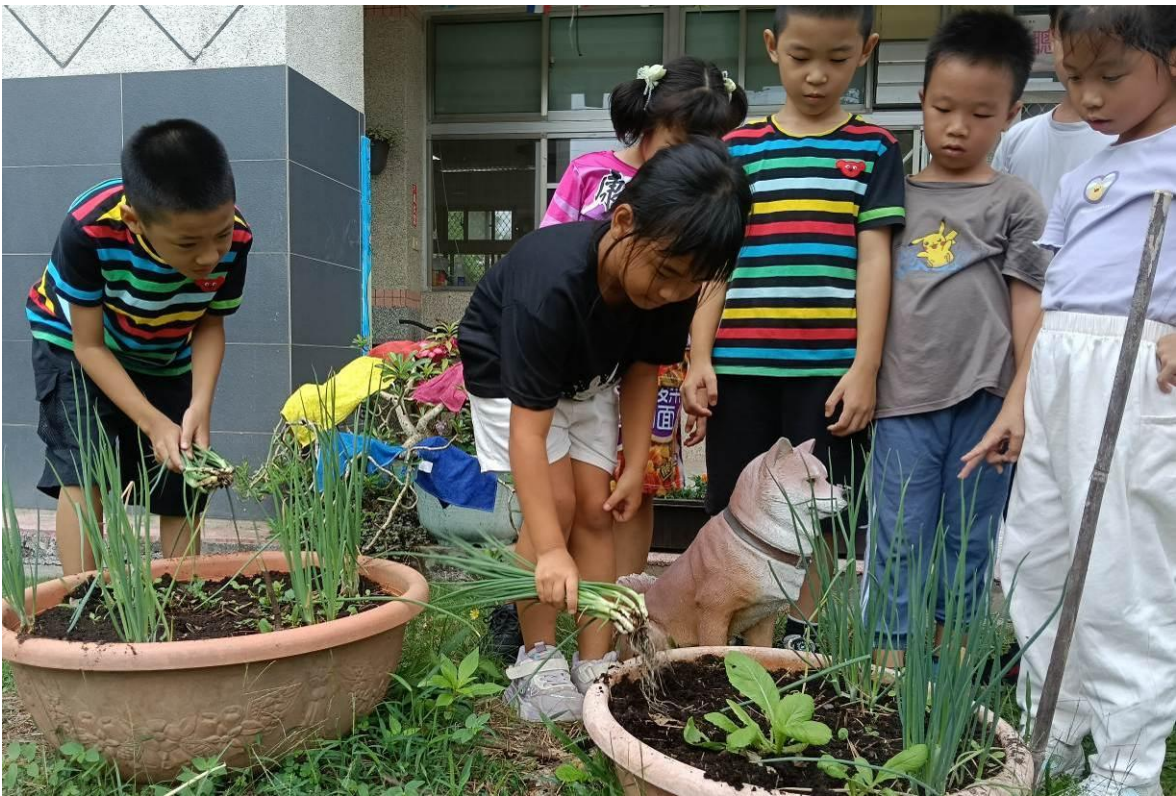
二個月後，來收成細心照顧的青蔥囉