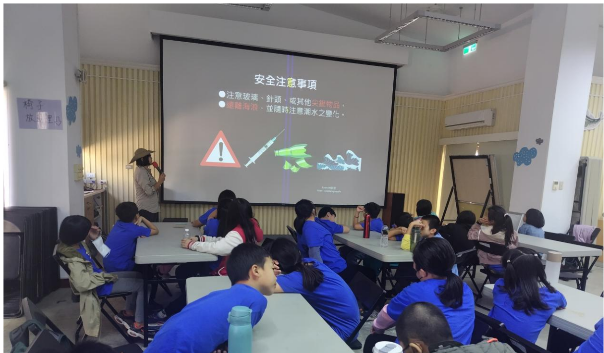
行前安全說明，為環境也要保護自己