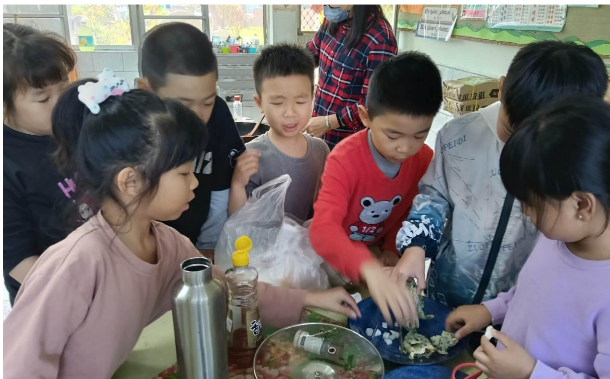
學生以自行種植青蔥，完成新鮮又好吃的蔥料理