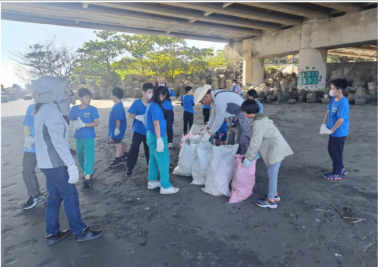
不用多久，已經檢拾到滿滿地好幾袋海灘垃圾