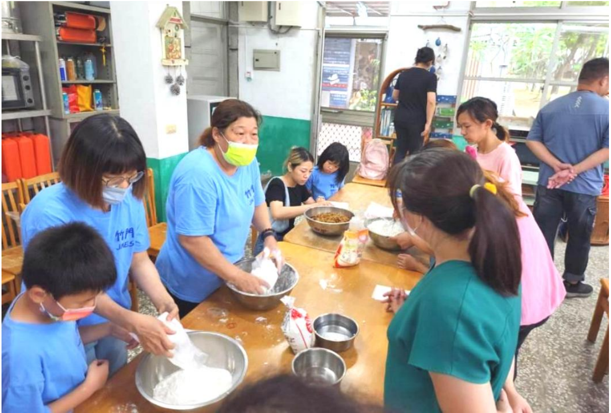
學生與師長、志工媽媽一起揉麵粉做蓮藕口味的包子