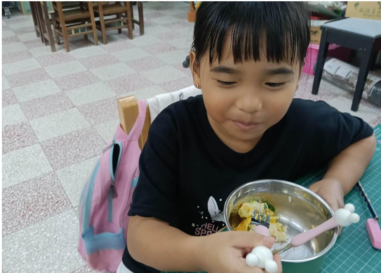
剛摘下的新鮮青蔥拿來炒蛋也超好吃的