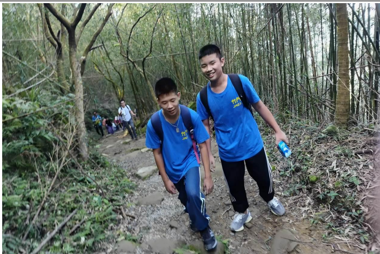
一路崎嶇蜿蜒，枝葉扶疏、空氣清新，學生談笑風生