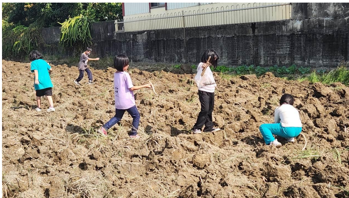
學生至蓮藕田找尋可以作為料理材料的優質脆蓮藕