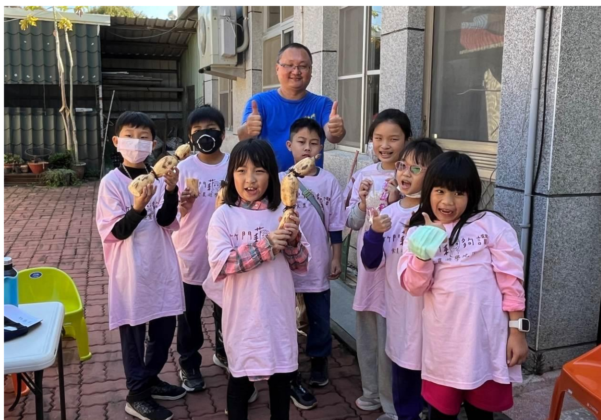
洗好蓮藕準備做鄉土料理了