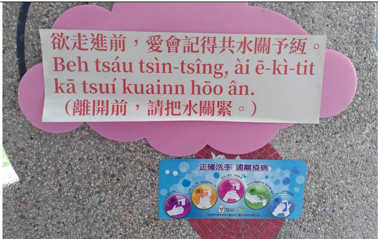
於洗手台張貼節水用法，避免多餘的浪費