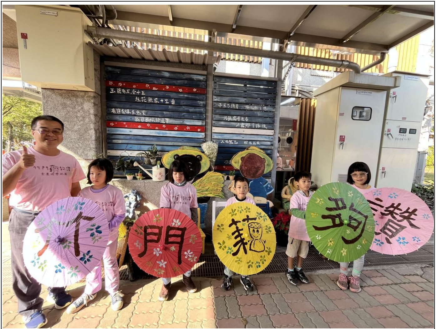
這次學生體驗之客底文化鄉土料理，只能說「藕夠讚」