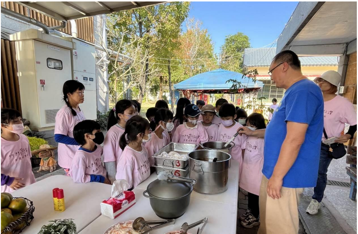
包子和蓮藕湯做好了，大家迫不及待想嚐鮮