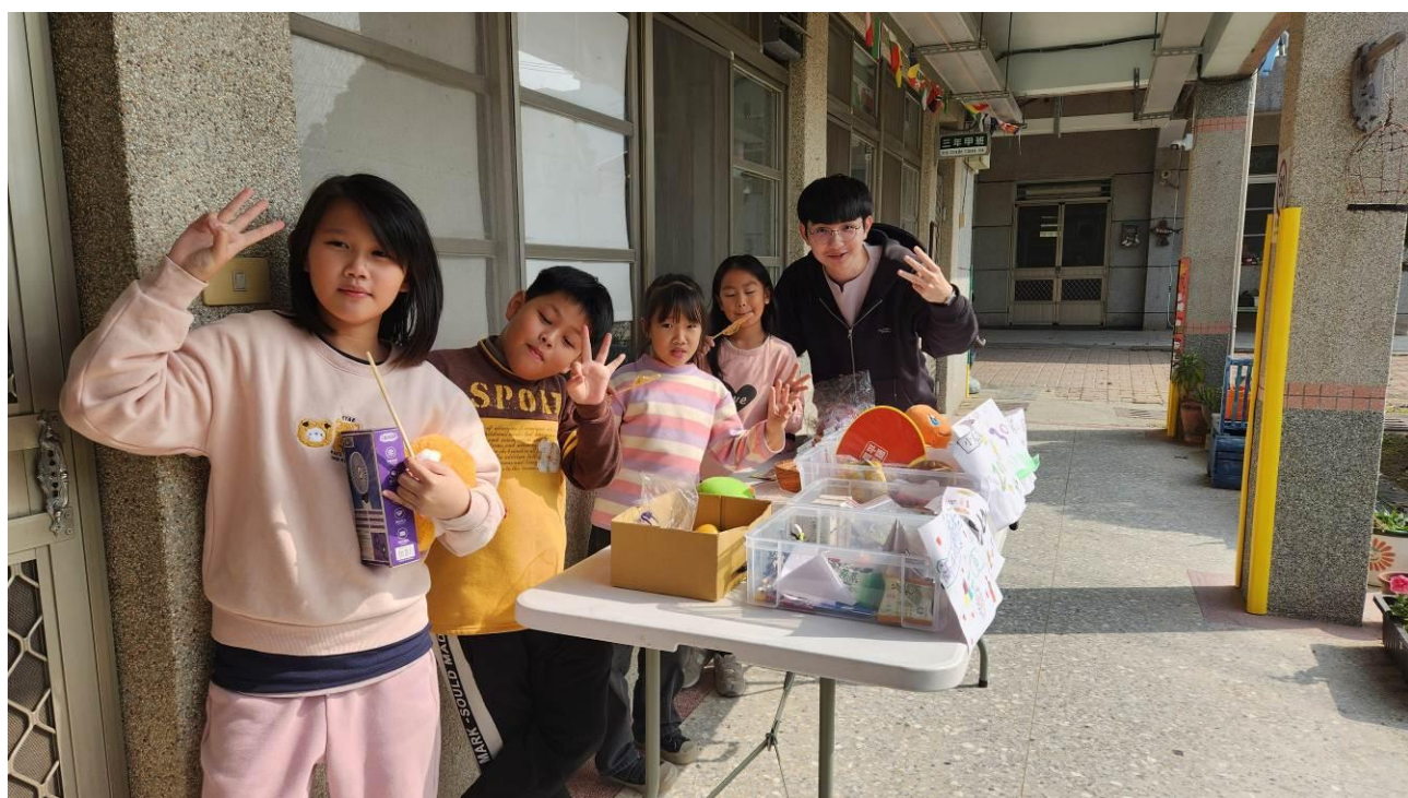
學生自行規劃跳蚤市場，給予舊物新生命、新旅程