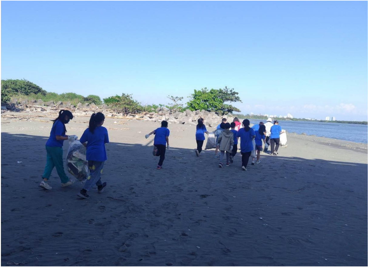
帶著垃圾離開時，沙灘已乾淨了許多，留下的是沙子和貝殼