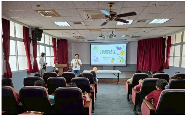
活動說明：衛生所-減鹽減糖健康吃