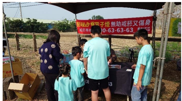
活動說明：衛生所推廣無菸社區