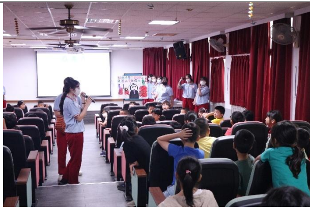
活動說明：敏惠護專-健促宣導