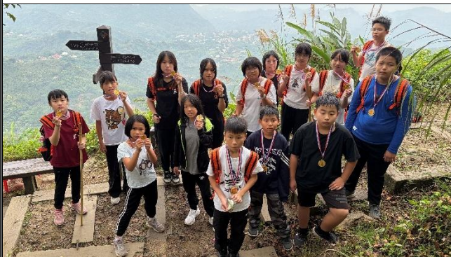
活動說明：白河區公所舉辦山野教育活動-健行雞籠山