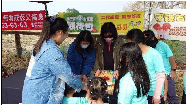
活動說明：衛生所推廣無菸社區