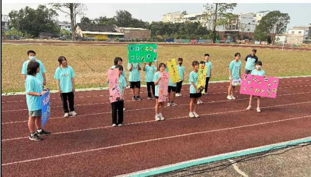
活動說明：校慶進場-健康體位宣 導