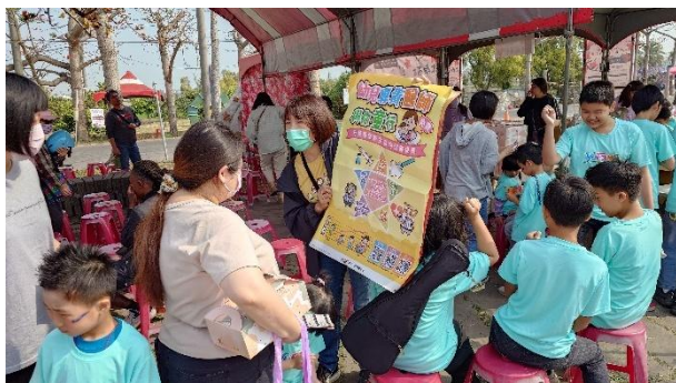
活動說明：衛生所推廣幼兒專責醫師