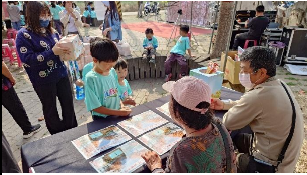
活動說明：衛生所推廣無菸社區