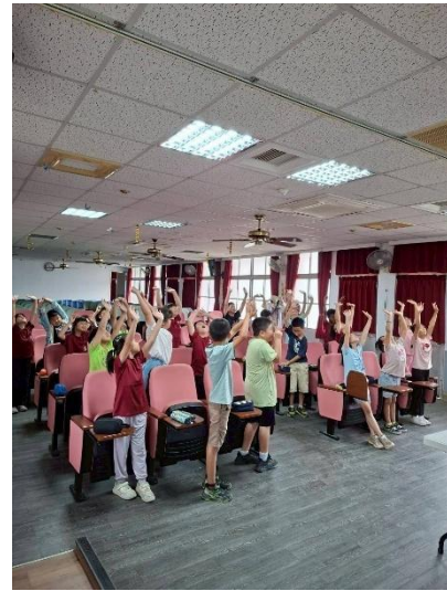
活動說明：衛生所講師帶動跳