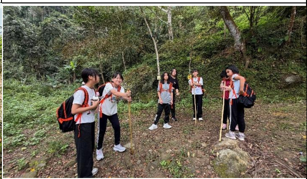
活動說明：白河區公所舉辦山野教育活動-健行雞籠山