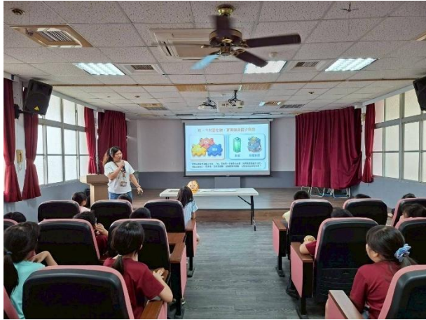
活動說明：衛生所共同推動健康餐盤