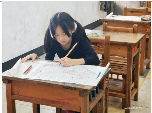
活動說明：健促議題圖畫創作