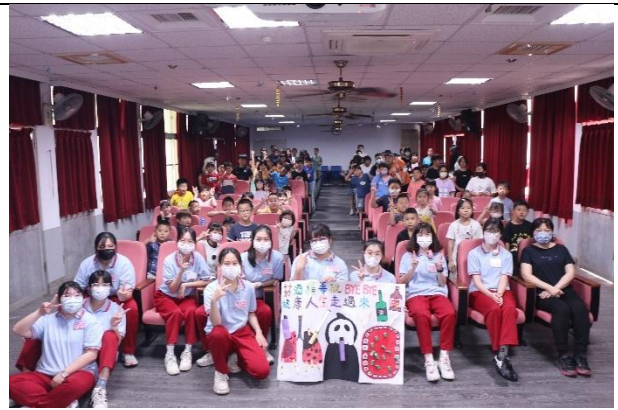
活動說明：敏惠護專-健促宣導