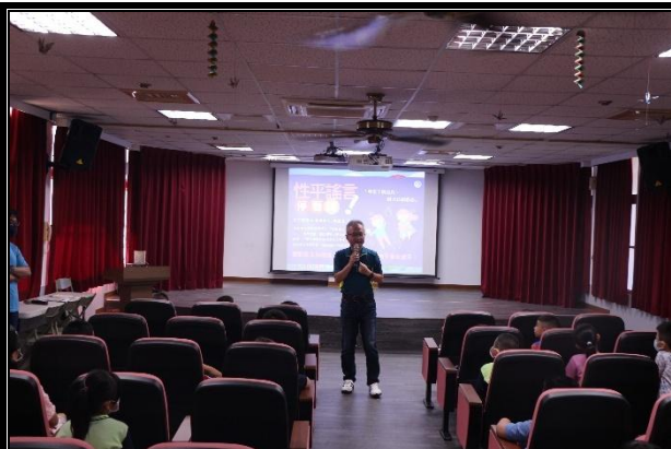
活動說明：始業式-性平宣導