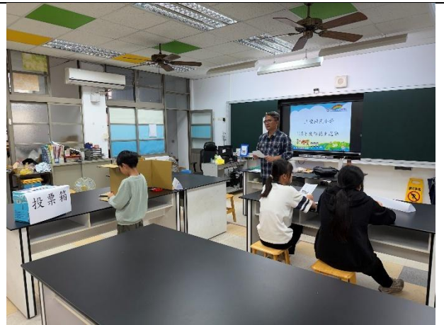
活動說明：模範生選舉