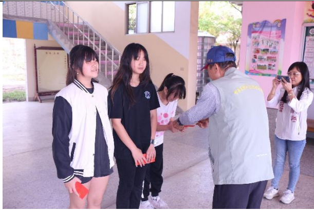
活動說明：獎助學金