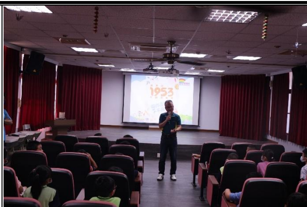
活動說明：始業式-反霸凌宣導