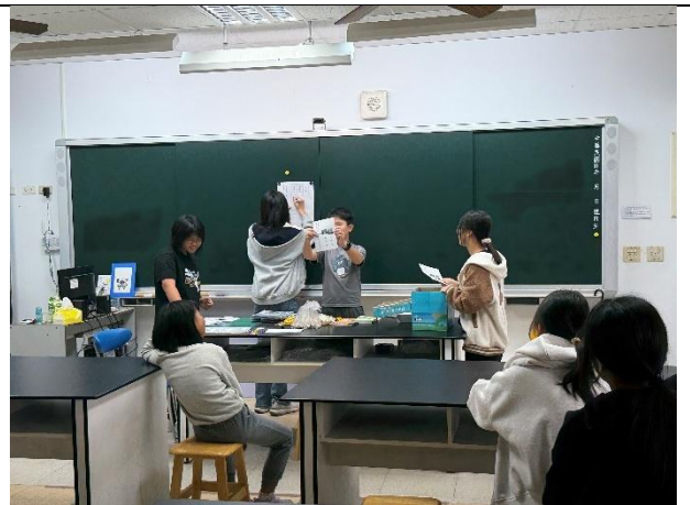
活動說明：模範生選舉