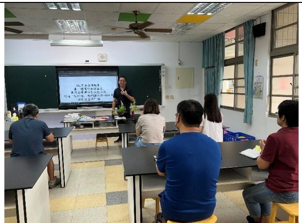
活動說明：社會情緒研習