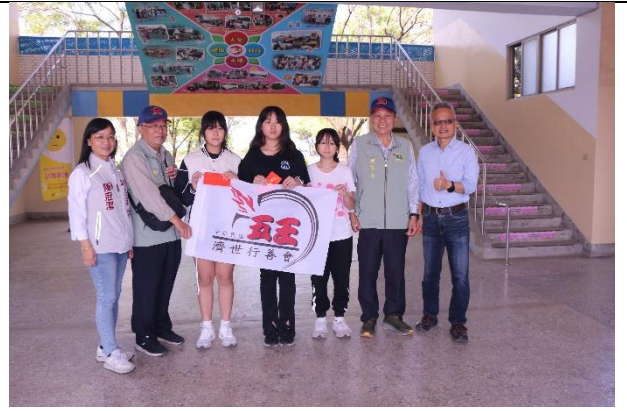
活動說明：獎助學金