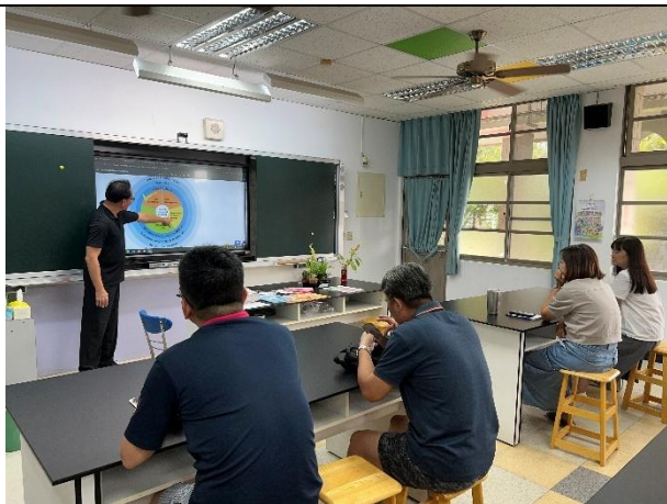
活動說明：社會情緒研習