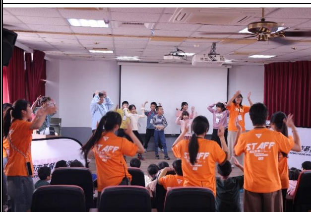
活動說明：YMCA 育樂營-有氧舞蹈帶動跳