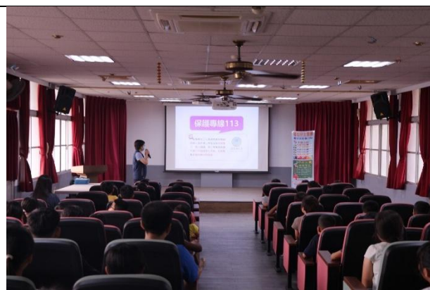
活動說明：白河分局-113 專線