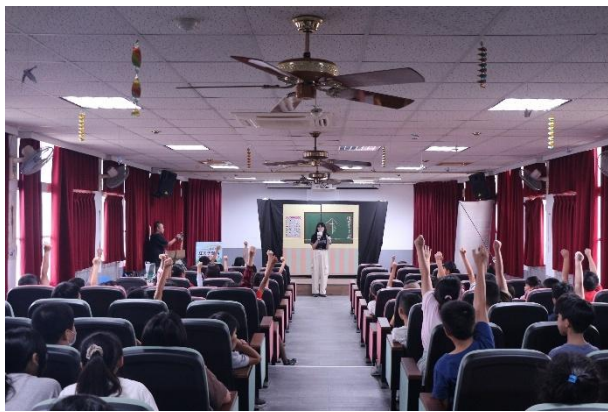
活動說明：品德教育劇場