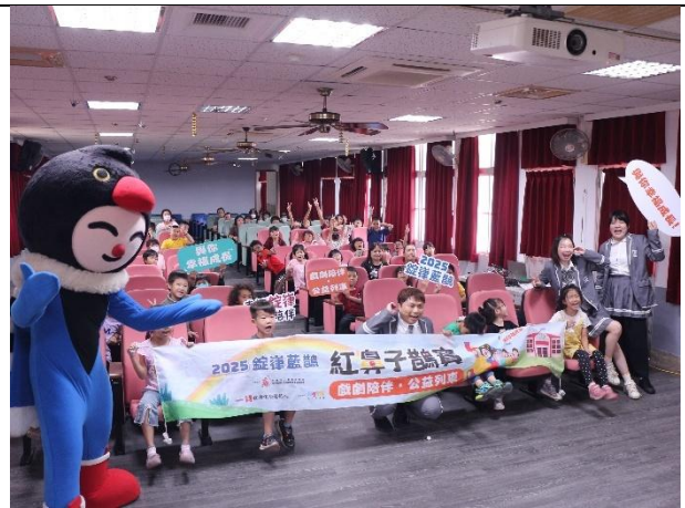
活動說明：品德教育劇場