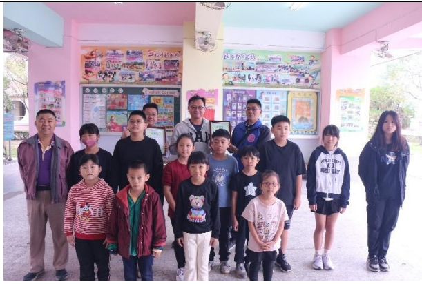
活動說明：社區發展協會鞋子捐贈