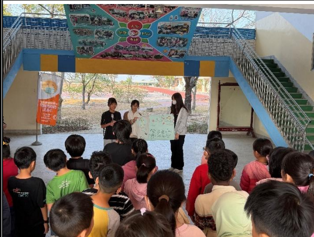
活動說明：健康體位推動大使於升旗時間進行宣導