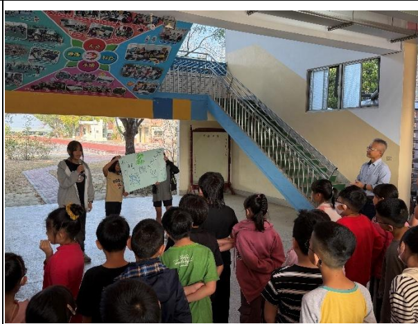
活動說明：健康體位推動大使於升旗時間進行宣導