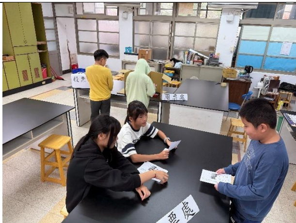
活動說明：模範生選舉