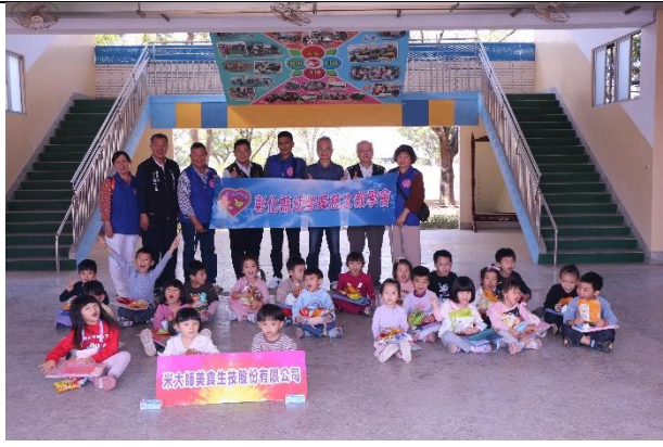
活動說明：聖誕禮物捐贈