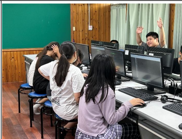
活動說明：參加 114 年臺南市衛教宣導主軸-「無菸大家醫守護戰@Tainan」