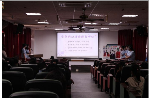
活動說明：衛生所-心理健康