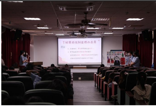
活動說明：衛生所-性平宣導