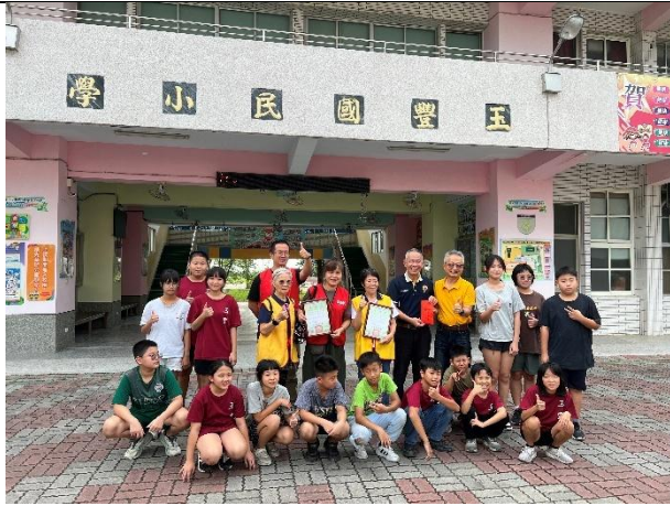
活動說明：親慈慈善會捐贈