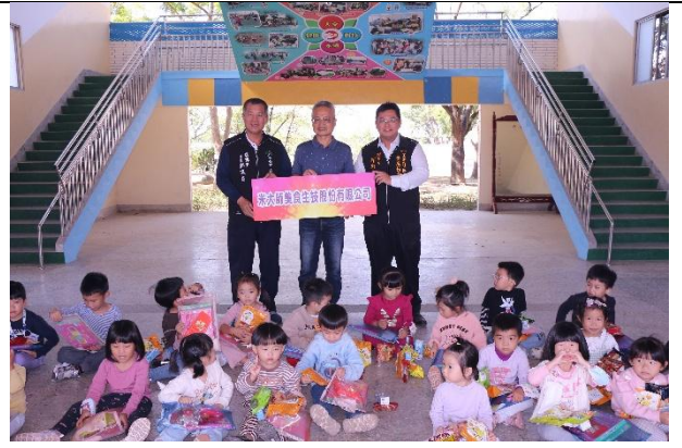
活動說明：聖誕禮物捐贈