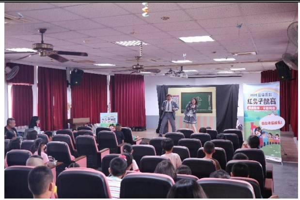
活動說明：品德教育劇場