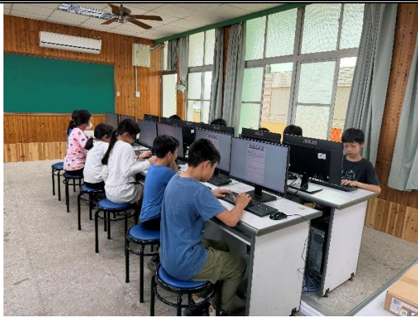
活動說明：性平線上測驗