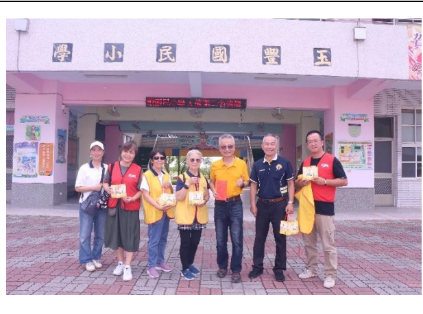
活動說明：親慈慈善會捐贈