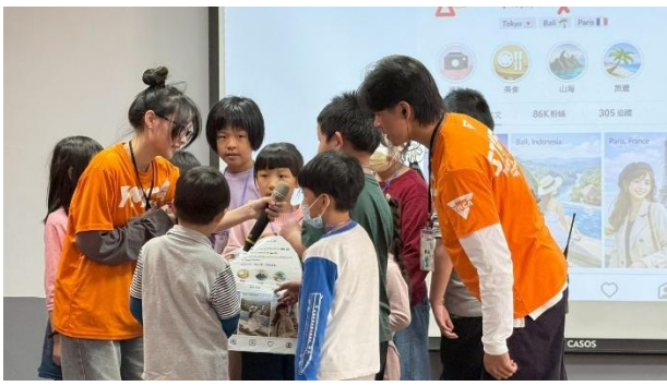
活動說明：YMCA 育樂營-健促宣導