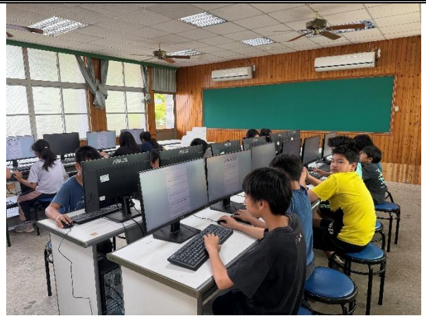
活動說明：性平線上測驗