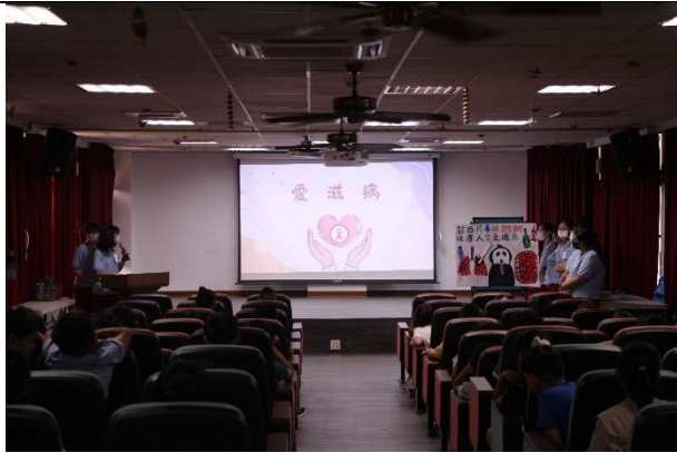
活動說明：衛生所-愛滋病宣導