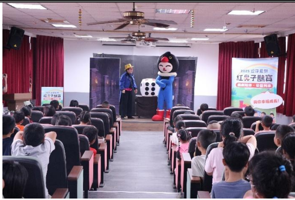
活動說明：品德教育劇場