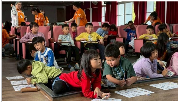
活動說明：YMCA 育樂營-健促宣導