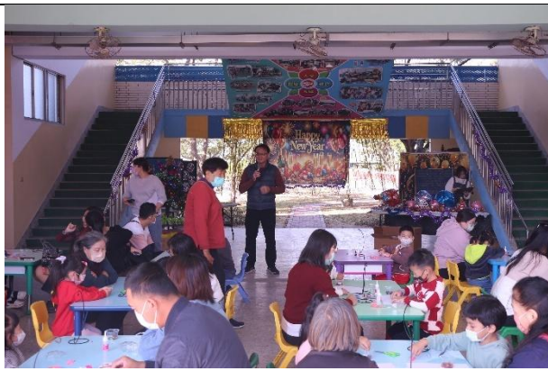
活動說明：親師生互動