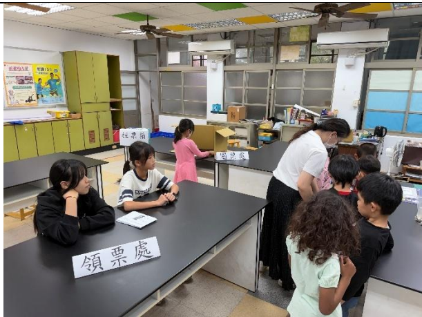
活動說明：模範生選舉