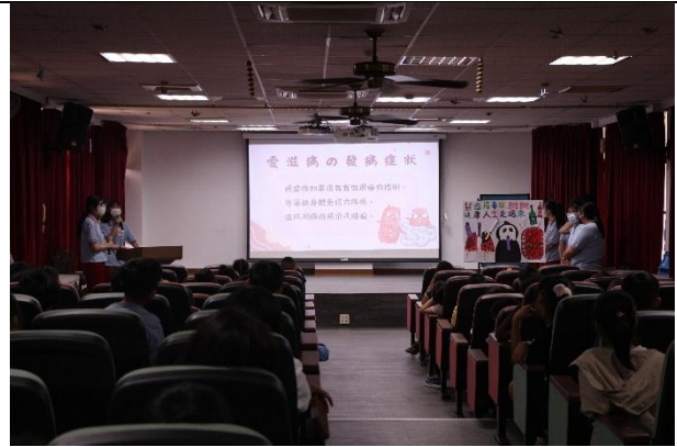
活動說明：衛生所-愛滋病宣導