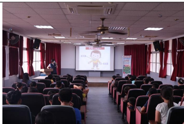
活動說明：白河分局-性騷擾防治 宣導