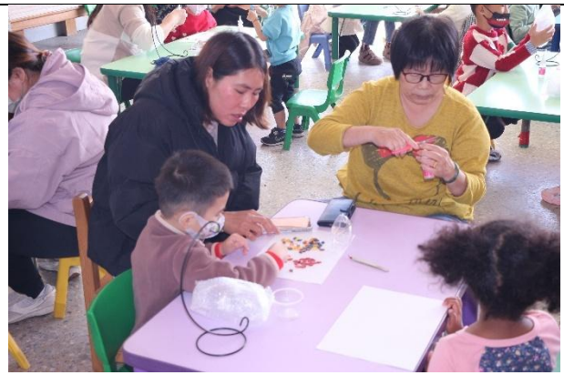
活動說明：親師生互動