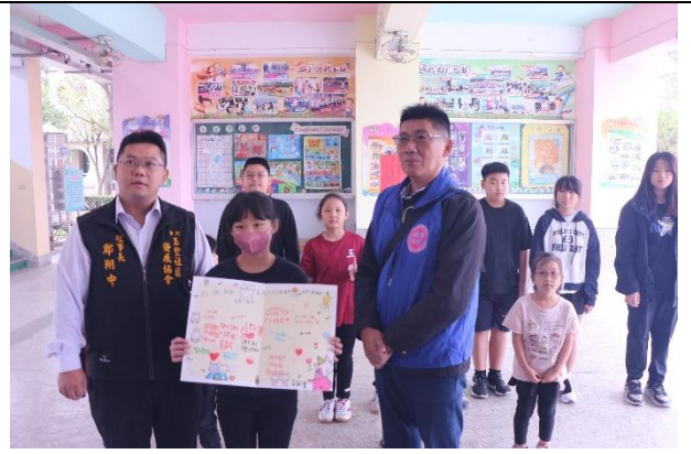
活動說明：社區發展協會鞋子捐贈