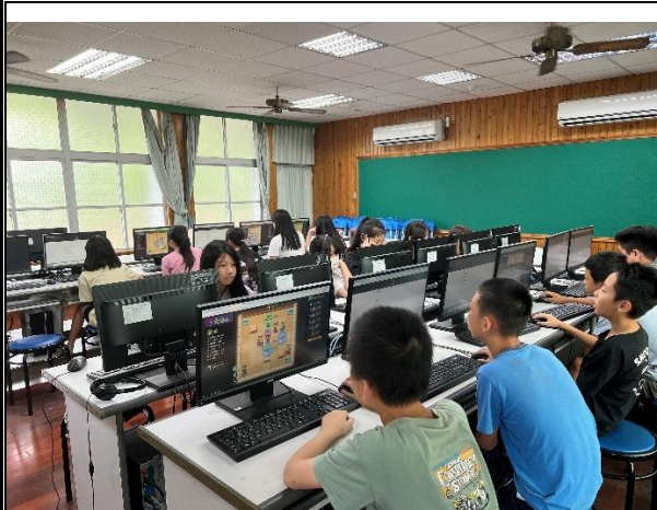
活動說明：參加 114 年臺南市衛教宣導主軸-「無菸大家醫守護戰@Tainan」