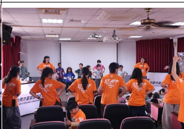
活動說明：YMCA 育樂營-有氧舞蹈帶動跳