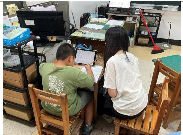
活動說明：學生個別輔導