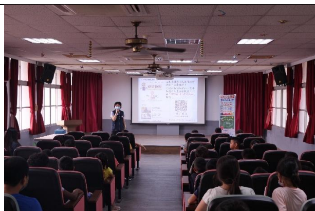
活動說明：白河分局-婦幼宣導