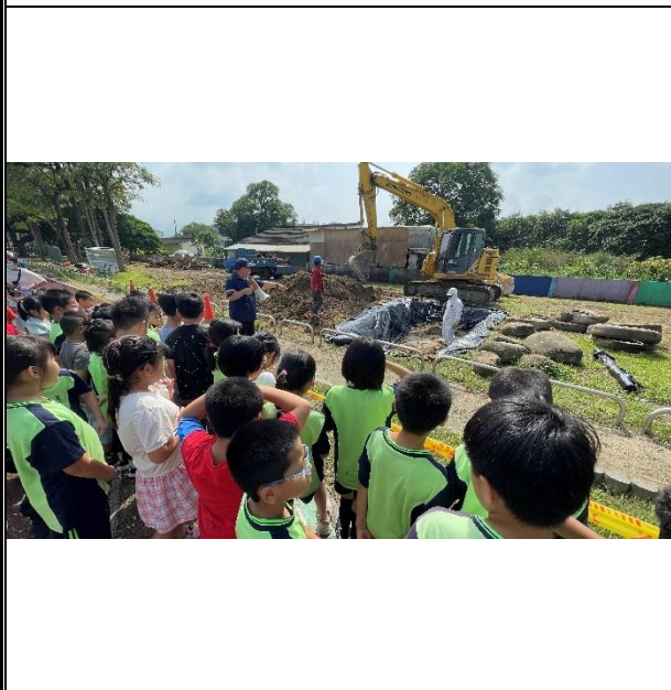
活動說明：褐根病防治教學