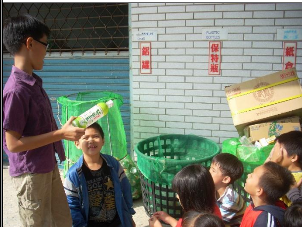
活動說明：訓練學生資源分類與回收工作