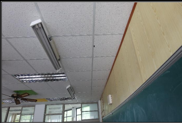
活動說明：替換節能燈具