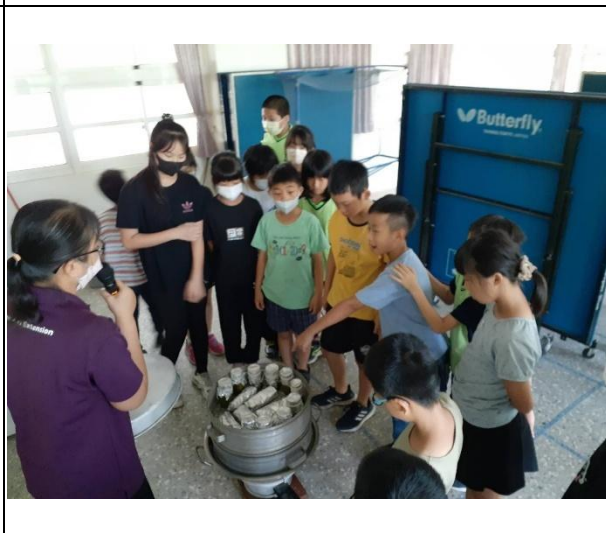
活動說明：學校老師利用夏日樂學帶領學生做竹筒飯