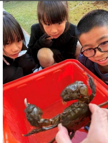
活動說明：生態教學-認識毛蟹