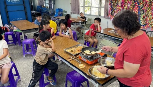
活動說明：四健會-在地食材製作鬆餅