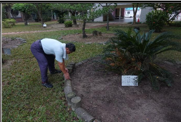
活動說明：廢棄水泥試體做為花園景觀布置