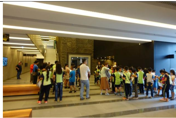
活動說明：參訪臺南市仁德水資源回收中心