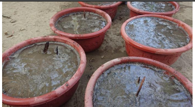
活動說明：蓮花育苗