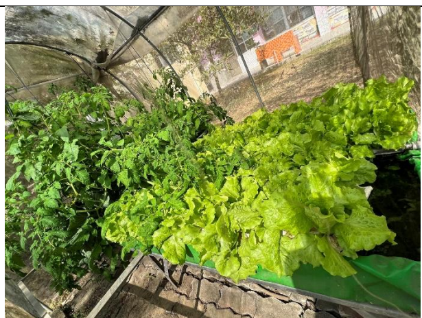
活動說明：水耕蔬菜成熟後