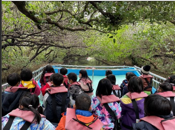
活動說明：環境教育-四草綠色隧道