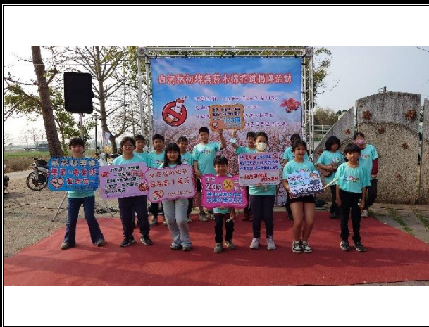
活動說明：無菸社區揭牌