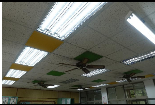
活動說明：替換節能燈具