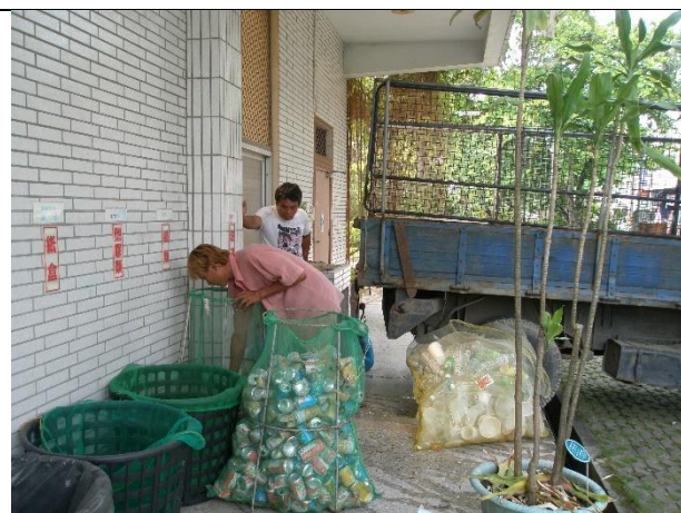
活動說明：落實資源回收-媒合個體業者實施回收