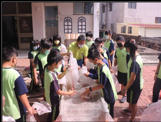
活動說明：將軍山農場到校進行食農教育