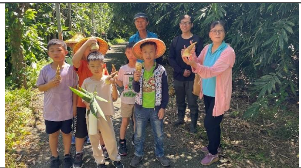
活動說明：學校老師利用夏日樂學帶領學生挖在地竹筍