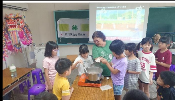
活動說明：四健會-在地食材製作藕茶