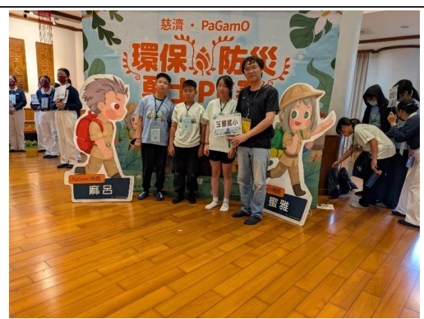
活動說明：參加慈濟 pagamo 環保勇士 PK 賽