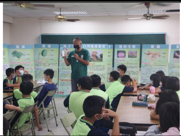
活動說明：將軍山農場到校進行食農教育