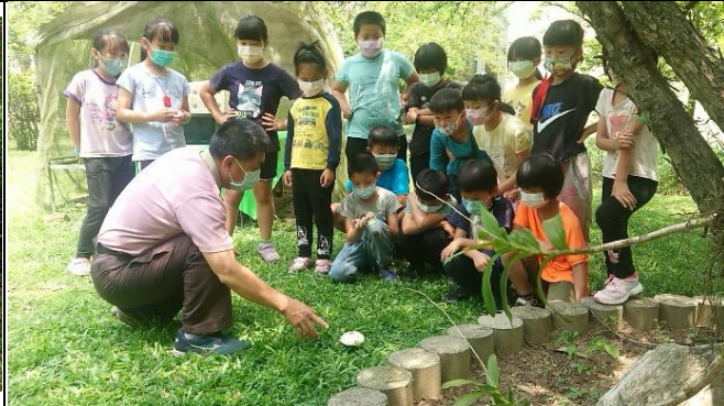
活動說明：生態教育-綠褶菇