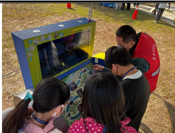
活動說明：認識水從哪裡來