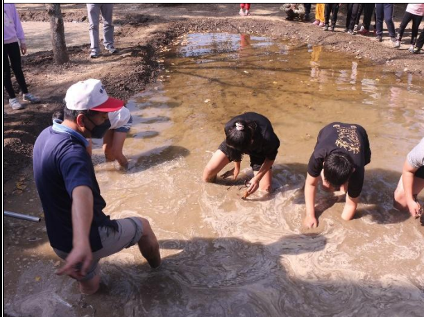
活動說明：校園蓮田耕作