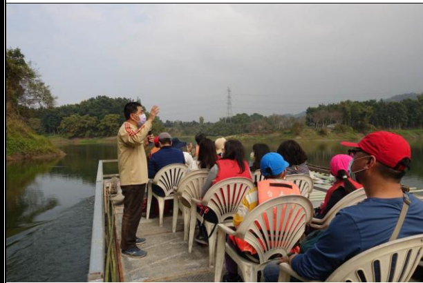
活動說明：參訪白河水庫-認識水資源與困境