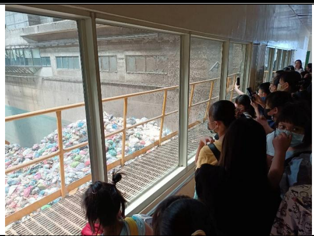
活動說明：環境教育-參觀焚化爐