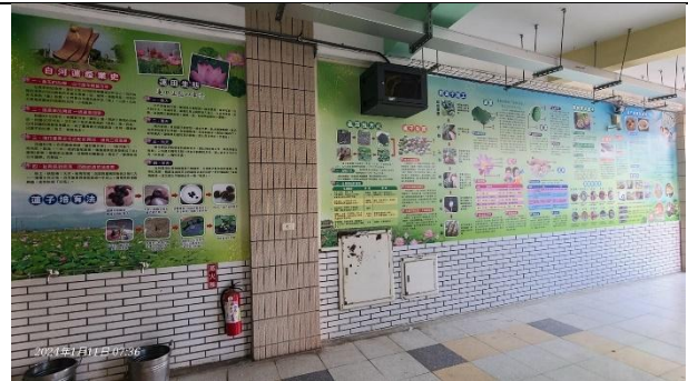
活動說明：生態教學-環境布置