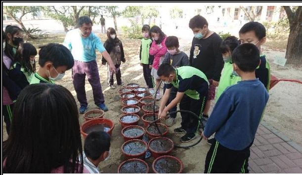
活動說明：蓮花育苗