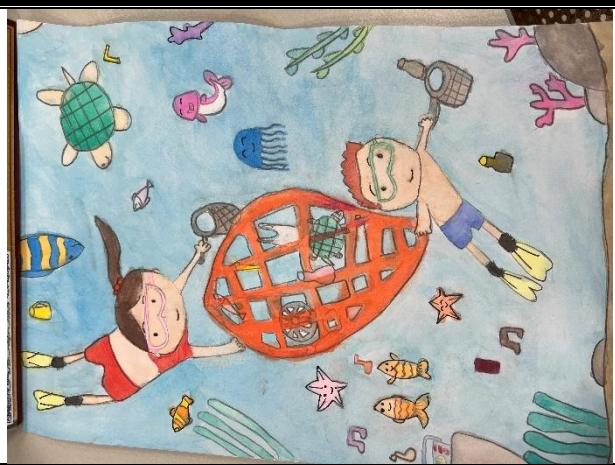
活動說明：參加永續繪畫比賽