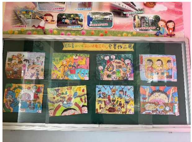
活動說明：我的健康食刻作品展