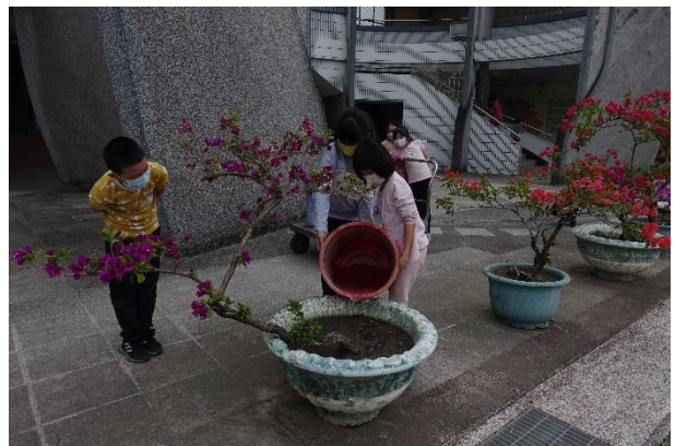
活動說明：指導小朋友利用回收水澆灌植栽