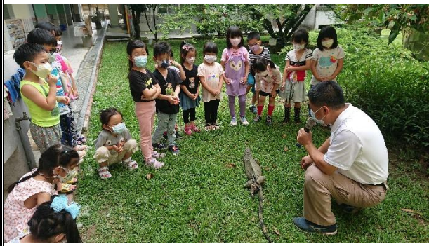
活動說明：生態教育-綠鬣蜥