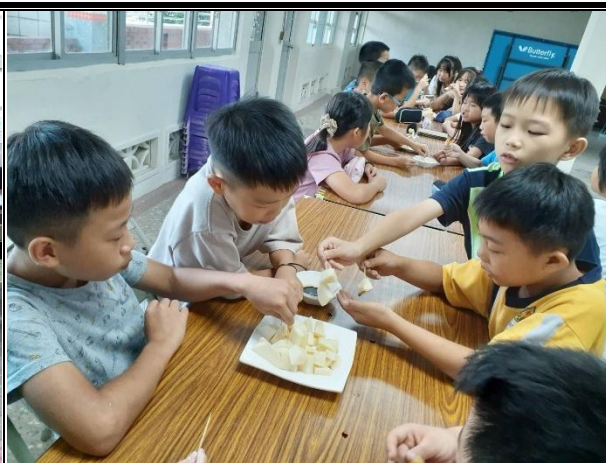
活動說明：品嚐現挖的竹筍