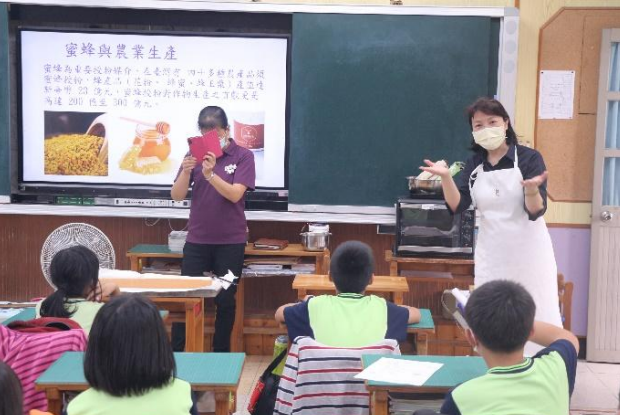
活動說明：四健會-蜂蜜蛋糕製作