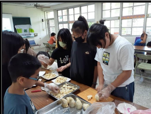
活動說明：品嚐現挖的竹筍