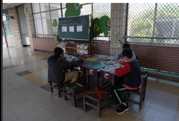
活動說明：損壞課桌椅整理改造後供讀報區使用