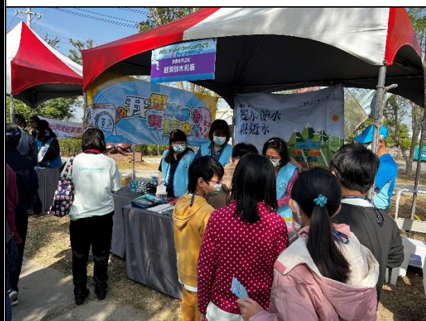
活動說明：參與水利署節水活動