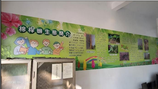
活動說明：生態教學-環境布置