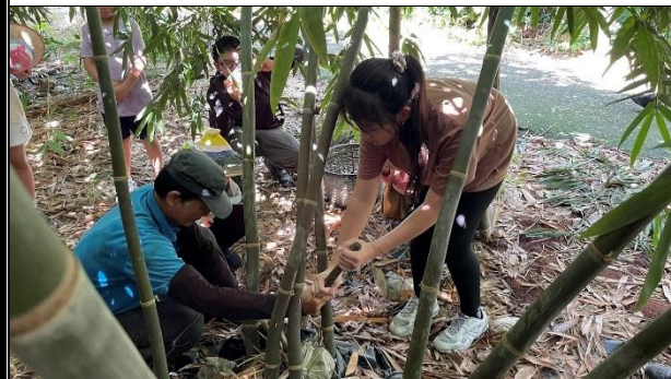
活動說明：學校老師利用夏日樂學帶領學生挖在地竹筍