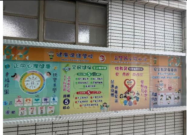
活動說明：健康促進-環境布置