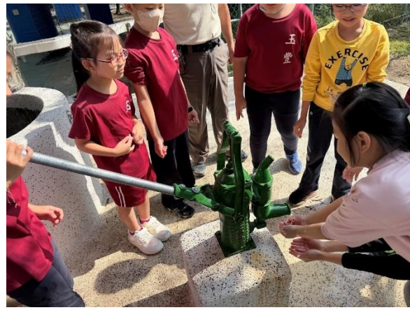
活動說明：飲水思源-古井風華再現