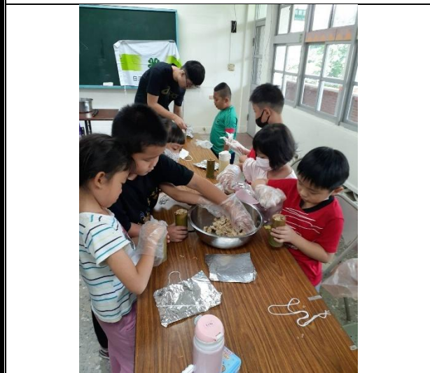
活動說明：學校老師利用夏日樂學帶領學生做竹筒飯