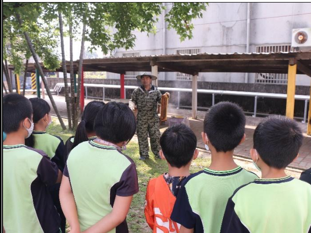
活動說明：蜜蜂教學