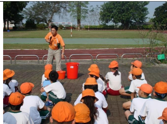
活動說明：宣導水資源回收方式與重要性