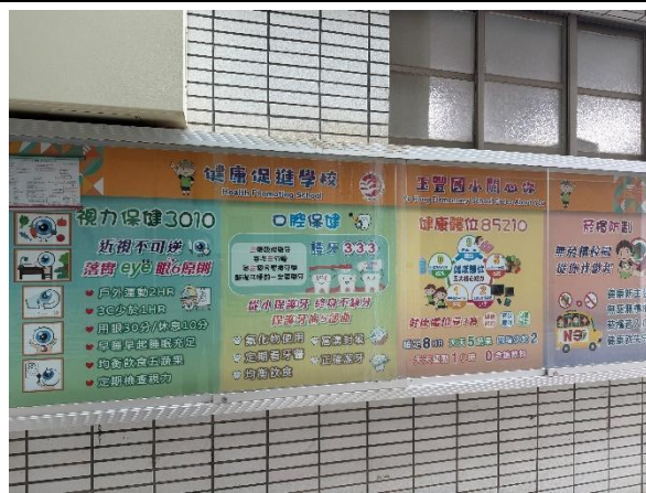
活動說明：健康促進-環境布置