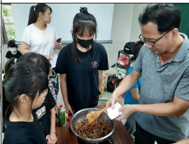
活動說明：學校老師利用夏日樂學帶領學生做竹筒飯