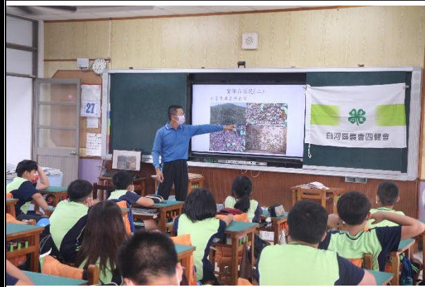
活動說明：四健會-蜜蜂與環境教學