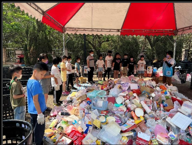
活動說明：環境教育-垃圾分類