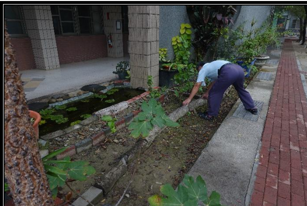
活動說明：枯死樹幹布置花園景觀