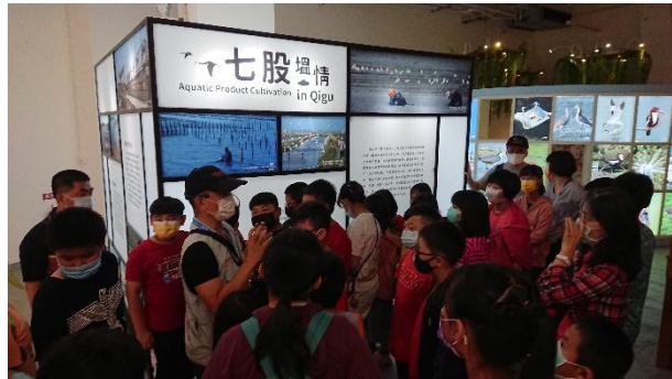
活動說明：環境教育-七股鹽山