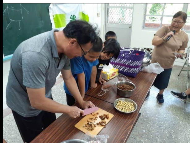
活動說明：學校老師利用夏日樂學帶領學生做竹筒飯