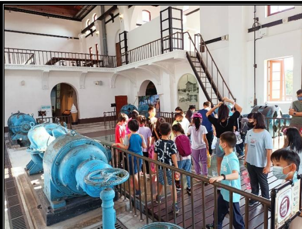
活動說明：環境教育-水道博物館