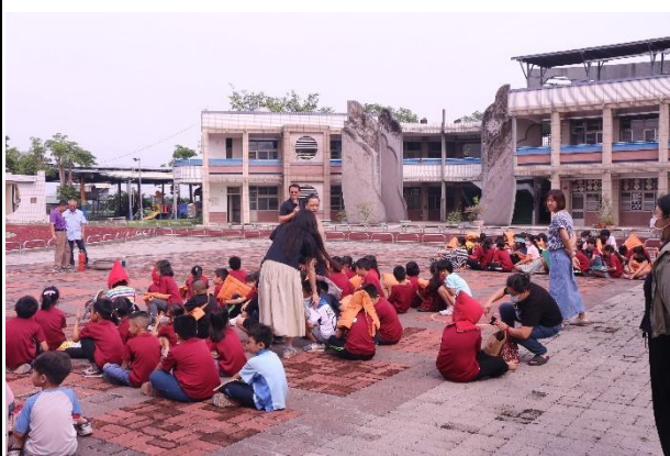
活動說明：防震演練