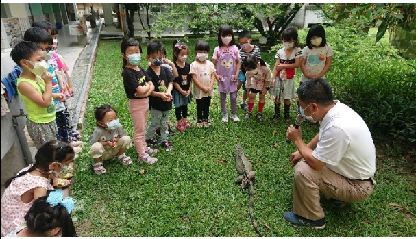
活動說明：生態教育-綠鬣蜥