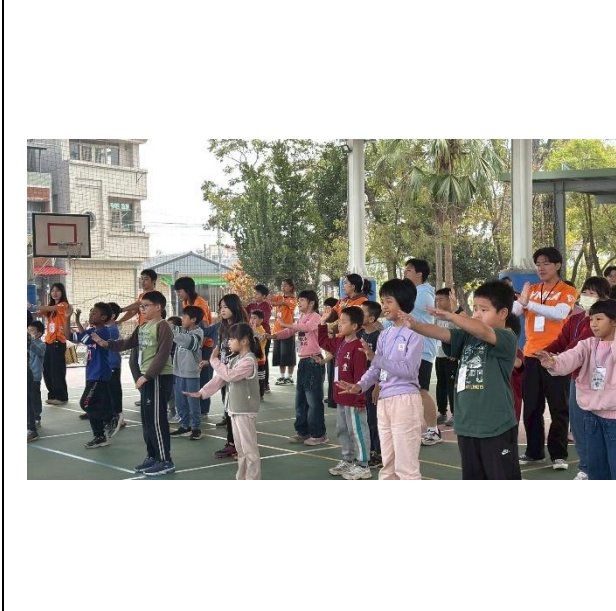
活動說明：指導學生暖身運動