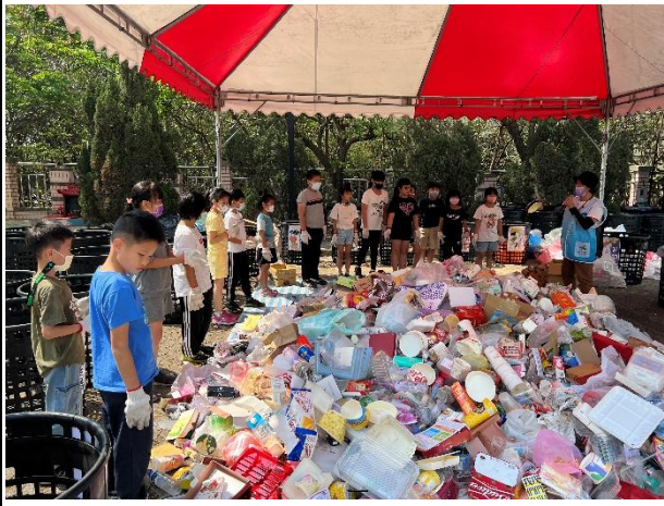
活動說明：環境教育-垃圾分類