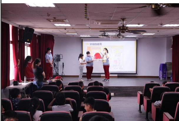
活動說明：指導學生使用牙線