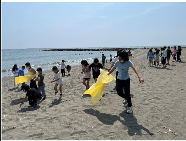
活動說明：帶學生淨灘