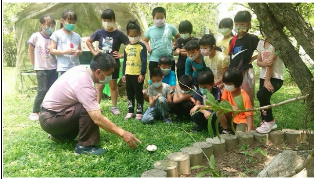
活動說明：生態教育-綠褶菇