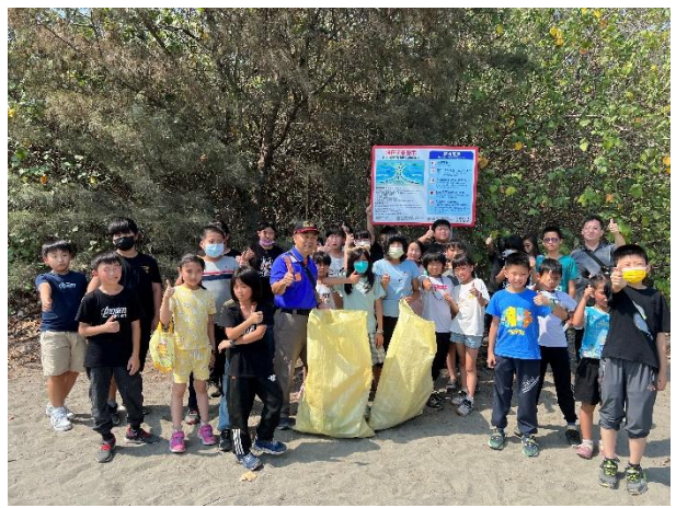
活動說明：帶學生淨灘