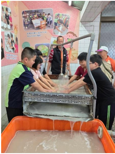
活動說明：主任指導學生洗藕粉