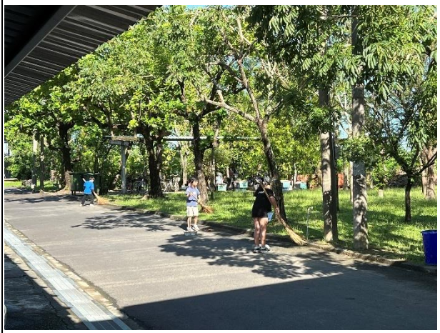
活動說明：整潔工作指導