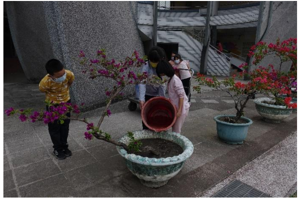
活動說明：指導小朋友利用回收水 澆灌植栽