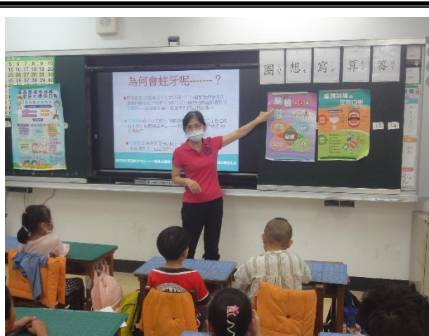
活動說明：護理師入班進行口腔保健宣導