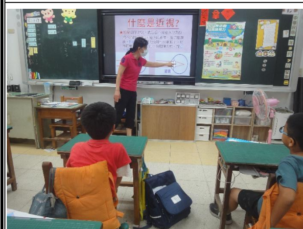
活動說明：護理師入班進行視力保健宣導