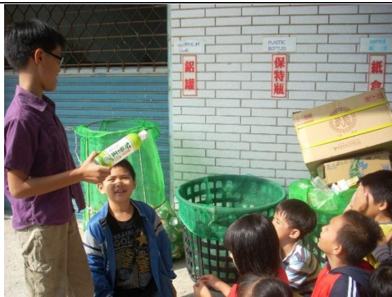
活動說明：訓練學生資源分類與 回收工作