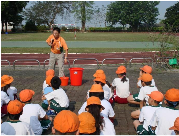
活動說明：宣導水資源回收方式 與重要性