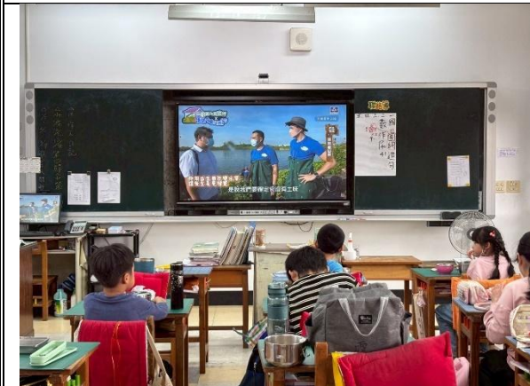
活動說明：餐前五分鐘