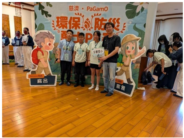
活動說明：參加慈濟 pagamo 環保勇士 PK 賽