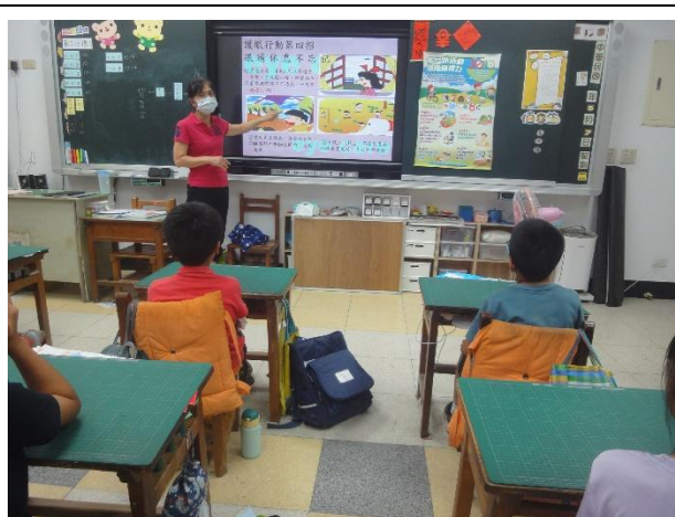
活動說明：護理師入班進行視力保健宣導