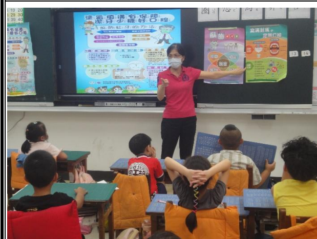
活動說明：護理師入班進行健康體位宣導