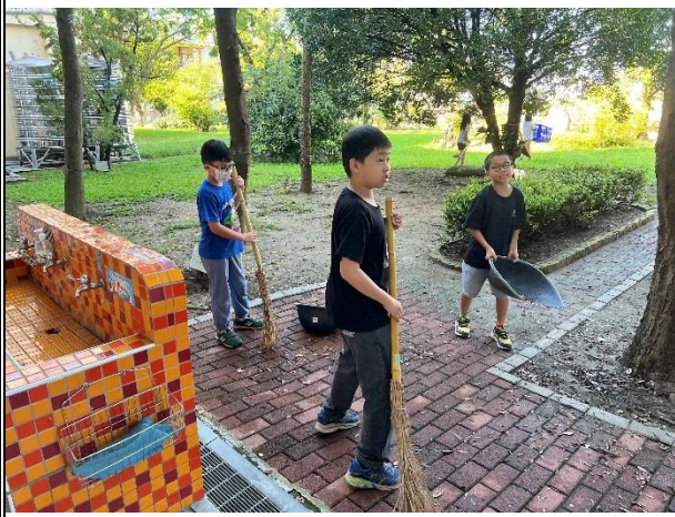
活動說明：整潔工作指導