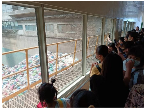
活動說明：環境教育-參觀焚化爐