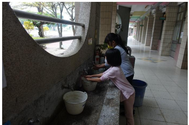
活動說明：教導學生節約用水，做 好中水回收工作