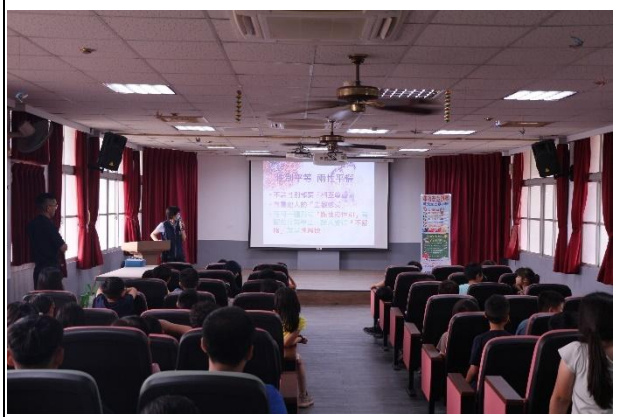
活動說明：婦幼安全宣導