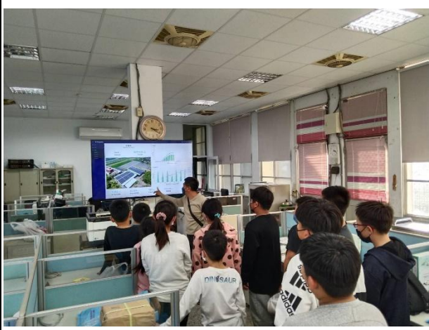
活動說明：利用太陽能發電顯示幕進行再生能源教學