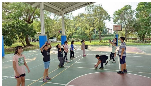
活動說明：指導學生排球