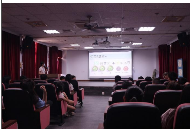
活動說明：天天五蔬果