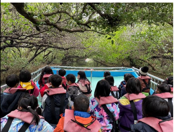
活動說明：環境教育-四草綠色隧道