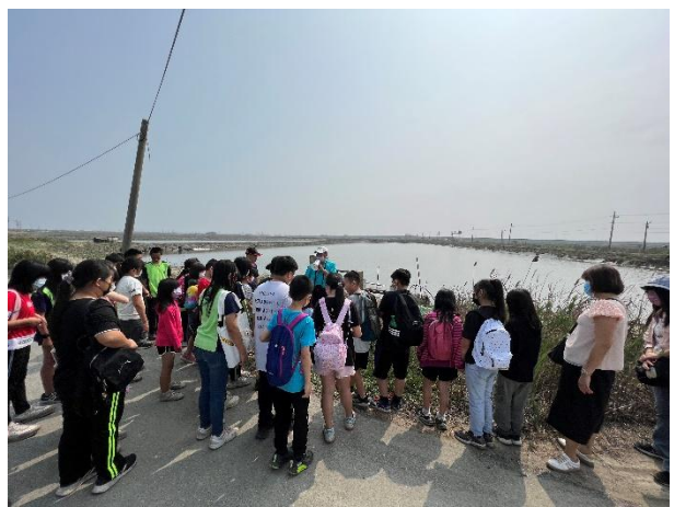
活動說明：海洋教育-漁塭養殖