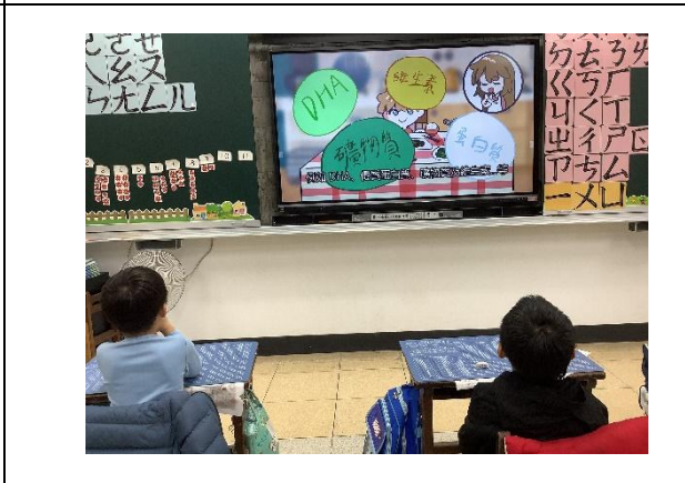
活動說明：餐前五分鐘