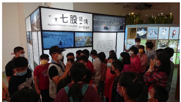
活動說明：環境教育-七股鹽山