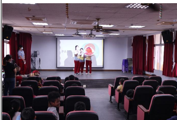
活動說明：指導學生貝式刷牙