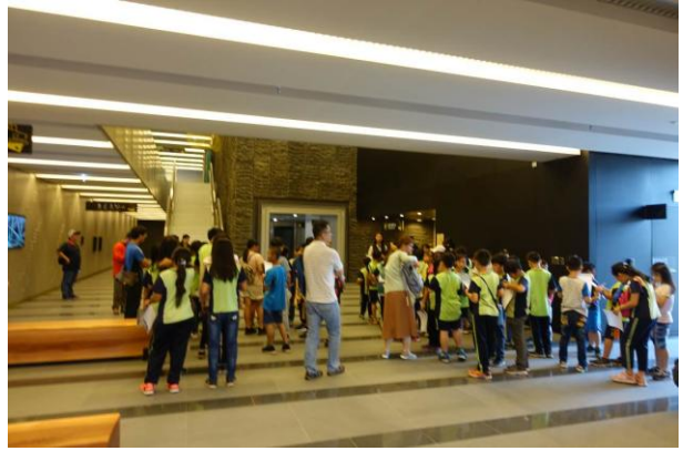
活動說明：參訪臺南市仁德水資源回收中心