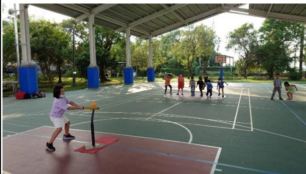
活動說明：指導學生樂樂棒球