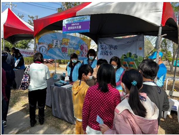
活動說明：參與水利署節水活動