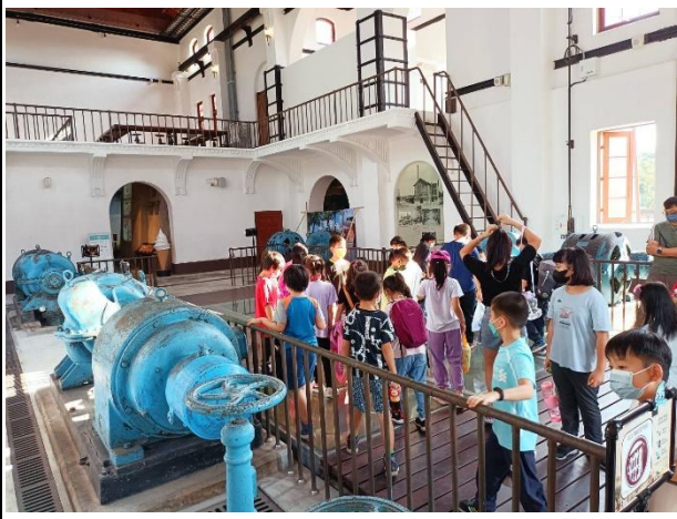
活動說明：環境教育-水道博物館