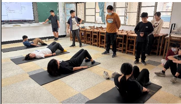
活動說明：指導學生體能訓練