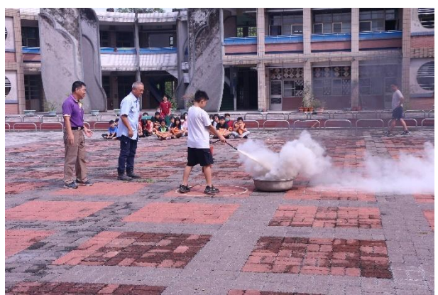
活動說明：消防演練