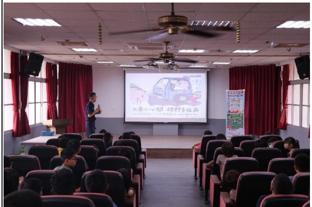
活動說明：交通安全宣導