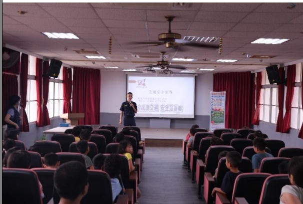
活動說明：交通安全宣導