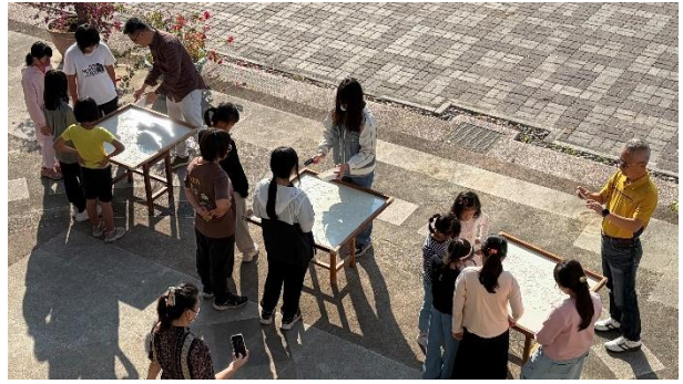
活動說明：校長指導學生刮藕粉