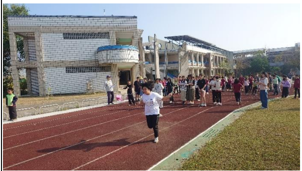
活動說明：指導學生跳繩接力