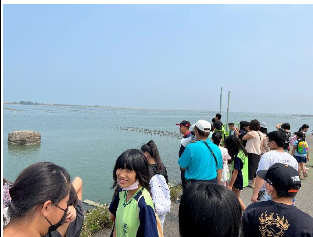
活動說明：海洋教育-漁塭養殖