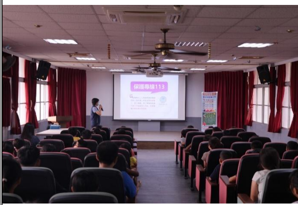
活動說明：婦幼安全宣導