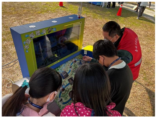
活動說明：認識水從哪裡來