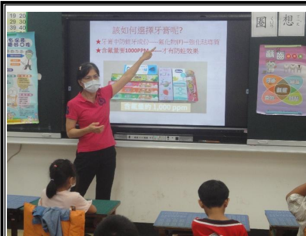
活動說明：護理師入班進行口腔保健宣導