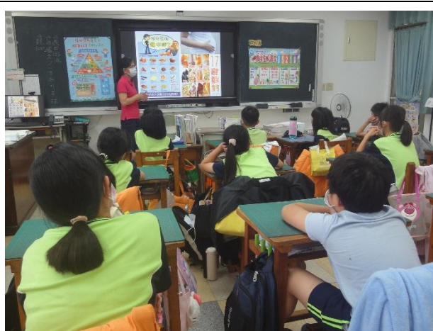
活動說明：護理師入班進行健康體位宣導