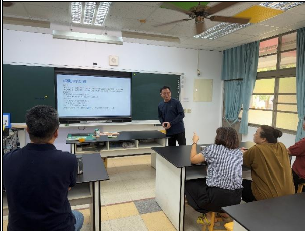
活動說明：教職員在校實踐健康行為 -籌組超慢跑運動社群