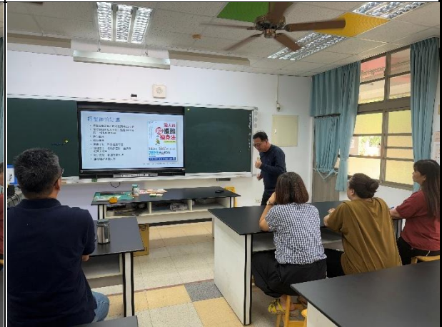
活動說明：教職員在校實踐健康行為 -籌組超慢跑運動社群