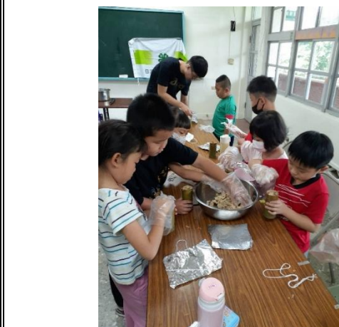
活動說明：學校老師利用夏日樂學帶領學生做竹筒飯