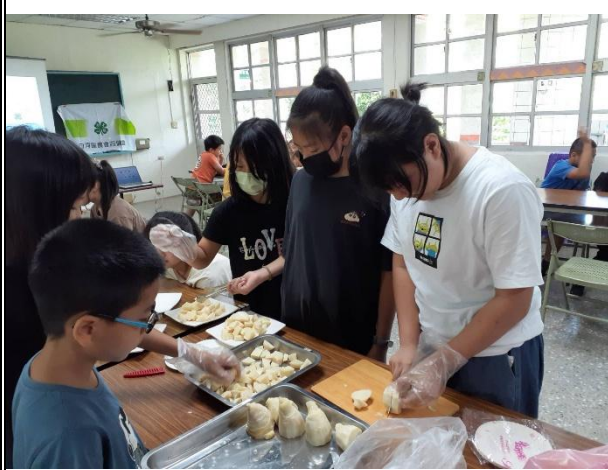
活動說明：品嚐現挖的竹筍