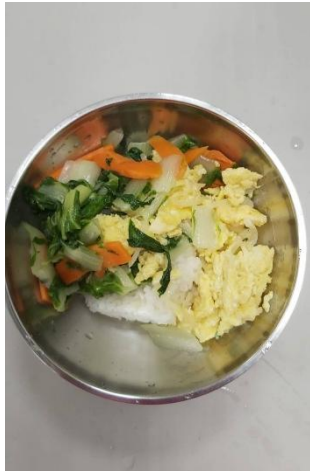
活動說明：教職員午餐多攝取青菜