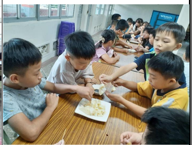
活動說明：品嚐現挖的竹筍