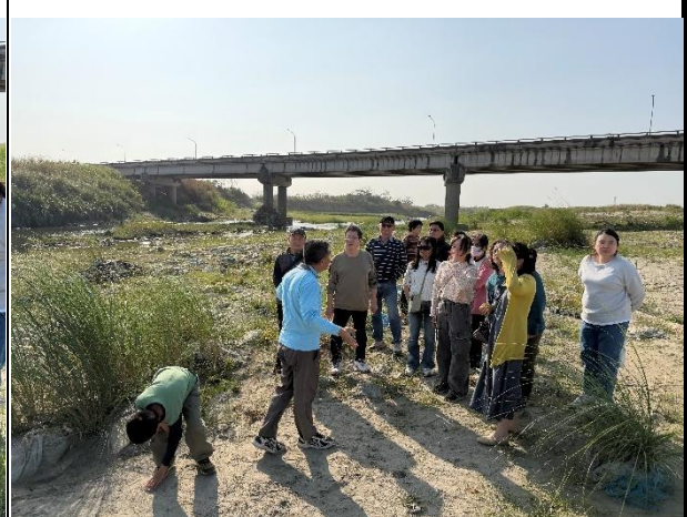
活動說明：學校老師利用週三下午組 隊沿溪邊檢拾垃圾