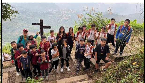
活動說明：學校老師帶領學生爬雞籠山