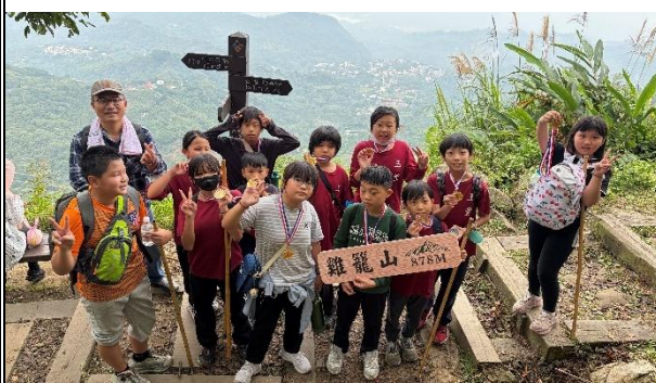
活動說明：學校老師帶領學生爬雞籠山