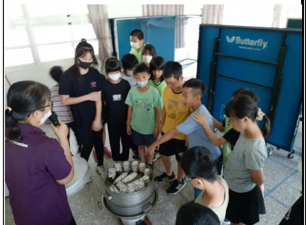
活動說明：學校老師利用夏日樂學帶領學生做竹筒飯