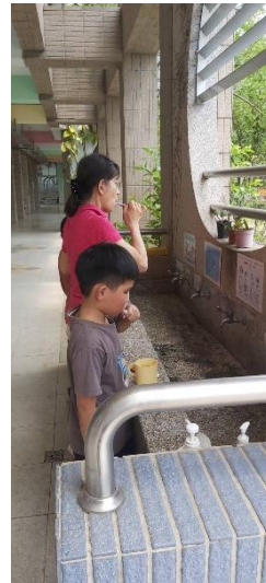
活動說明：教職員在校實踐健康行為 -示範刷牙