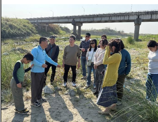
活動說明：學校老師利用週三下午組 隊沿溪邊檢拾垃圾