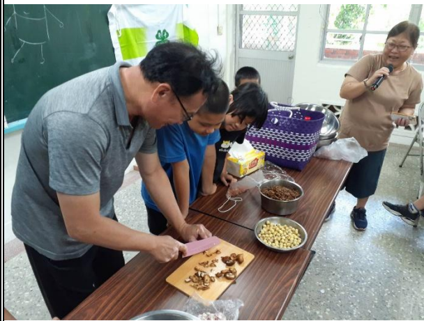
活動說明：學校老師利用夏日樂學帶領學生做竹筒飯