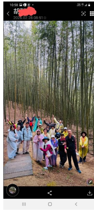
活動說明：教職員籌組台灣探險隊，於假日進行登山活動