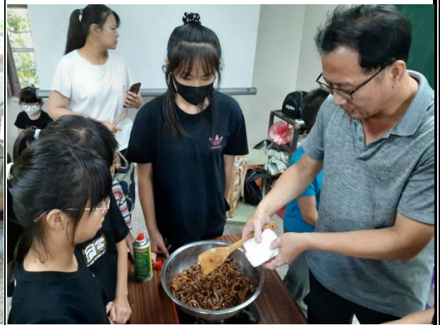
活動說明：學校老師利用夏日樂學帶領學生做竹筒飯