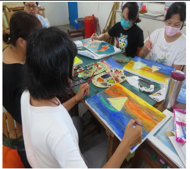
說明：校長與同仁積極參與社區健康促進活動—美術老師指導油畫創作