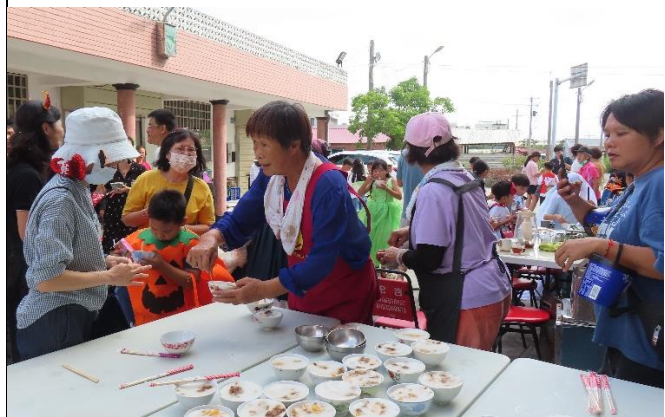
說明:校內同仁積極參與社區健康促進相關活動—好吃的碗粿出爐啦。