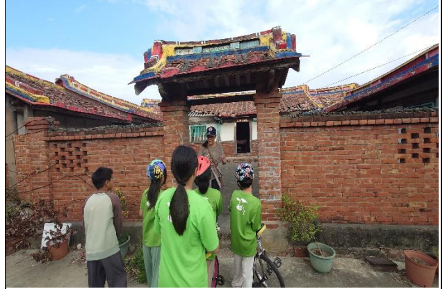
說明：校內同仁積極參與社區健康促進相關活動—老師與學童社區踏查-拜訪社區古蹟