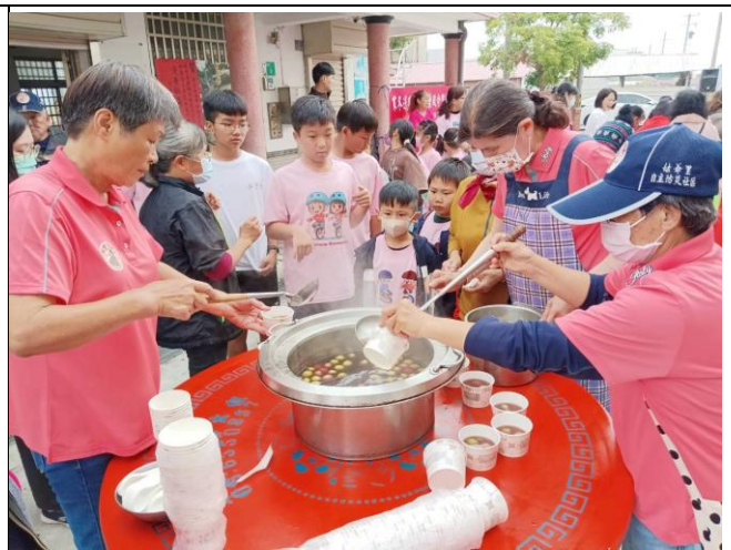
說明：校內師生積極參與社區健康促進相關活動—搓湯圓。