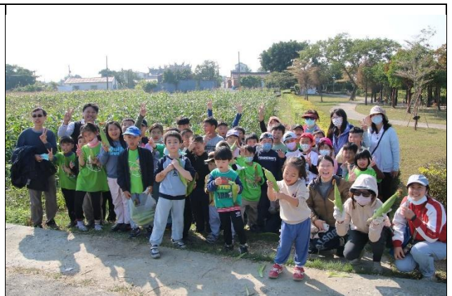
說明：校內師生積極參與社區健康促進目關活動—玉米採收。