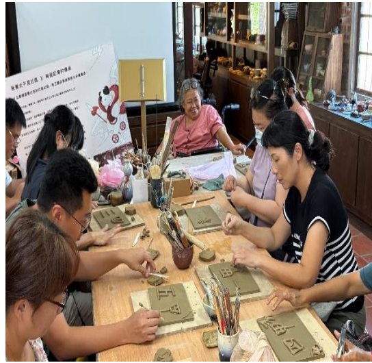
說明:校內同仁積極參與社區健康促進相關活動—陶藝紓壓。