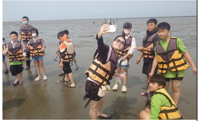
說明：校內同仁積極參與社區健康促進相關活動—外傘頂洲生態遊船之旅。