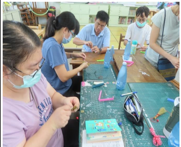
說明：校內同仁積極參與社區健康促進相關活動—心靈療癒貴黍掃帚創作