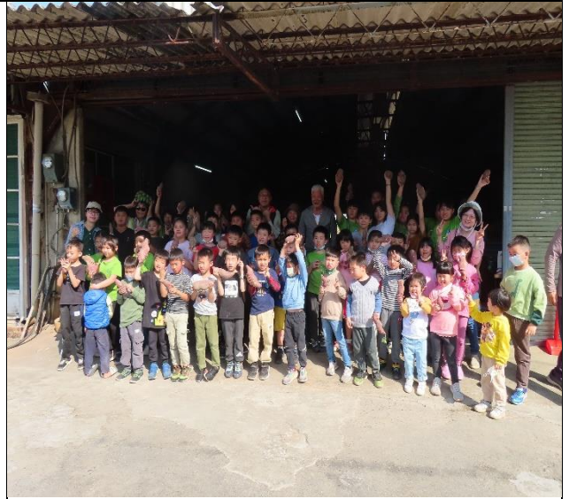
說明：校內師生積極參與社區健康促進相關活動—地瓜採收。