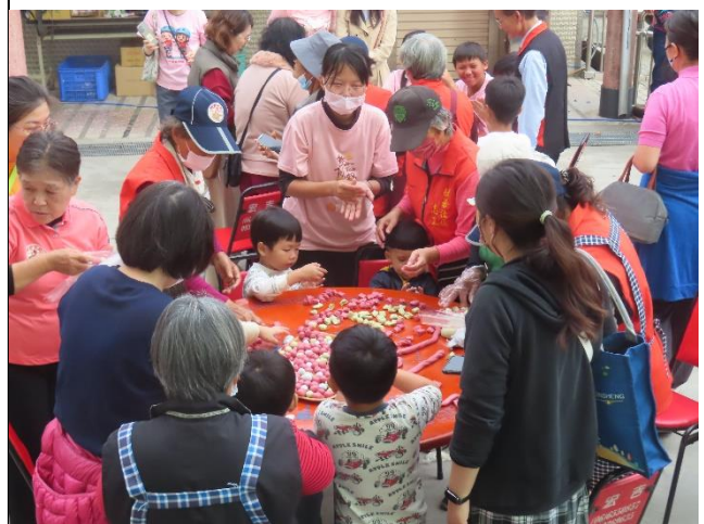
說明：校內師生積極參與社區健康促進相關活動—搓湯圓。