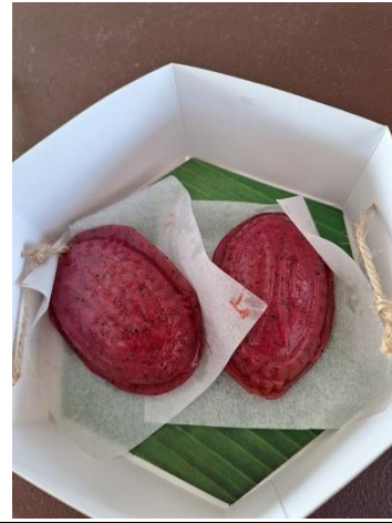
說明:校內同仁積極參與社區健康促進相關活動—好吃的紅龜粿出爐啦。