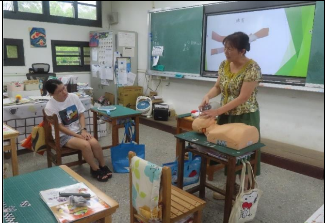
說明:校內同仁積極參與社區健康促進相關活動—急救研習。