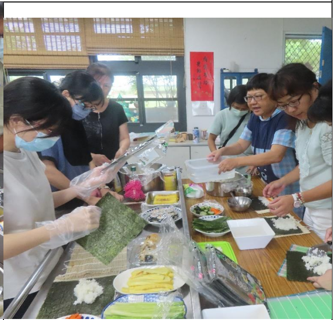
說明:校內同仁積極參與社區健康促進相關活動—健康飲食米食製作。