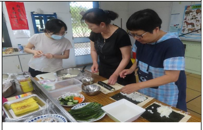
說明:校內同仁積極參與社區健康促進相關活動—健康飲食米食製作。