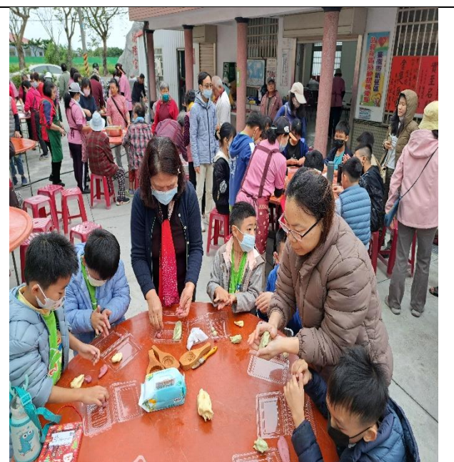
說明:校內同仁積極參與社區健康促進相關活動—元宵節搓地瓜與紅薯湯圓。