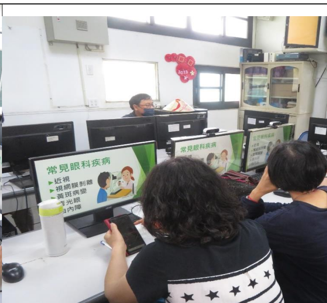
說明:校長帶領教職員工生積極參與社區健康促進相關活動—視力保健探索。