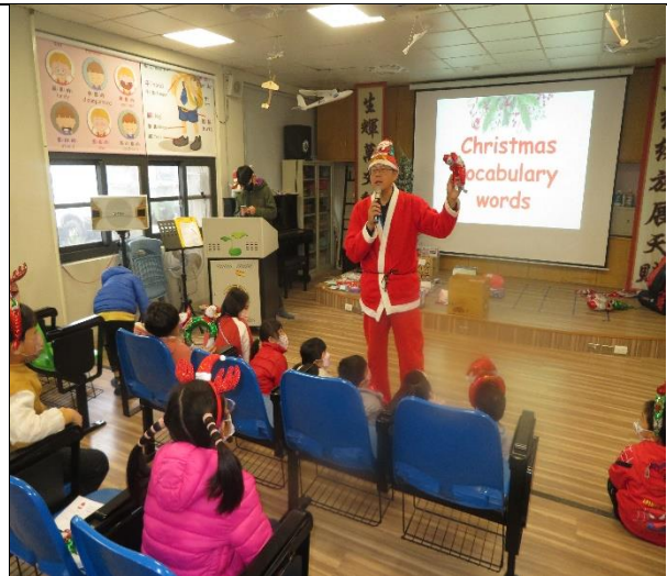
說明:校內同仁積極參與社區健康促進相關活動—聖誕節交換禮物交換心情。