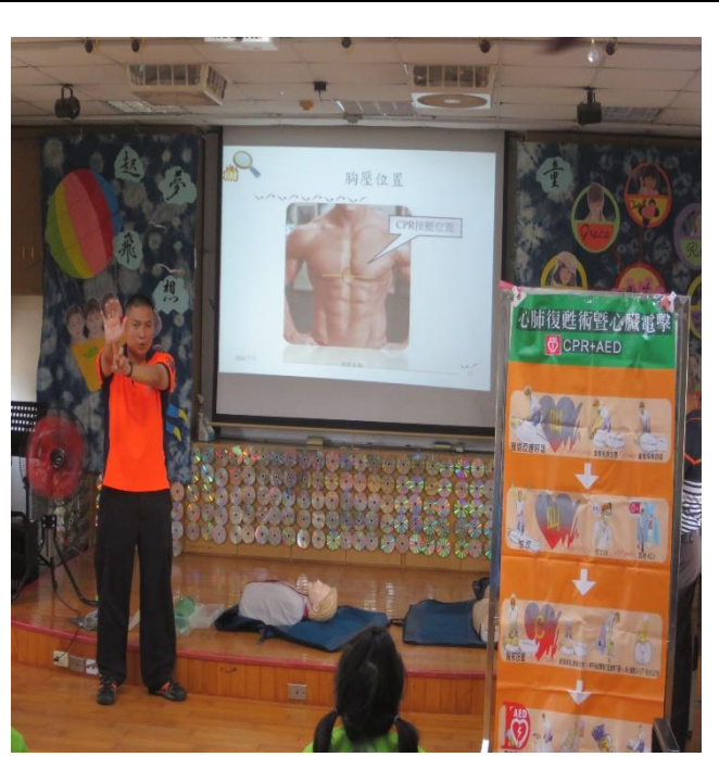
說明:校內同仁積極參與社區健康康促進相關活動—如何自救救人。