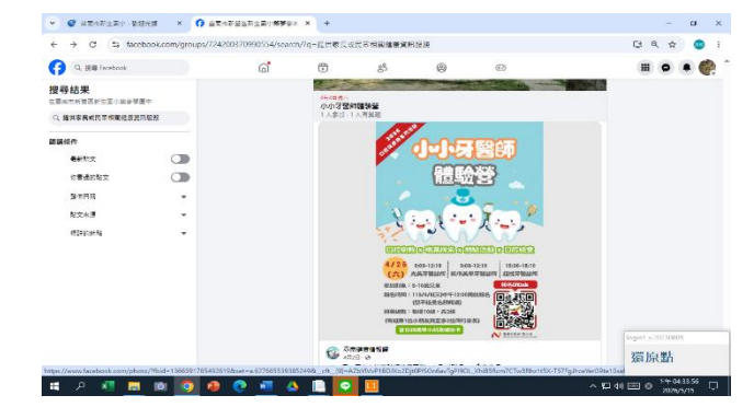
說明: fb 社群小小牙醫營體驗