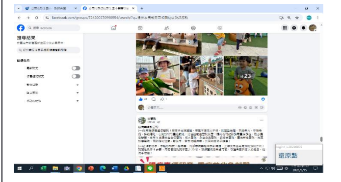
說明: fb 社群登革熱、腸病毒宣導