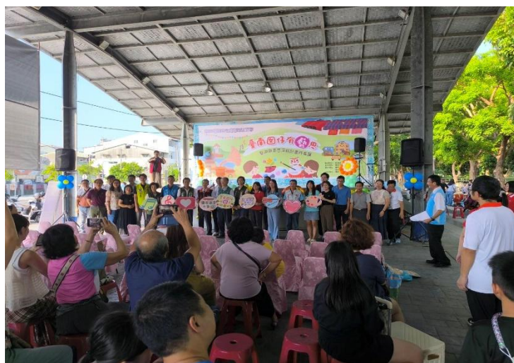
說明：台南團子藝術思藝活動