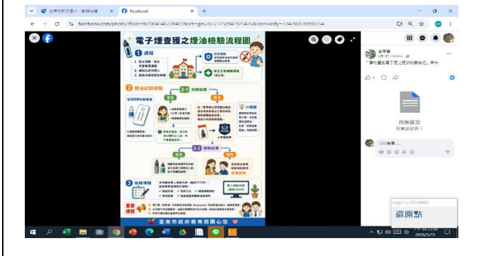
說明: fb 社群分享電子菸危害宣導