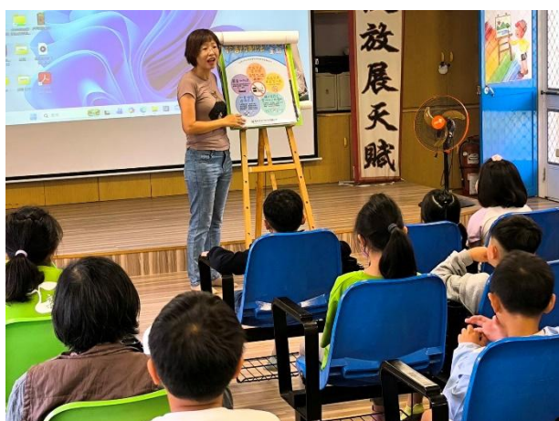
說明：衛生所入校進行親子菸害防制宣導