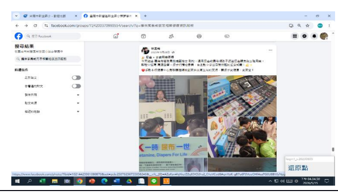
說明: fb 社群反毒教育宣導