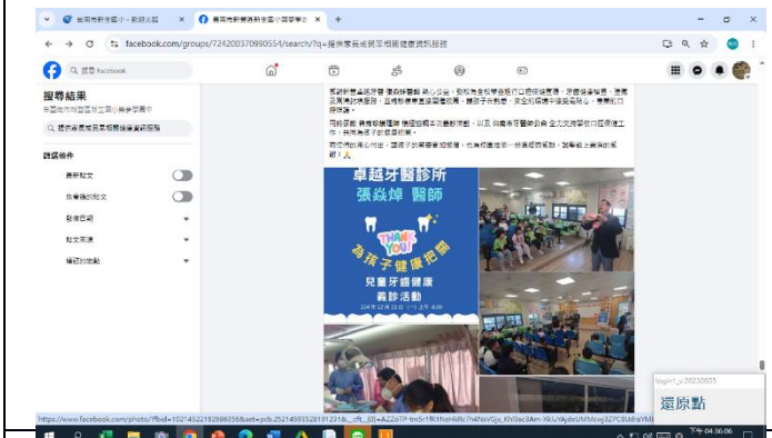
說明: fb 社群牙醫診所入校服務宣導