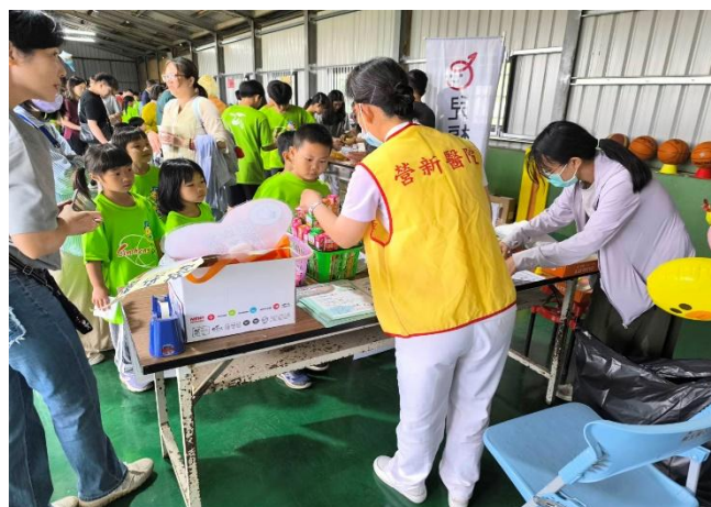
說明：提供社區親子健康慢性病照護等資訊與醫療服務