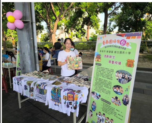
說明：社區藝術深根校園活動宣導