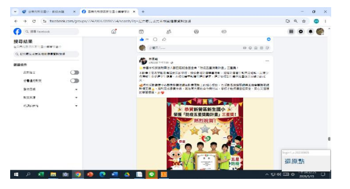
說明: fb 社群傳染病宣導