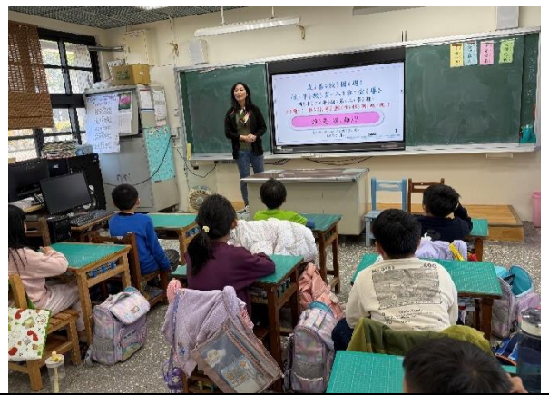
二甲：性別尊重(含性別歧視)