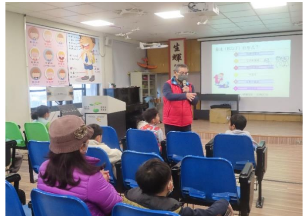
友愛同學，尊重包容-臺南校園反霸凌