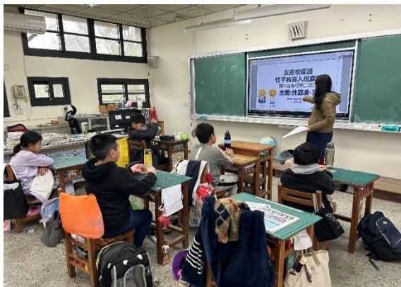
五甲：性霸凌-關係篇