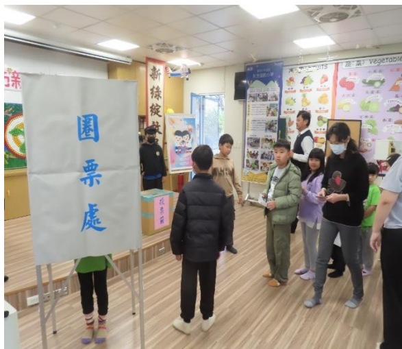
全校模範兒童選舉