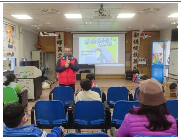
保護自己，尊重別人，共同建構友善校園