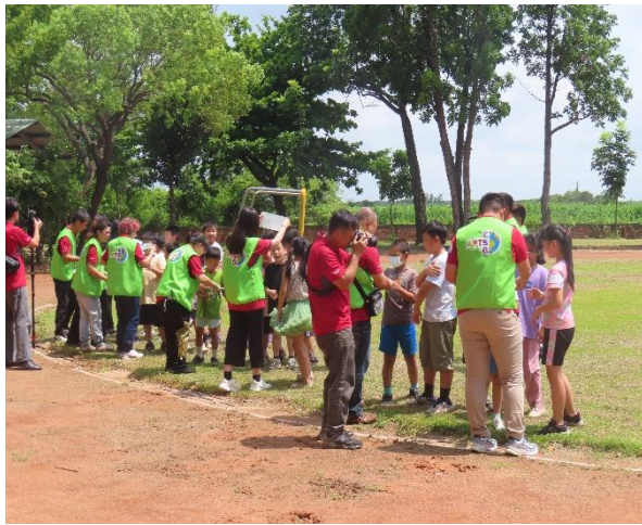
台積電入校公益科普活動