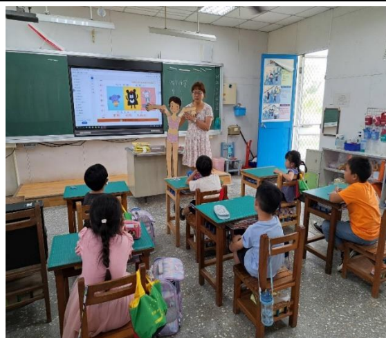
性別平等教育宣導