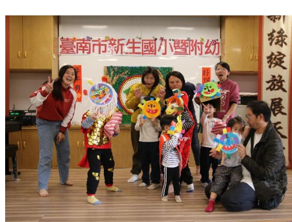
幼兒園年獸大王—誰最可怕(愛)?