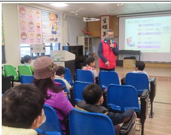
拒絕校園霸凌從你我做起