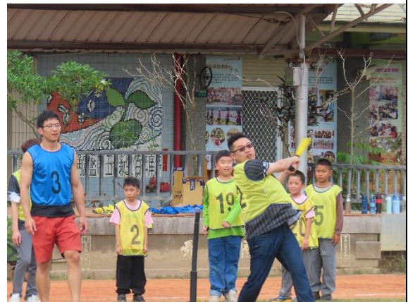
大人小孩一起打樂樂棒球