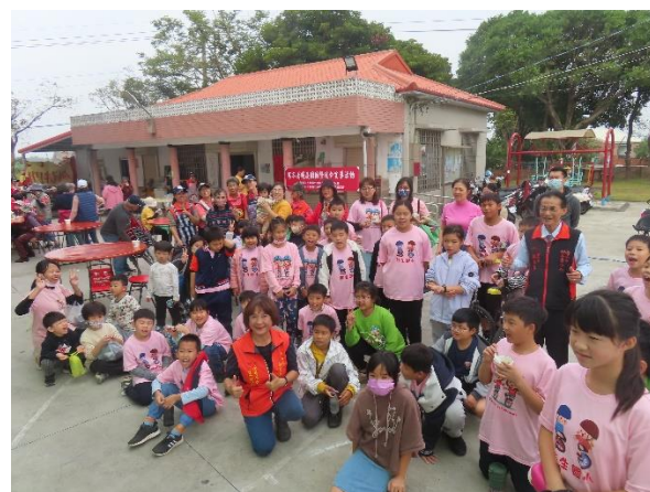
社區邀請全校師生一起搓湯圓