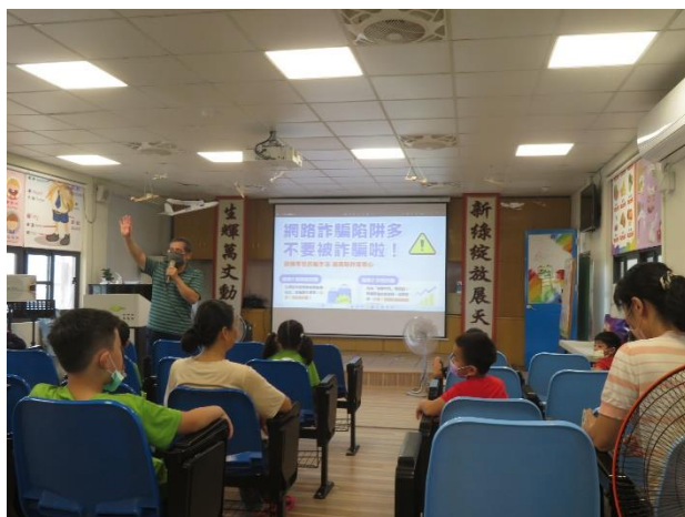
如何應對網路霸凌