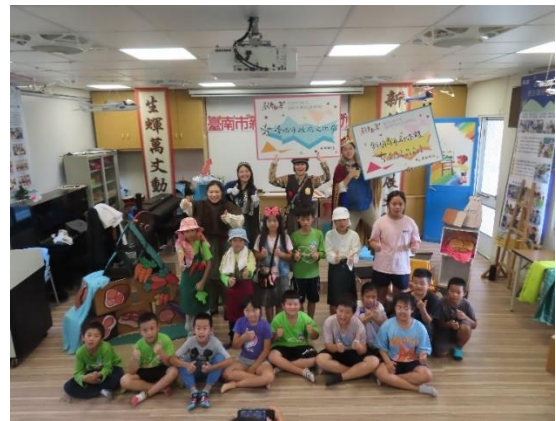
劇育新芽偏鄉學校公益表演活動