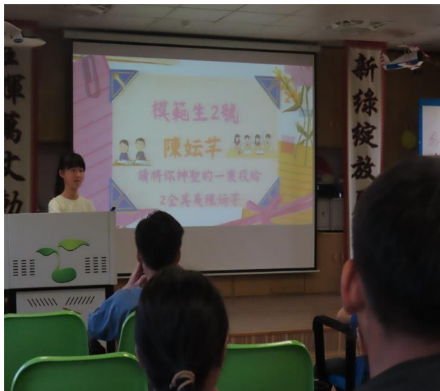
全校模範兒童自我推薦發表