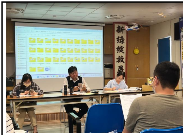
圖說 1：於期初校務會議進行宣講