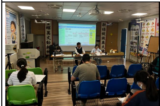
圖說 2：報告入班宣導期程