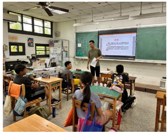
二甲：認識性別刻板印象