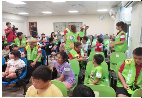
台積電入校公益科普活動