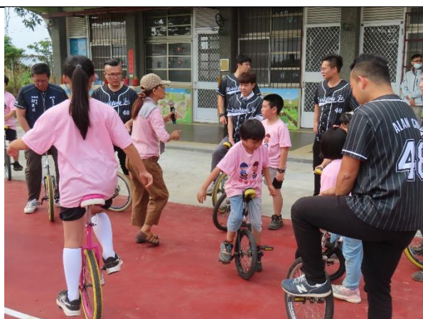
大人小孩一起騎獨輪車