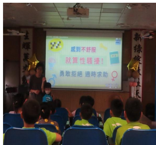
保障性別平等再升級-跟蹤騷擾防制法