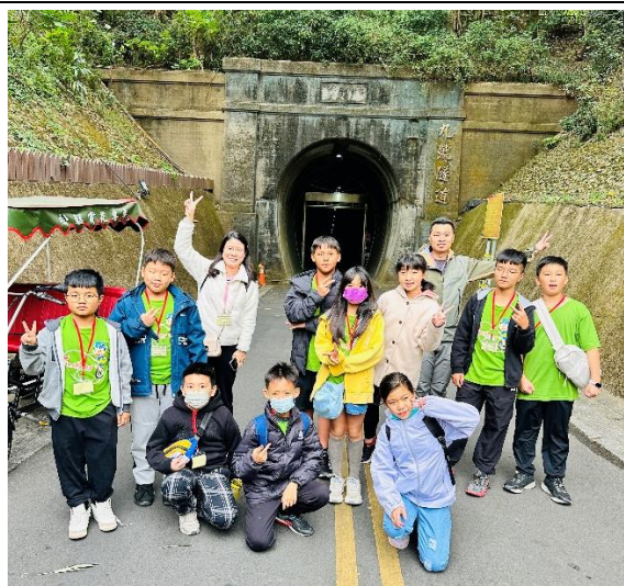
五六年級聯合畢旅，留下快樂的回憶。