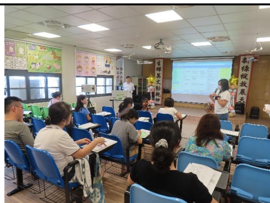
圖說 2 報告入班宣導期程