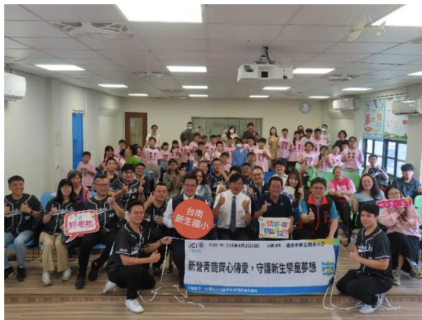
新營青商會與學生歡慶兒童節