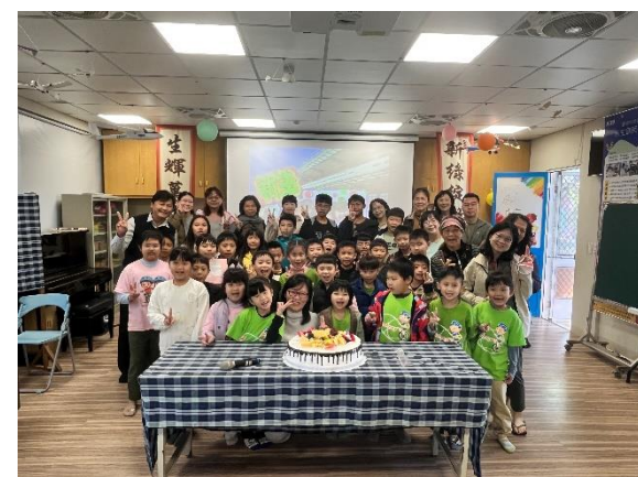
歡送英語代課教師