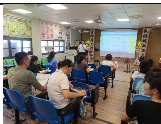
圖說 3 案例解說