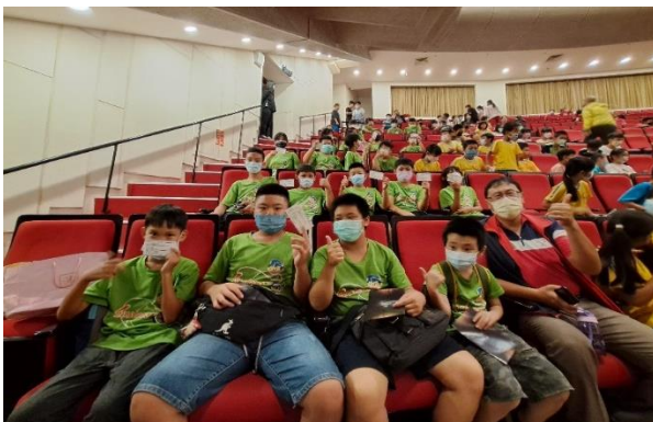
台南文化中心舞鈴劇長公益活動