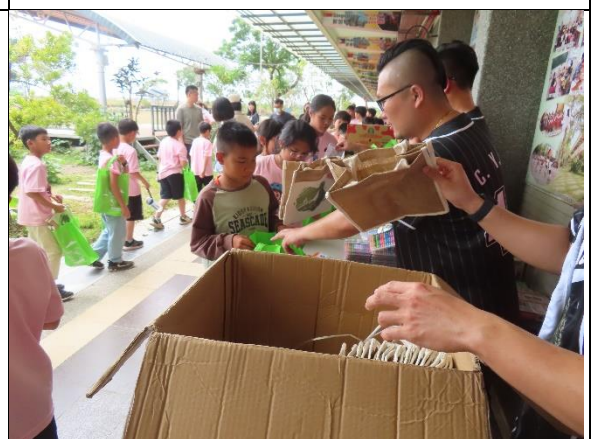
有吃有玩又有禮物，快樂兒童節