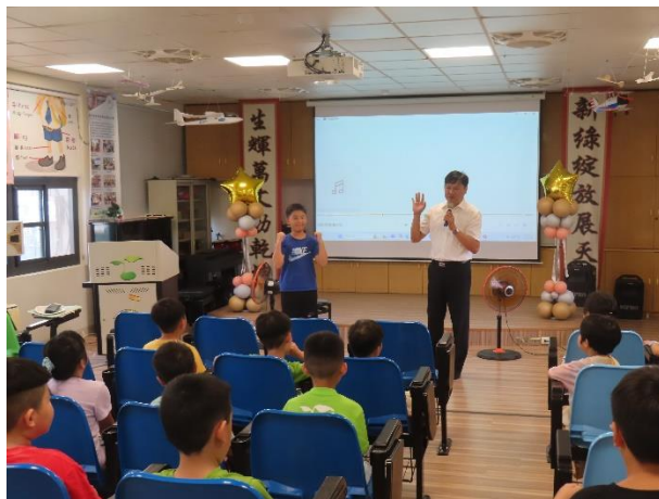
友善校園宣導--反霸凌宣誓