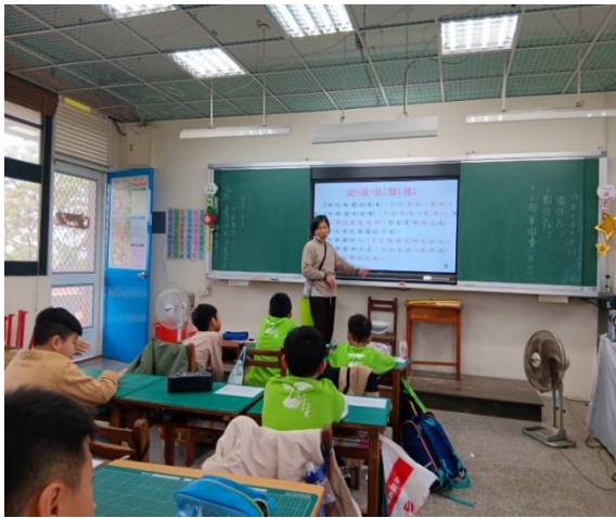
三甲：性騷擾-遊戲篇