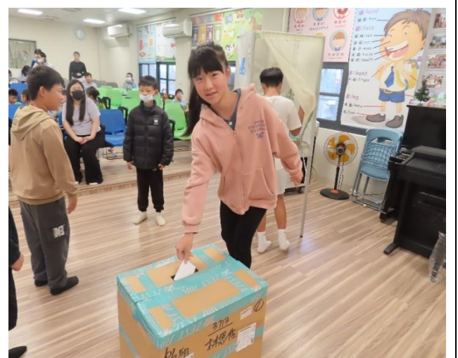
全校模範兒童選舉