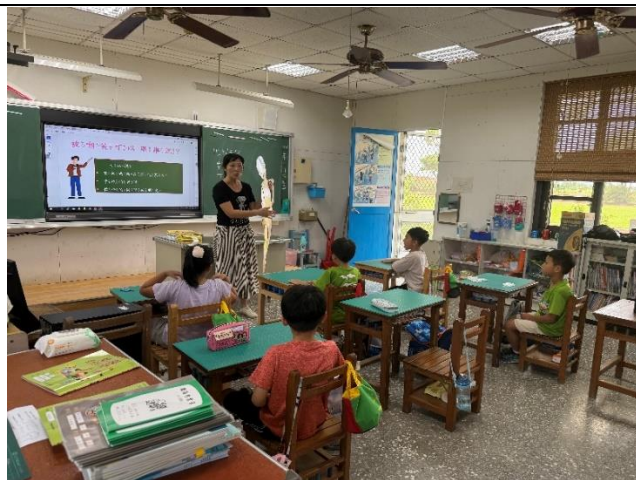
二甲：性騷擾-肢體篇