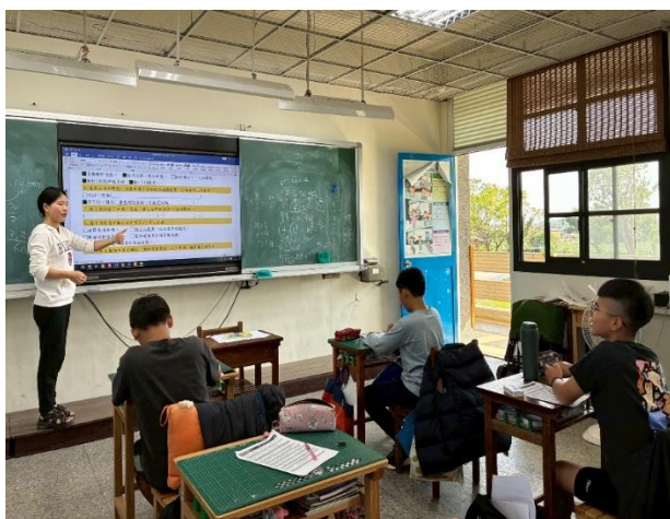
防制數位性別暴力犯罪