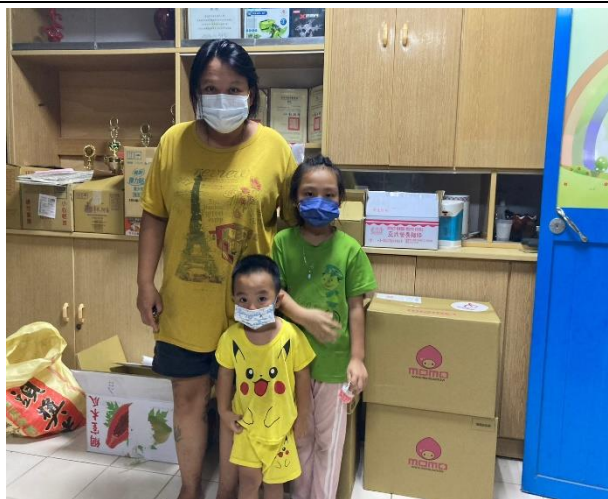
兒福聯盟日常生活物資捐助