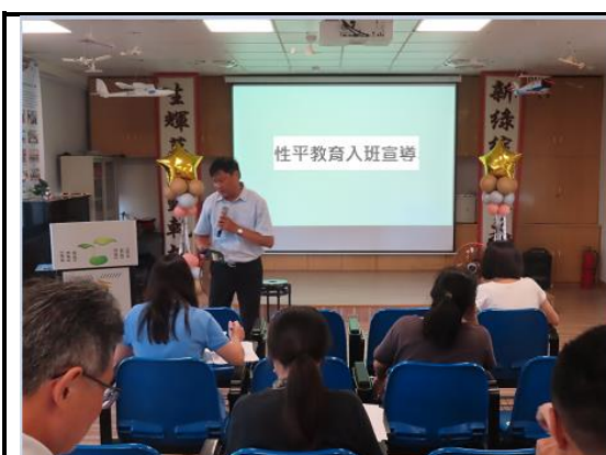
圖說 1 於期初校務會議進行宣講