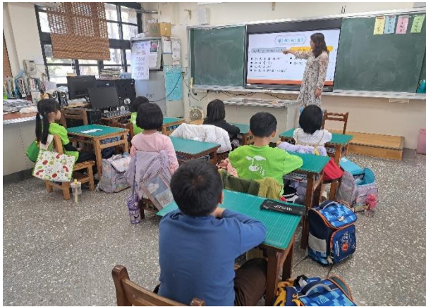
一甲：身體自主權-認識身體界線