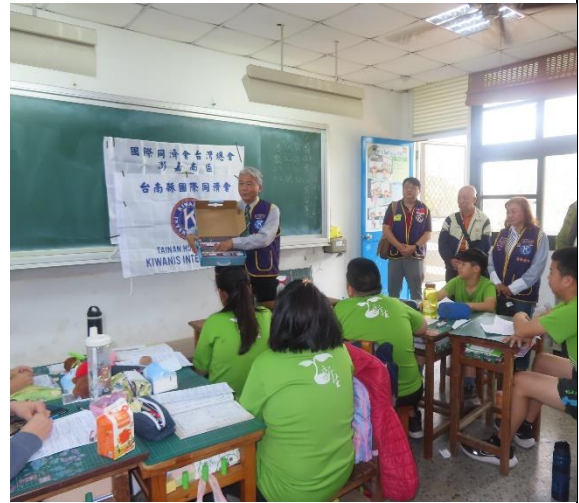
臺灣同濟總會兒童基金會寒冬送暖活動