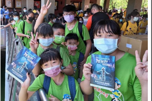
台南文化中心舞鈴劇長公益活動