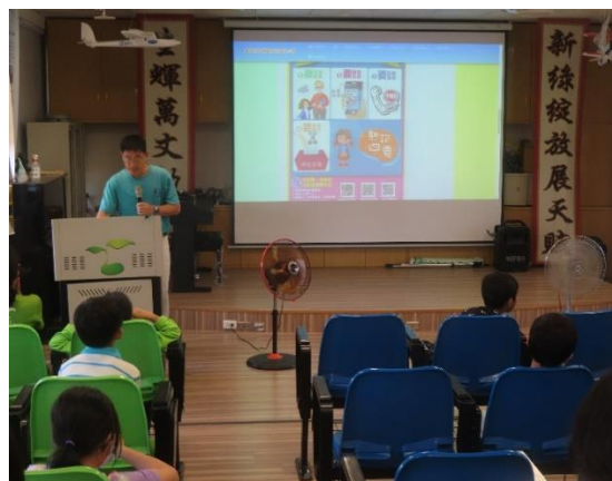
防制數位性別暴力