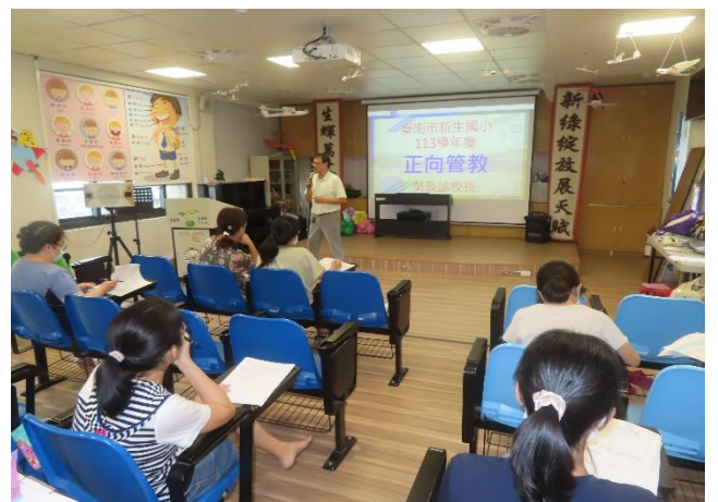
陪你勇敢，不再旁觀-反霸凌