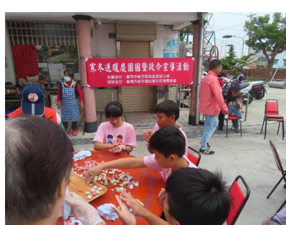
社區邀請全校師生一起搓湯圓