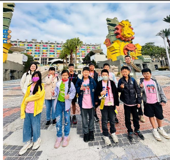
五六年級聯合畢旅，留下快樂的回憶。