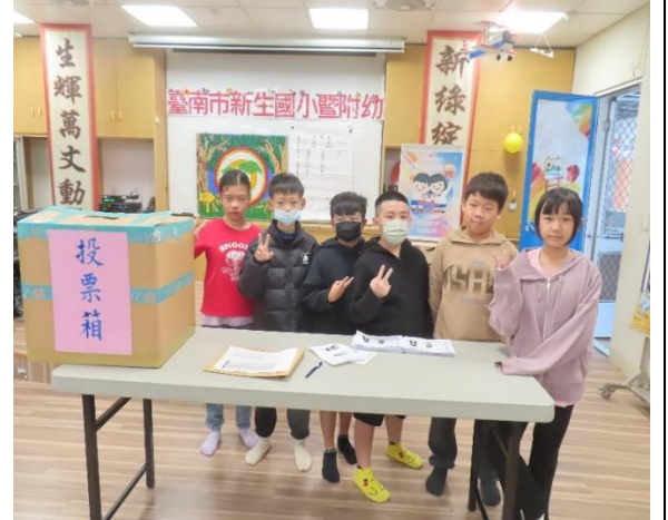
全校模範兒童選舉開票