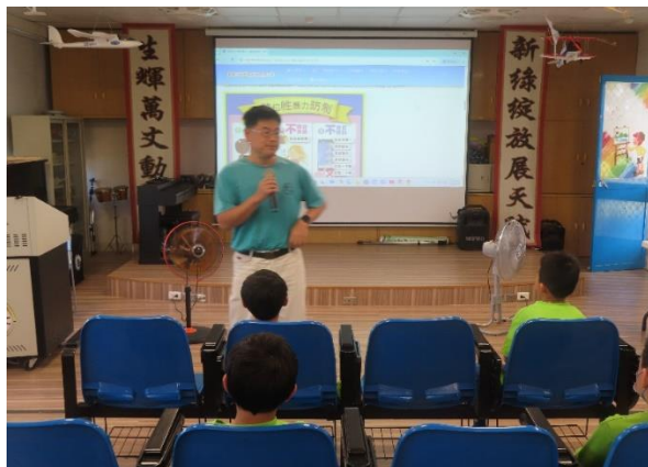
消除歧視, 性別平等