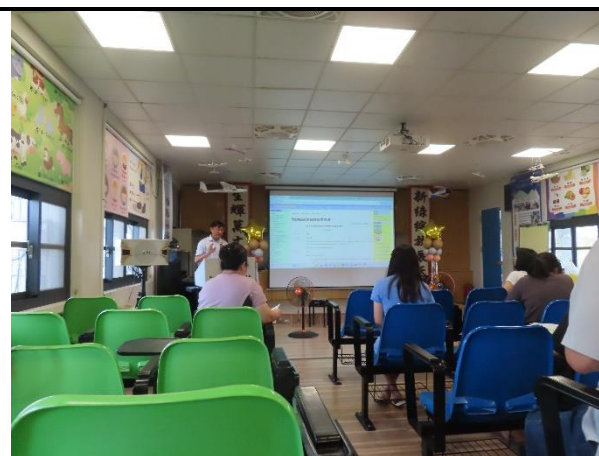
圖說 4 校長結語