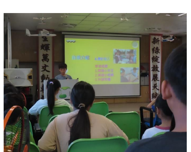
全校模範兒童自我推薦發表