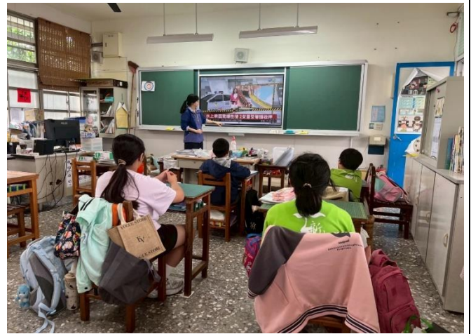
四甲：性侵害-陌生人篇