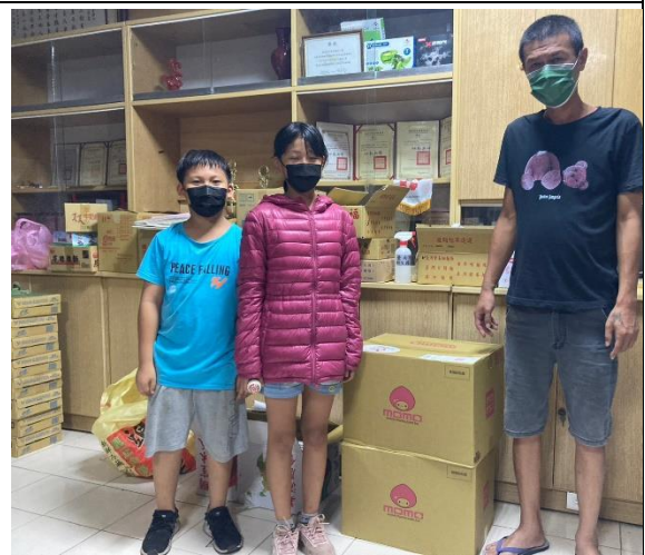
兒福聯盟日常生活物資捐助