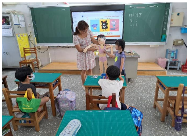
性別平等教育宣導