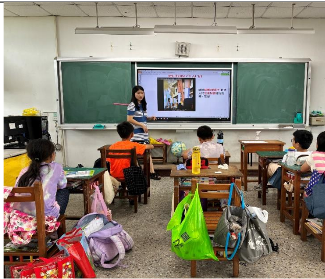
四甲：性騷擾-語言篇