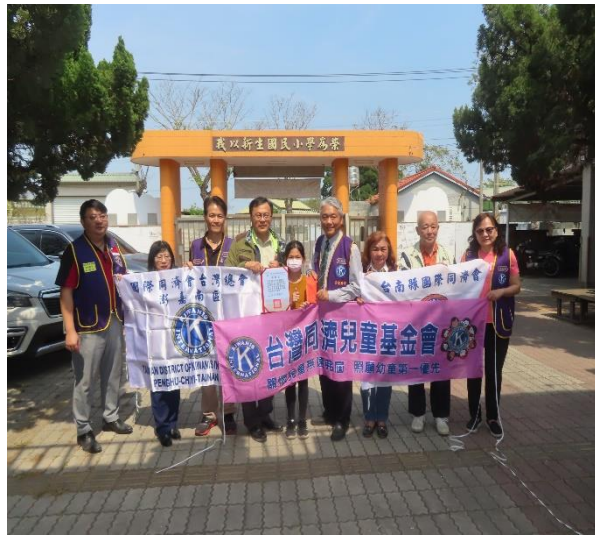
臺灣同濟兒童基金會寒冬送暖活動