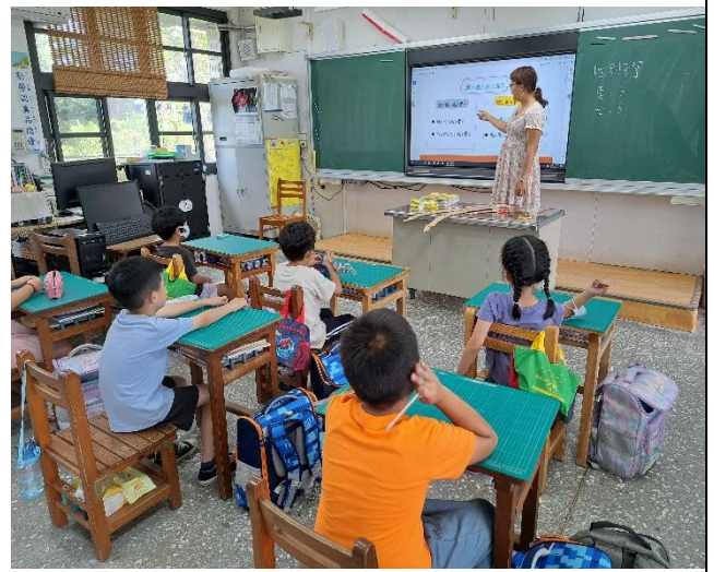
一甲：性侵害-熟人篇