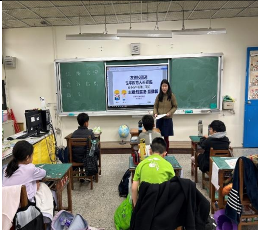
一甲：身體自主權-表達感受