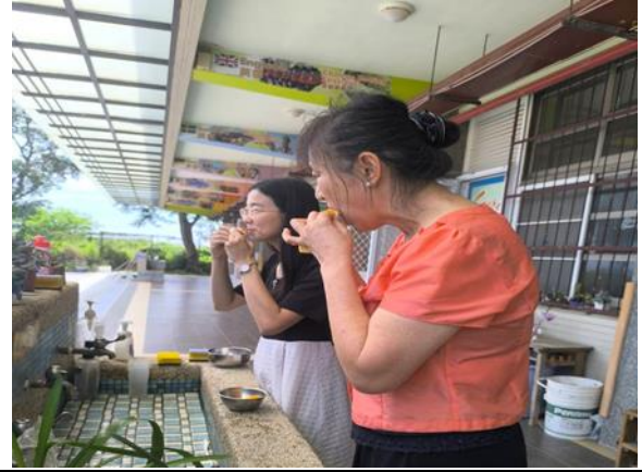
說明:教職員在校實踐健康行為，以作為學生養成健康行為的學習楷模—多吃蔬果。