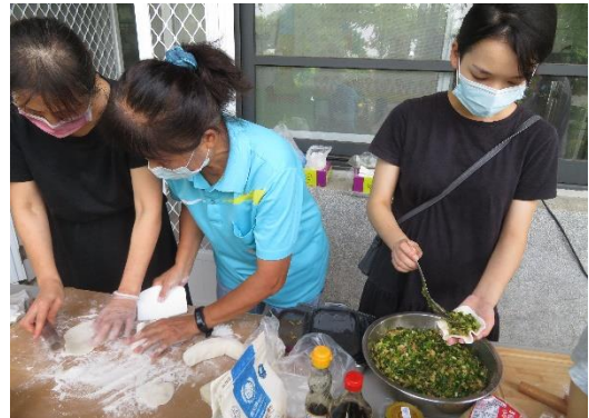
說明:教職員在校實踐健康行為，以作為學生養成健康行為的學習楷模—動手做蔬果均衡飲食食材。