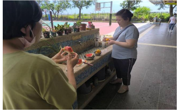
說明:教職員在校實踐健康行為，以作為學生養成健康行為的學習楷模—多吃蔬果。