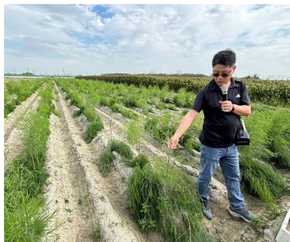
圖片說明：介紹農場的作物和其他作物(蘆筍)，讓學生了解農場的運作模式和永續農業的概念。