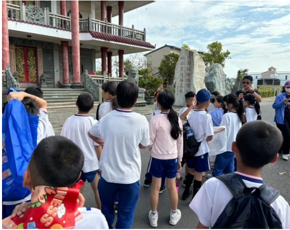
圖片說明：走讀將軍區，行走學習力・健康向前行