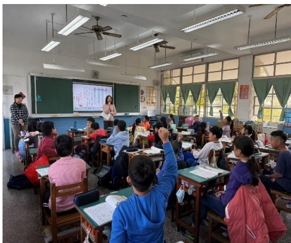
圖片說明：紅蘿蔔身世大解謎激發學生學習的好奇心