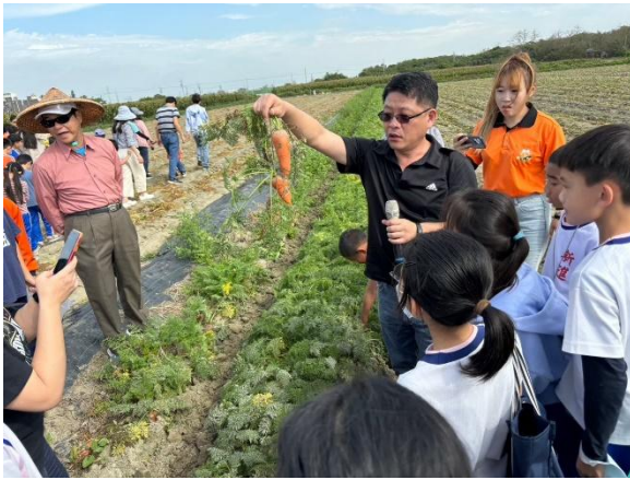
圖片說明：指導學生如何正確地施力拔起紅蘿蔔