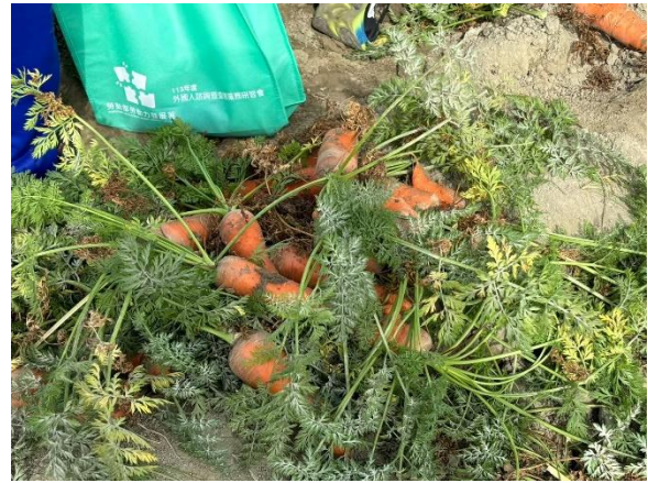
圖片說明：將軍鄉的紅寶石