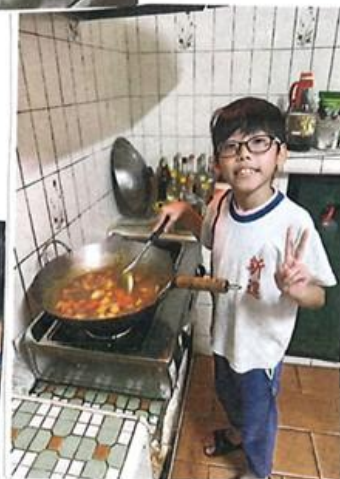
請貼上料理照片或畫下你的獨門料理