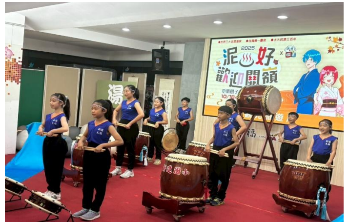
太鼓隊受邀關子嶺溫泉季記者會開場表演活動