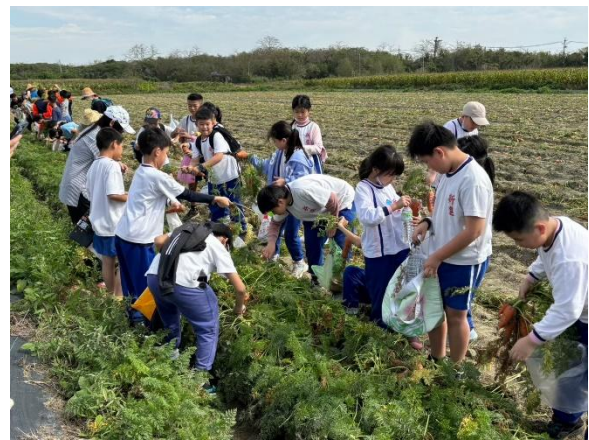
圖片說明：學生可以在指定區域內進行採摘，師長隨時巡視並指導學生。