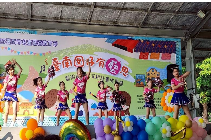
啦啦隊受邀參加臺南囡仔有藝思表演