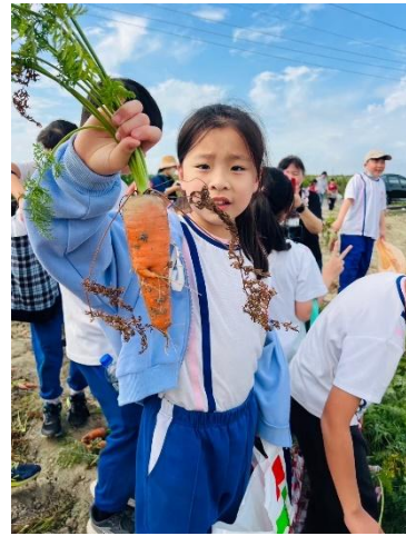
圖片說明：學生拔蘿蔔初體驗