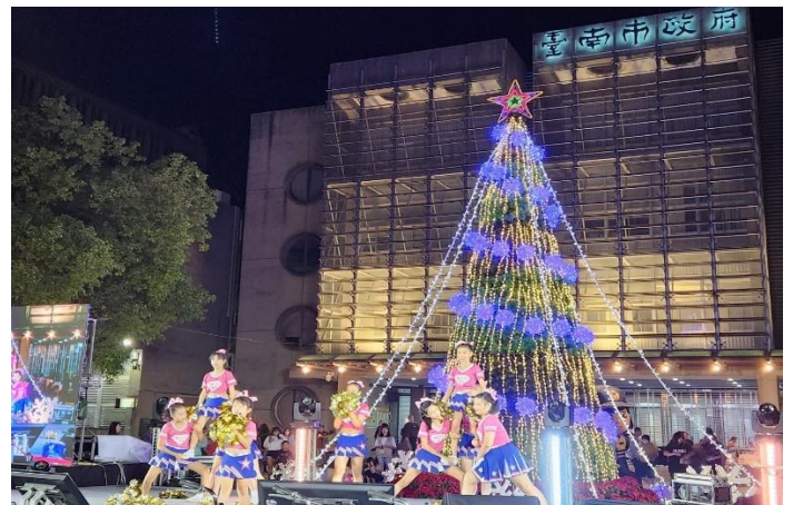
啦啦隊受邀參加社區耶誕表演活動