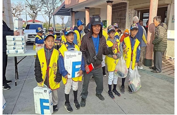
新進國小棒球隊每年都會協助天鳳宮發送弱勢物資活動