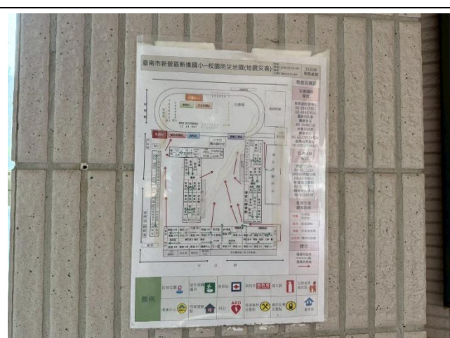
本校防災地圖，貼在樓梯間醒目處