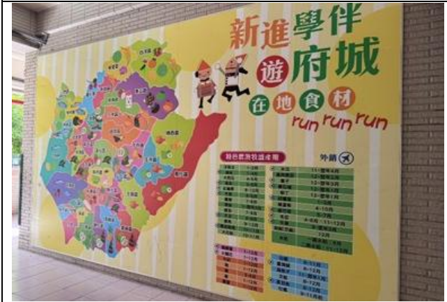
新進學伴遊府城帶學生認識台南市各區的在地食材及產季