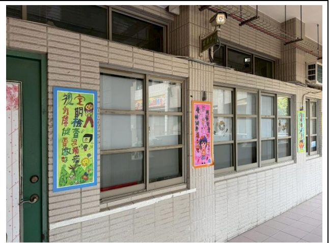
走廊外設置各類標語，深化情境營造