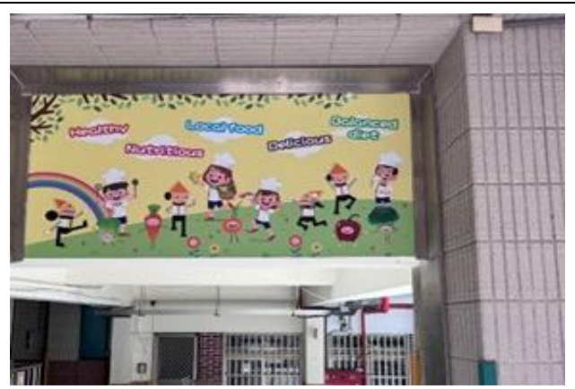
午餐廚房外會看到帶廚師帽的可愛營養學伴和營養教育相關的英文單字