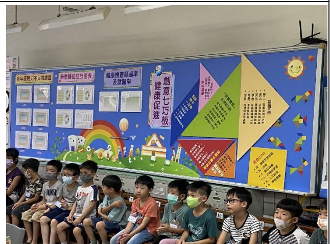
健康促進標語透過醒目的色彩，加深學生印象