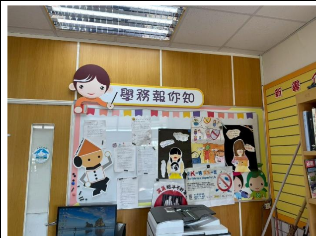
辦公室布告欄提供各項資訊及活動時程