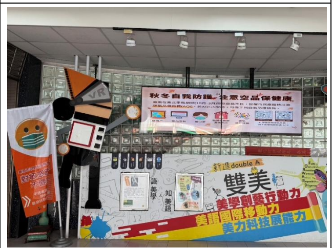
電子看板公告各項即時訊息