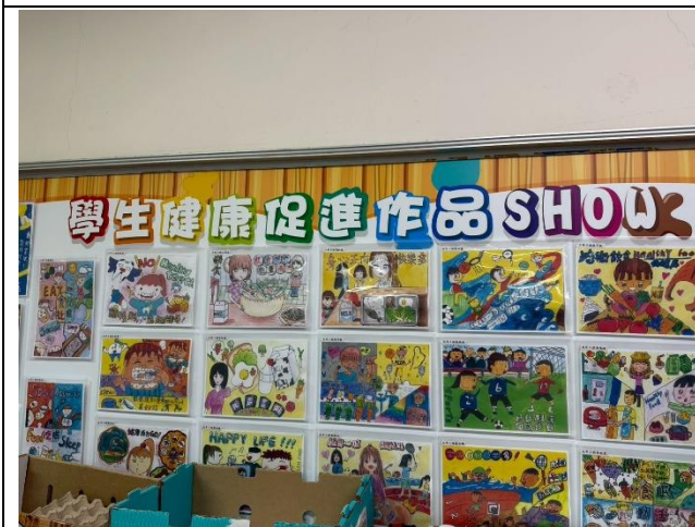
牆面布置學生健康促進作品