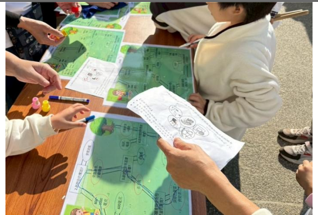
我的健康飲食桌遊教具，讓學生從遊戲中學習