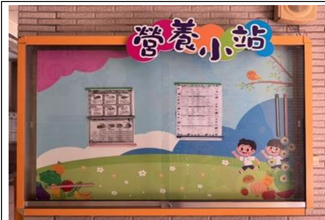
廚房外的營養小站櫥窗有張貼菜單及營養教育相關圖文