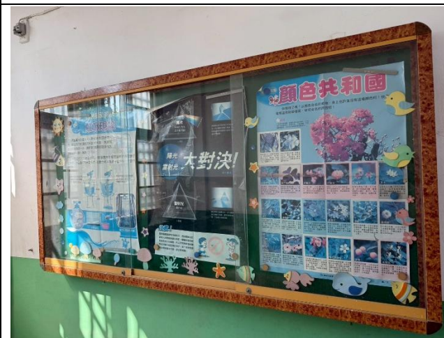
自然科學主題海報