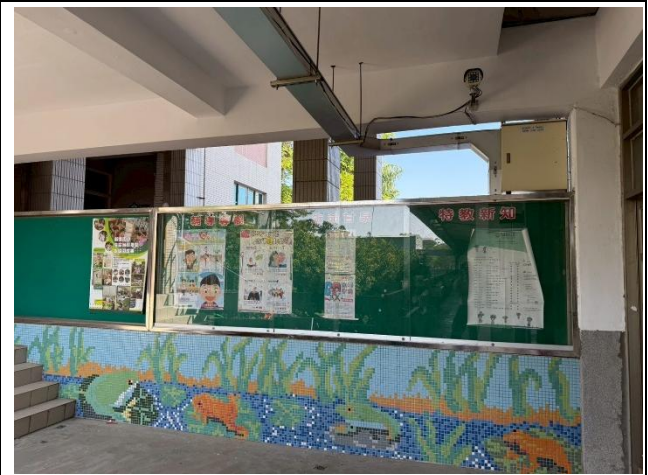
生命教育、特教專欄