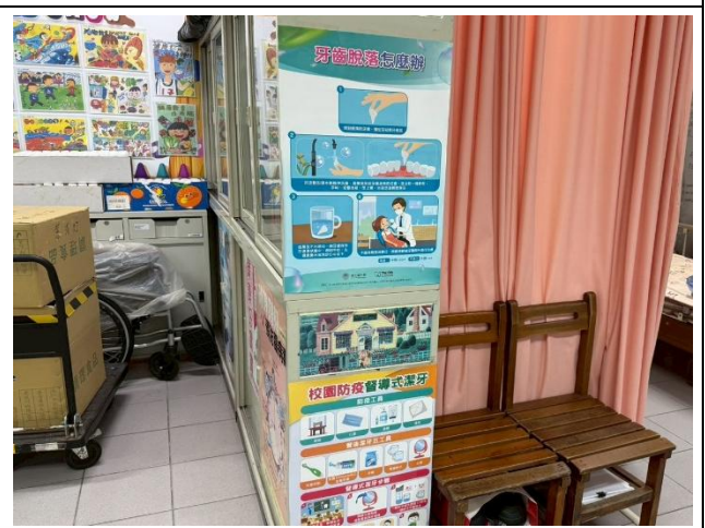
鐵櫃側面貼有潔牙相關海報