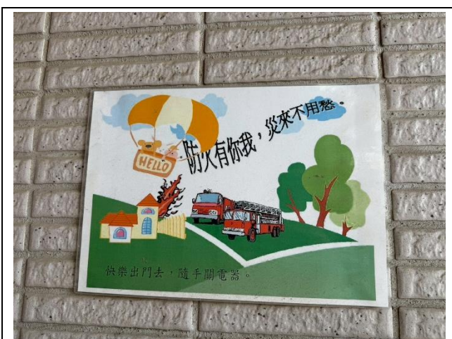
提醒學生注意家中用火、用電安全