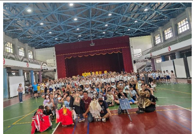
與表演團隊開心留影