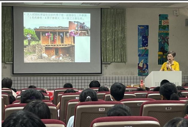
女性在經期遭遇的不公平對待