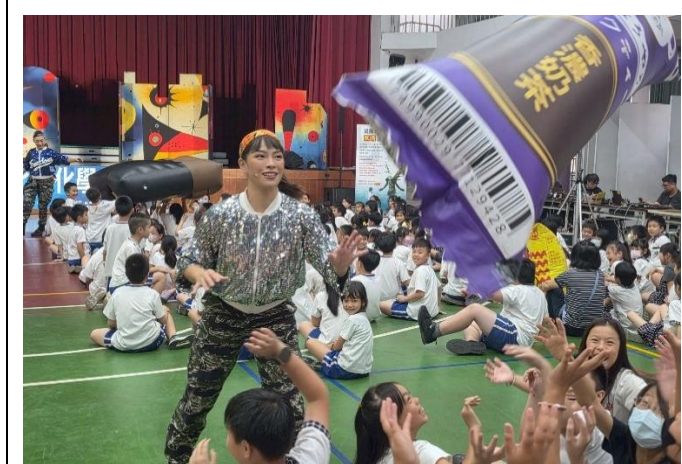
演員與學生互動，強化反毒意識