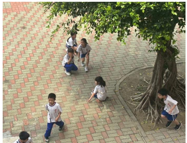
▲ 學生們在戶外活動中彼此分享、互相陪伴，透過遊戲與交流增進同儕情誼，展現友善合作與快樂學習的良好互動氛圍。