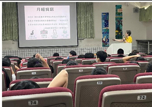
月經貧窮是需要被重視的議題