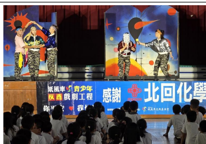
以生動戲劇揭開反毒宣導序幕，吸引學生專注聆聽