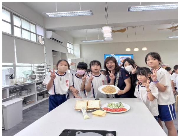
▲ 教師與學生在烹飪體驗活動中彼此合作指導，營造溫馨和諧的學習氛圍。