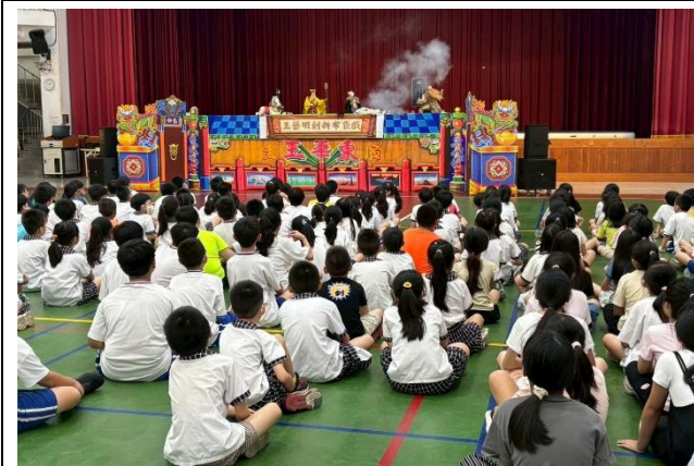
孫悟空順利打敗邪惡的妖怪