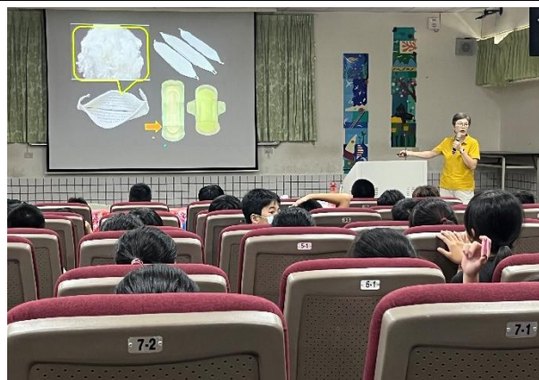
生理用品的發展史