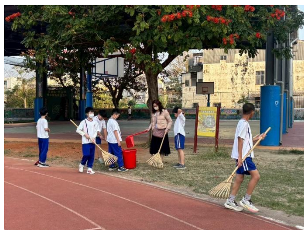
▲ 教師與學生共同參與跳繩運動與校園打掃活動，展現良好互動與合作精神。