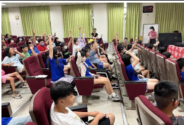
有獎徵答時學生踴躍舉手回答