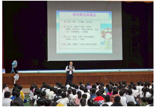
管制藥品及毒品的分類