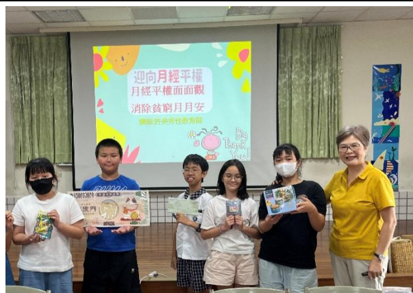
學生與講師開心留影