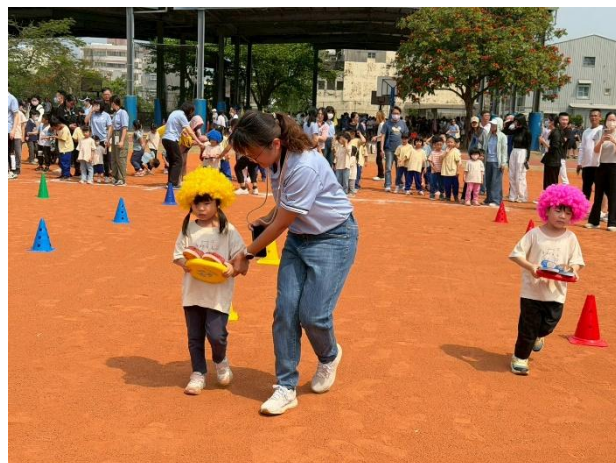
▲ 教師陪同學生參與競賽活動並進行引導，展現良好師生互動與學習氛圍