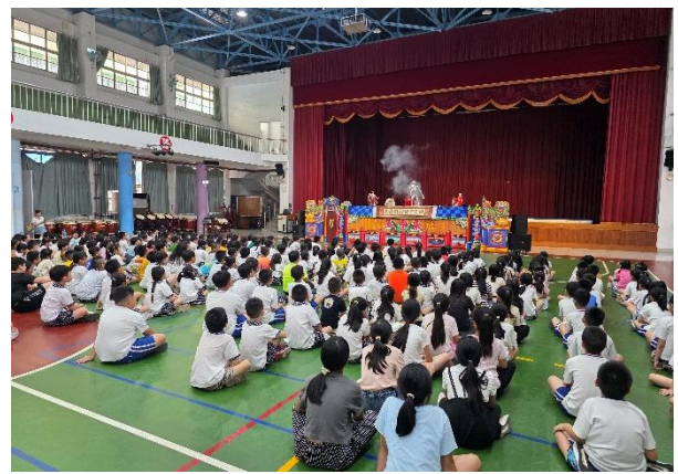
小朋友們認真觀賞表演