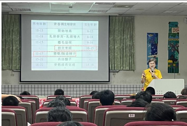
講師說明男女青春期年齡不同