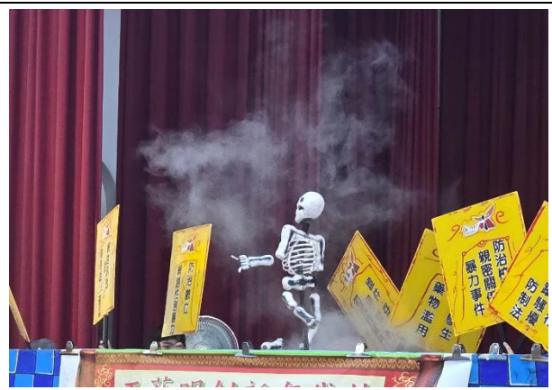
戲劇內容融合友善校園宣導