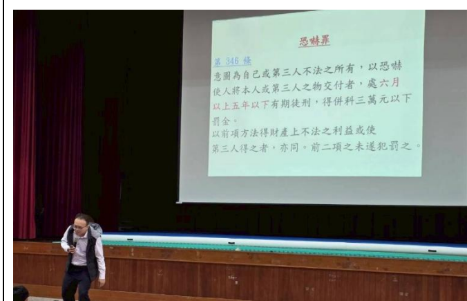
恐嚇罪、傷害罪等法律條文探討，望學生能藉由宣導講座反思自己的言行