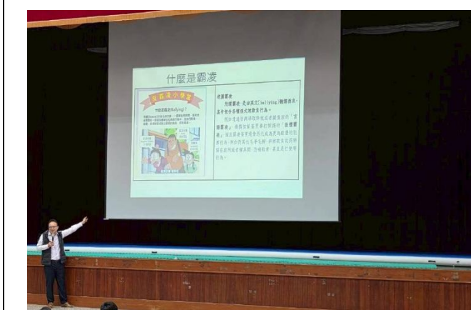
利用多拉 A 夢的胖虎說明霸凌的定義