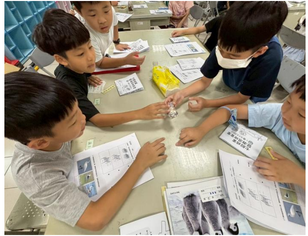
▲ 學生們不論是聚在一起專注閱讀繪本，還是在桌邊熱烈討論教材與分享教具，互動過程都顯得十分自然且相處融洽