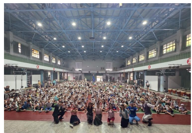
師生齊聚欣賞演出，共同營造健康無毒校園