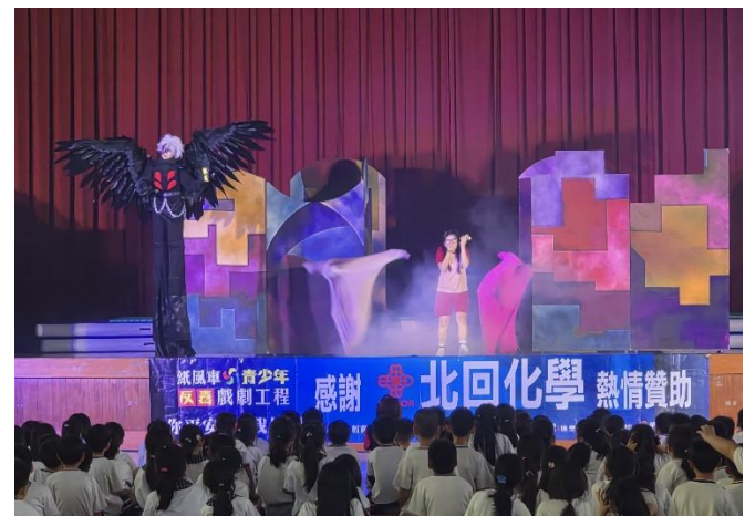
透過劇情呈現毒品可能的偽裝方式，提升辨識能力。