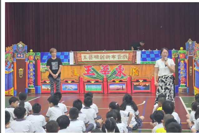
由校長開場介紹表演團隊