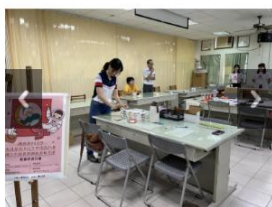
112學年度小紅帽月經教育課程