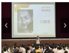
112學年度陽光基金會於 檳防制宣導