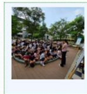
114學年度《世界視覺日——愛眼護健康》