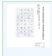
114學年度臺南市新進國民小學「視力保健」硬筆書法大賞 五年級組