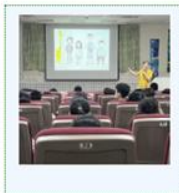
114學年度六年級月經平權暨生理衛生講座