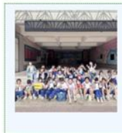
食農食魚教育之旅——與虱目魚、美生菜的邂逅