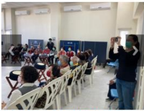
新進國小社區健康服務 GO