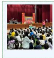
健康促進校園巡迴宣導活動【年輕活力e世代，保護眼睛亮晶晶】