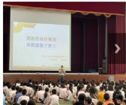
2學年度陽光基金會菸防制宣導