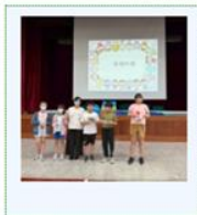
114學年度四年級營養教育講座