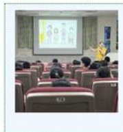
114學年度六年級月經平權暨生理衛生講座