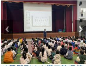
校牙醫到校宣導口腔保健