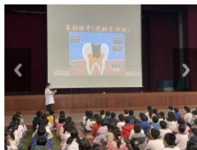
校牙醫到校宣導口腔保健