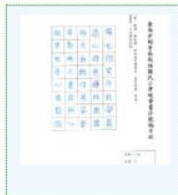
114學年度臺南市新進國民小學「視力保健」硬筆書法大賞 六年級組