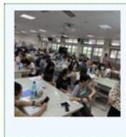
114學年度校園緊急傷病處理研習