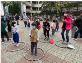
111學年度跨年有愛健康促進關活動