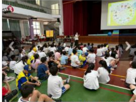
114學年度四年級營養教育講座