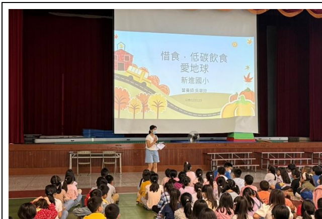
由本校營養師擔任講師