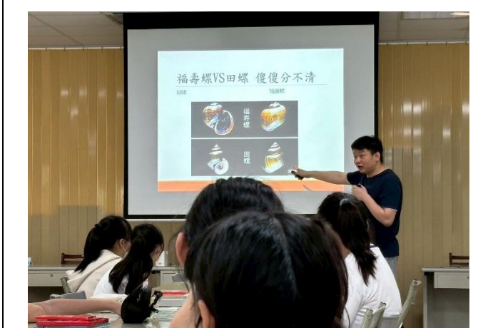
認識田螺及福壽螺