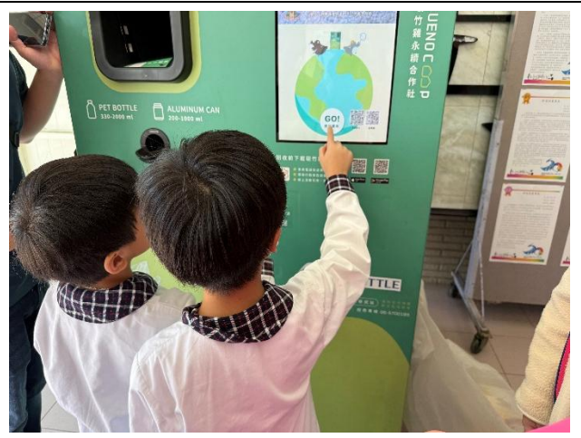
親手操作，回收也可以很有趣