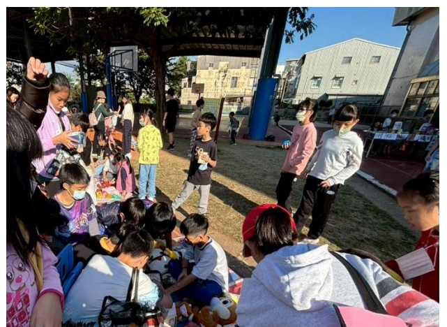
為舊物找到新主人，實現資源再利用