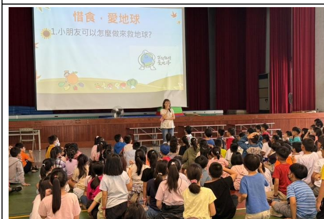
有獎徵答時間，學生專注聆聽題目