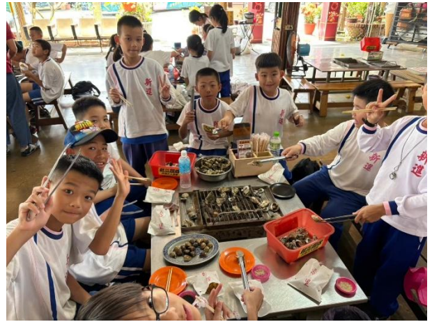
來到七股體驗有趣的烤蚵吃到飽