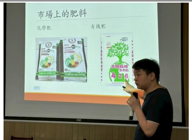
種植稻米常見的肥料種類