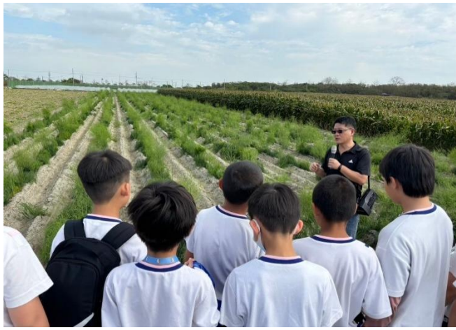
實地參觀農場，認識紅蘿蔔的種植環境