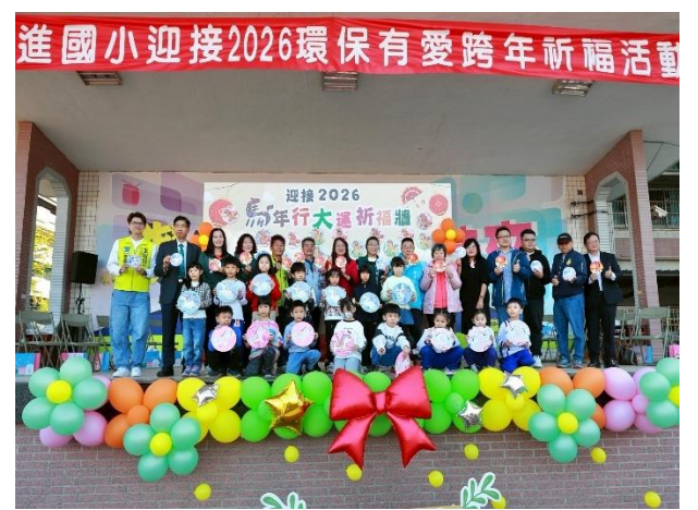
結合跨年，舉辦跳蚤市場活動