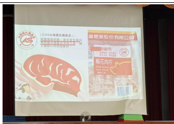
認識食物標章，選擇合適的產品