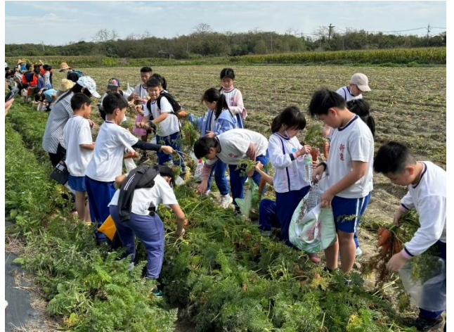
在教師的指導下，學生學習如何正確施力拔起紅蘿蔔