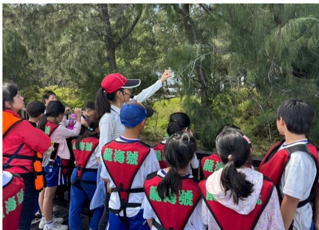
搭乘「龍海號」進行瀉湖生態導覽，登上網仔寮汕，學習當地動植物與漁業知識