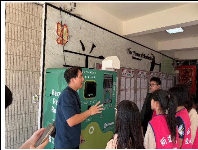
回收機廠商向小朋友介紹使用方式