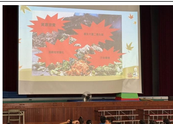
浪費食物對地球造成傷害