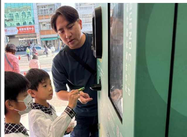
還可以回收電池喔