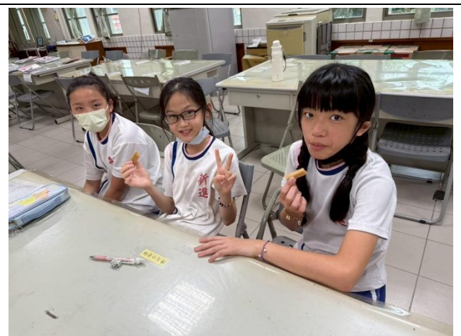
開心品嚐美味的甜粿