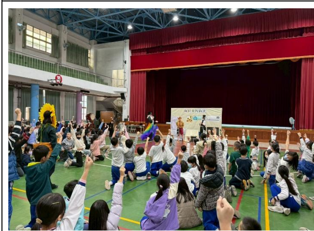
學生踴躍舉手回答