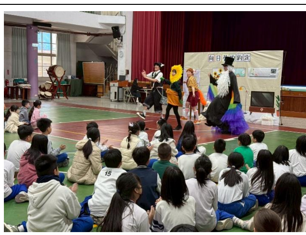
透過活潑的表演，宣導節電的知識