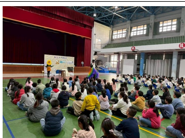
與台電合作，舉辦節電戲劇表演