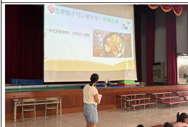
多吃原型食物，少吃加工食品