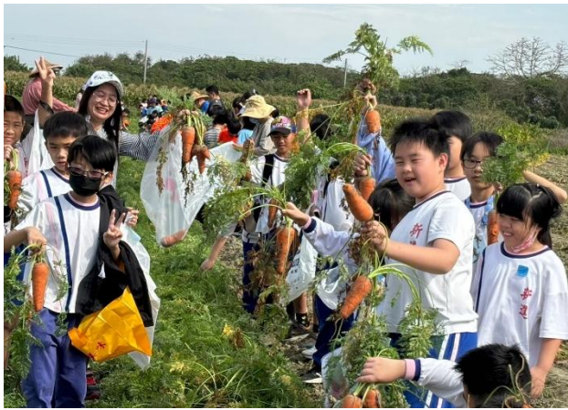
透過觀察並比較不同形狀的紅蘿蔔，體驗農作物自然生長的多樣性