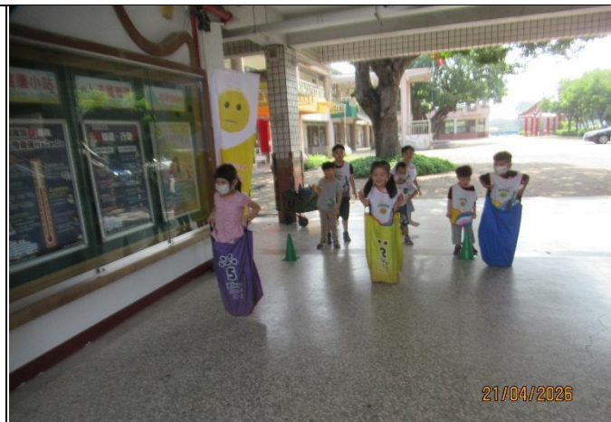
說明：附設幼兒園辦理健康促進體能活動歷程紀實，學童於川堂進行袋鼠跳趣味競賽。透過大肌肉訓練提升身體活動量，實質將動態生活觀念向下扎根。