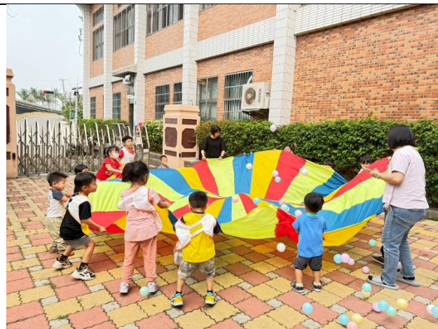
說明：附設幼兒園辦理健康促進體能活動歷程紀實，幼童進行氣球傘與拋接球趣味團隊遊戲。透過全身大肌肉伸展提升身體活動量，將規律動態生活觀念向下扎根。