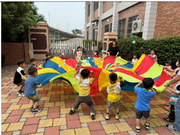
說明：附設幼兒園辦理健康促進體能活動，幼童進行氣球傘趣味團隊合作遊戲。透過全身大肌肉伸展提升身體活動量，將規律動態生活觀念向下扎根。