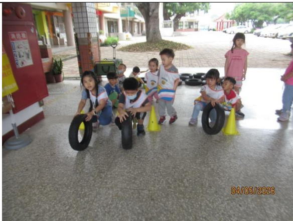
說明：附設幼兒園辦理健康促進體能活動，幼童進行滾輪胎趣味競賽實況。透過手眼協調與大肌肉訓練提升身體活動量，將規律動態生活觀念向下扎根。