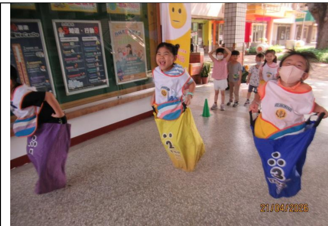
說明：附設幼兒園辦理健康促進體能活動，幼童進行袋鼠跳趣味遊戲實況。透過大肌肉活動提升身體活動量，將規律動態生活觀念向下扎根。