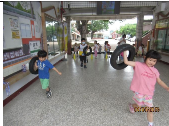
說明：附設幼兒園辦理健康促進體能活動歷程紀實，幼童進行輪胎趣味體能奔跑遊戲。透過負重移動與大肌肉訓練提升活動量，將規律動態生活觀念向下扎根。