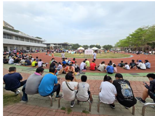
參與民眾非常眾多，成為每年六甲區盛事