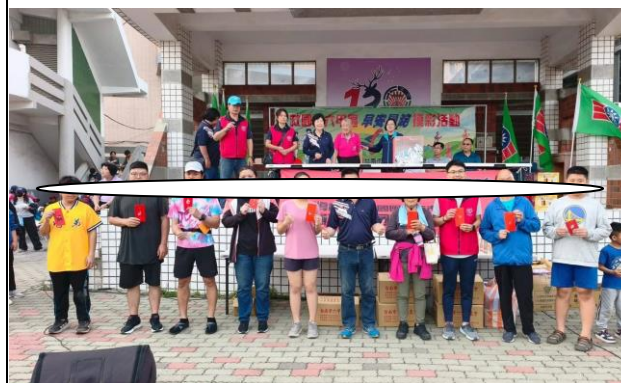
獎品非常豐厚，腳踏車 50 台非常壯觀