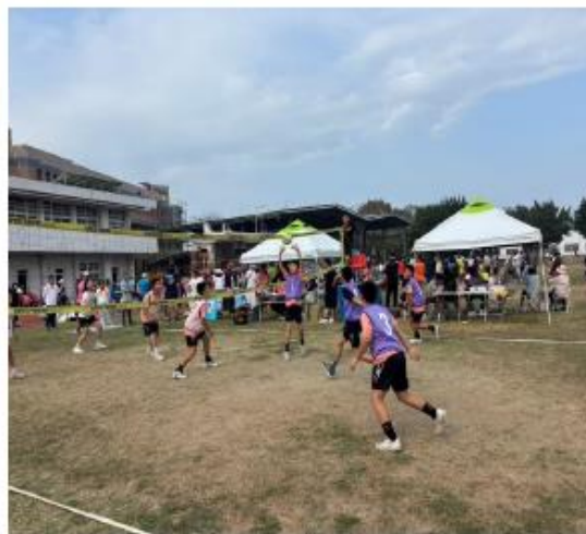
區民鄉親逗陣來, 熱血打排球