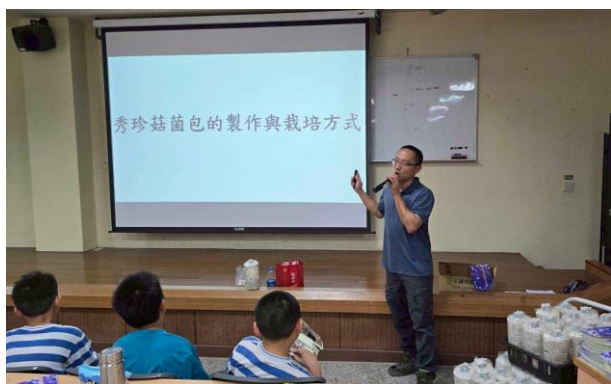
學生人手一支太空包, 體驗玩菇樂趣