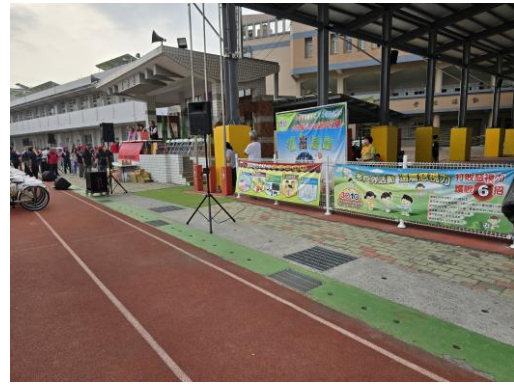
掛布條宣導戶外活動視力保健與健康飲食