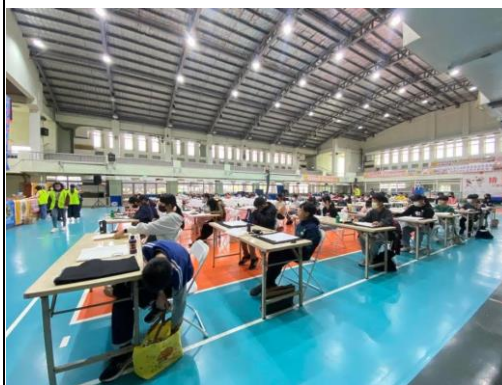
來自全市各路好手齊聚一堂一同較勁大展身手