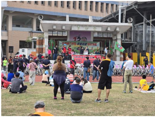
民眾各個期待自己是中獎幸運兒