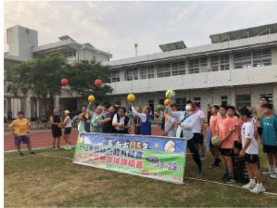
Ace 王非我莫屬~ play ball