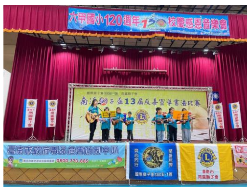
本校烏克莉莉社團開場表演