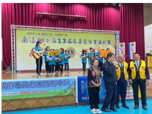
黃市長蒞臨會場鼓勵選手及感謝工作人員