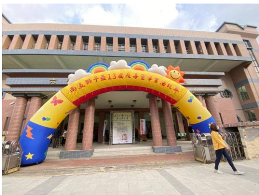
六甲國小協辦提供舒適的比賽環境