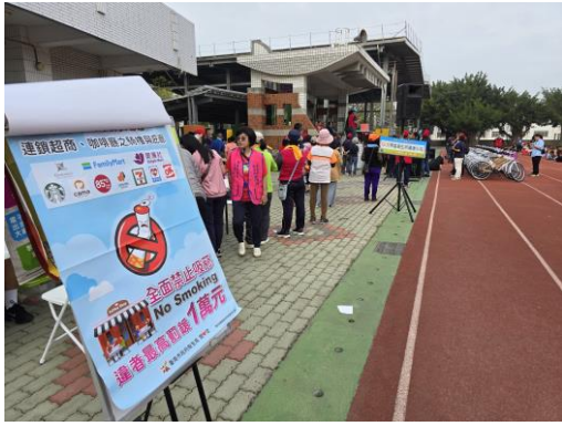
會場布置禁菸場所需知宣導