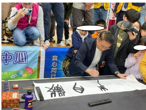
長官現場大筆揮毫展現大師風範