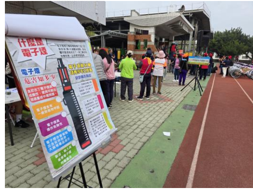
宣導禁止電子煙販賣與吸食