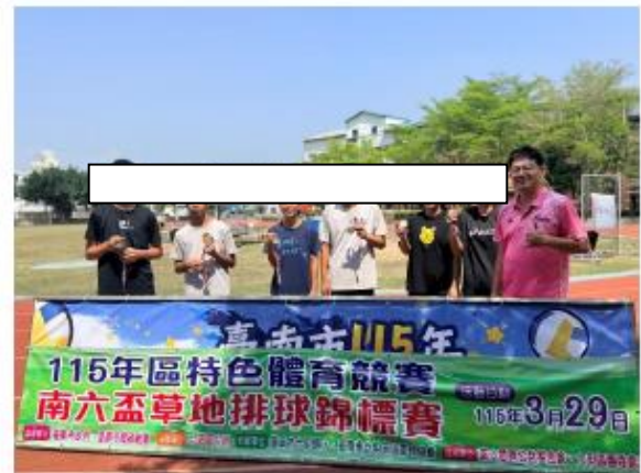
市民體驗組各組優勝選手頒獎