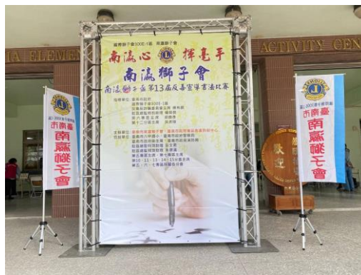
會場大門展示今日是活動程序表供參閱