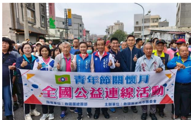
跑完全程即可獲得摸彩卷一張