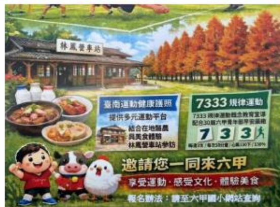
7333 規律運動闖關宣導