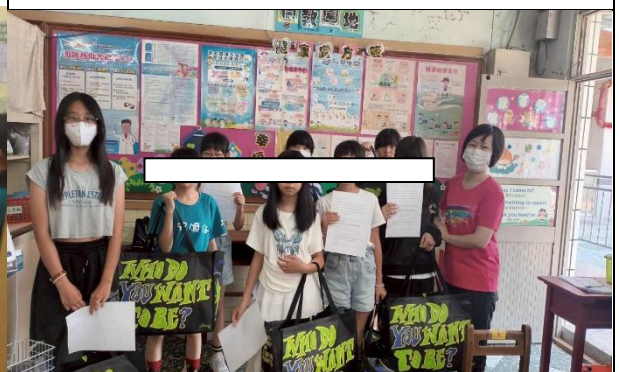
衛教生理期衛生棉使用並領取補助衛生棉