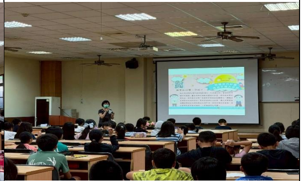
衛生所護理師說明登月計畫及消除性別歧視