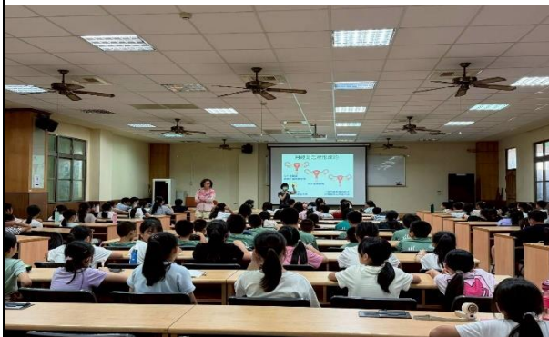
衛生所護理師介紹生理變化月經如何形成