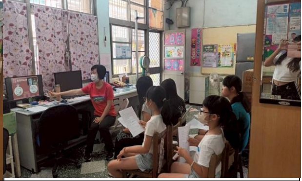
藉由講座轉達登月計畫