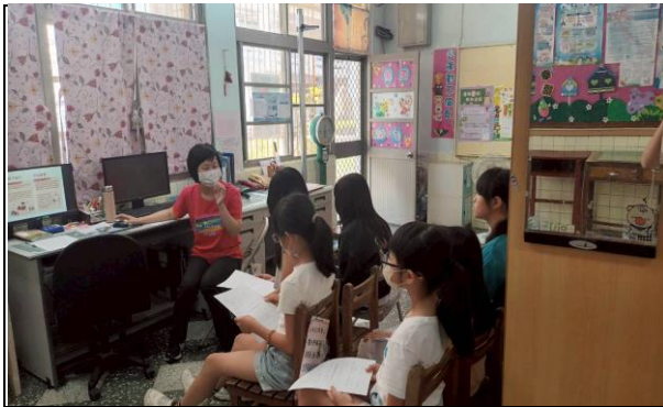
衛教青春期生長發育過程