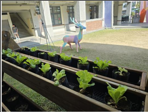
在細心的照顧下，各個頭好壯壯