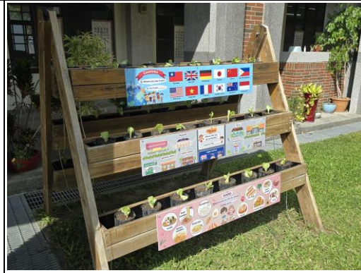
小菜菜鑽出頭來了