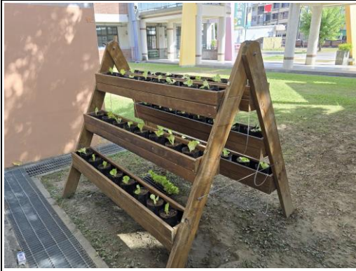
閒置花臺規劃種植蔬菜