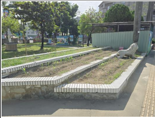
閒置的花圃規劃種玉米