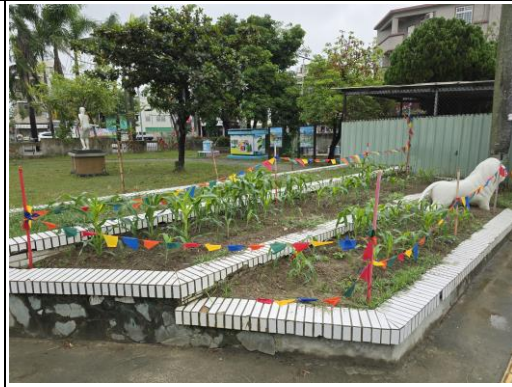
小玉米開始快樂成長