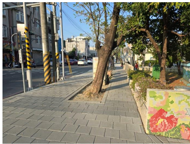
學校規劃綠色通學步道，親子共走