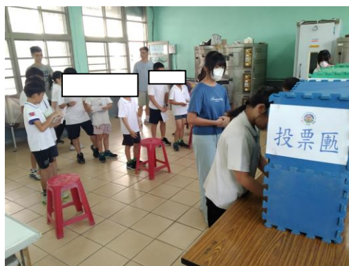
投票選出心中理想的候選人