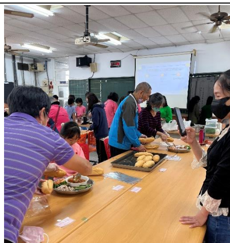
學員自己製作越南麵包