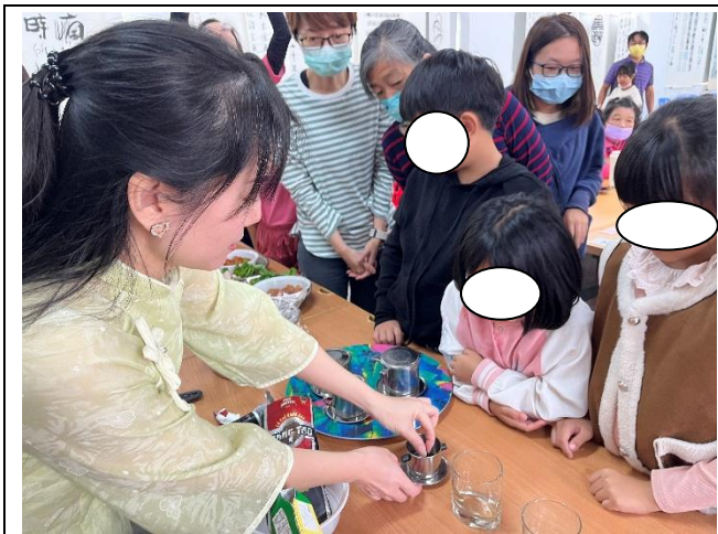
講師說明如何泡越南咖啡