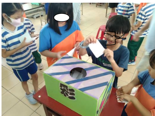
將選票小心翼翼投入票箱