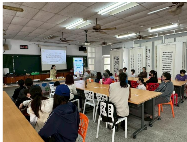
講師帶領大家認識東南亞文化