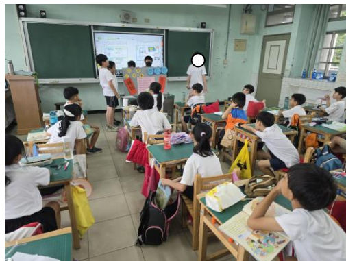
候選人到各班拜票