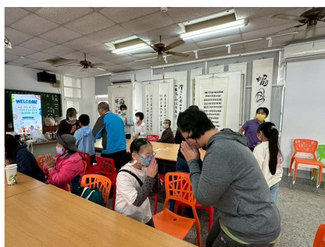
講師帶領大家用泰語互道你好