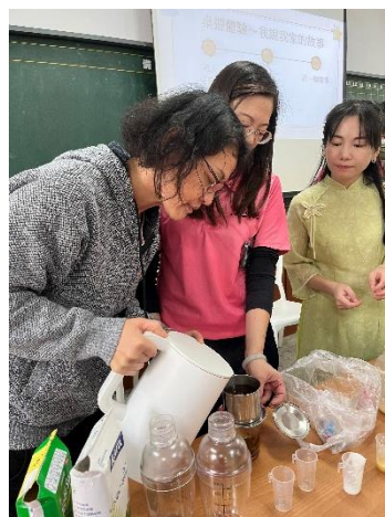
學員自行體驗泡越南咖啡