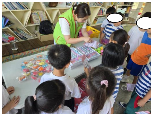
基金會準備了需多精美的小物讓小朋友兌換