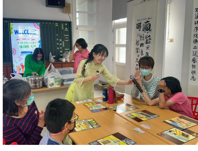
參與的在校生發表