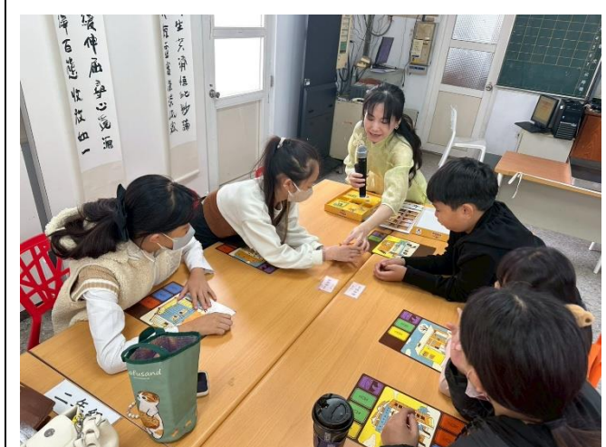
利用桌遊，體驗各國文化差異，進而學會互相尊重