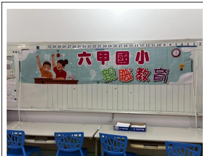
講師帶領大家認識東南亞文化