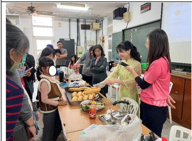
講師說明如何製作越南麵包