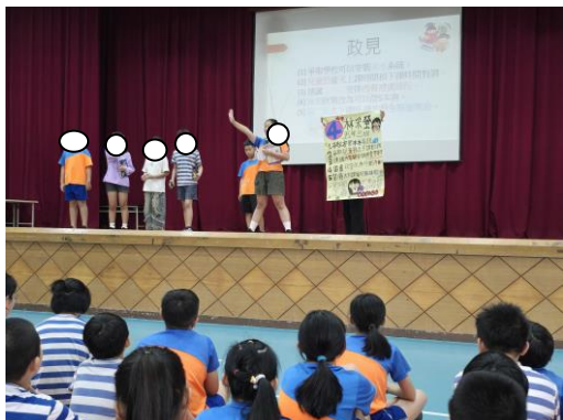
候選人公開政見發表會