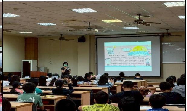
說明登月計畫及消除性別歧視