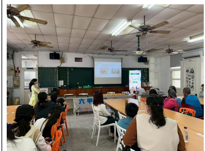
講師帶領大家認識東南亞文化