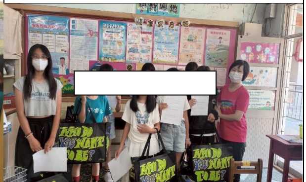
衛教生理期衛生棉使用並領取補助衛生棉