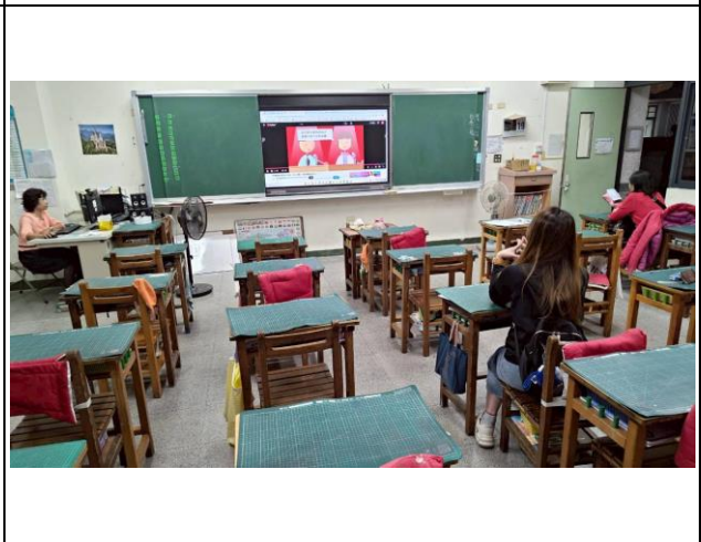
家長日結合性平宣導