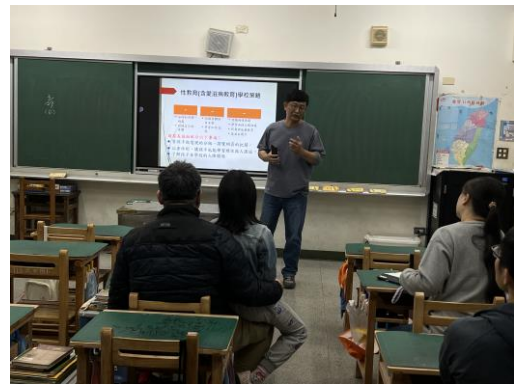
性教育(愛滋病防治)宣導