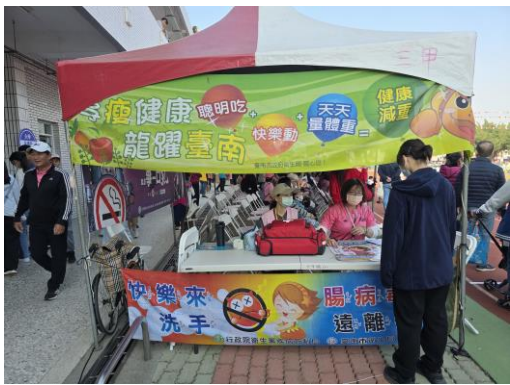
救護站設置健康營養教育宣導