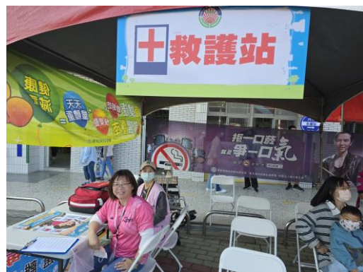
救護站設置健康營養教育宣導