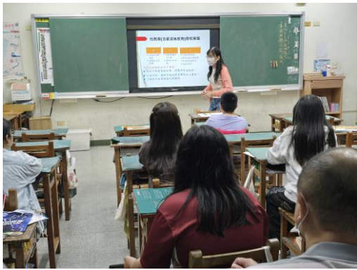
性教育(愛滋病防治)宣導