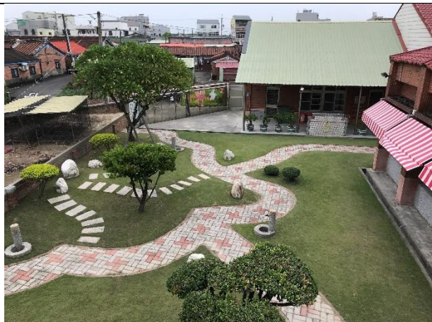
校園角落布置成公園型步道