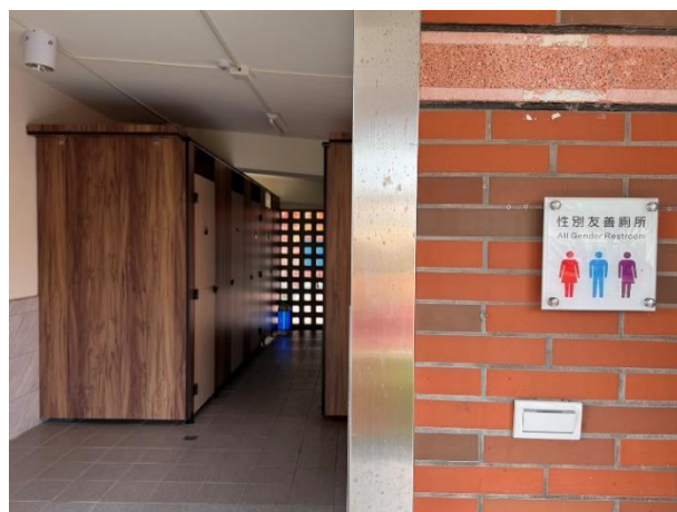
廁所修繕為友善廁所，並融入在地鄉賢顏水龍之馬賽克作品