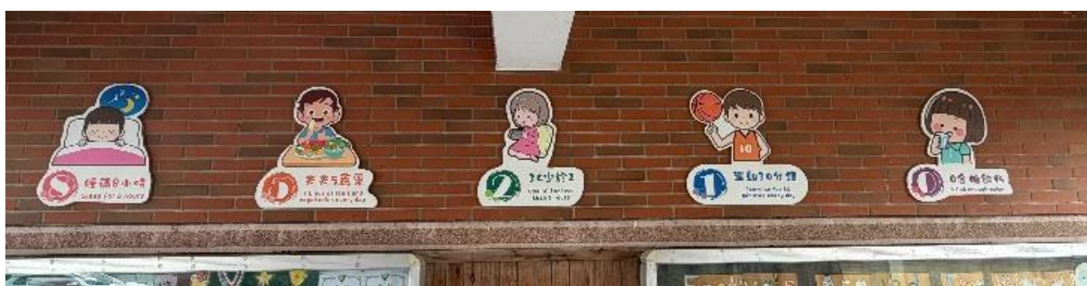
運用校園空白牆壁傳達健康資訊