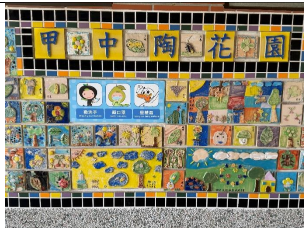
將學生作品作成拼貼牆