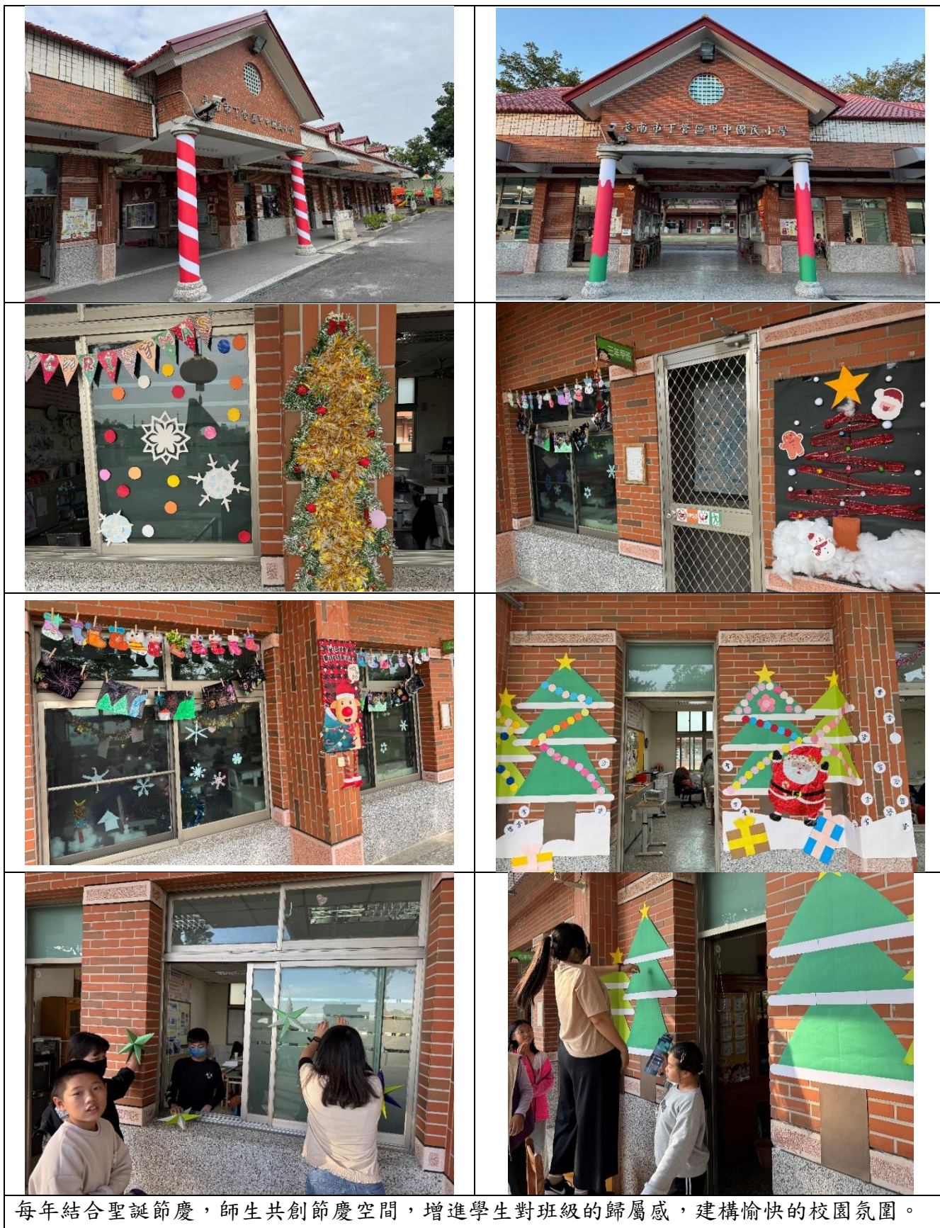
每年結合聖誕節慶，師生共創節慶空間，增進學生對班級的歸屬感，建構愉快的校園氛圍。