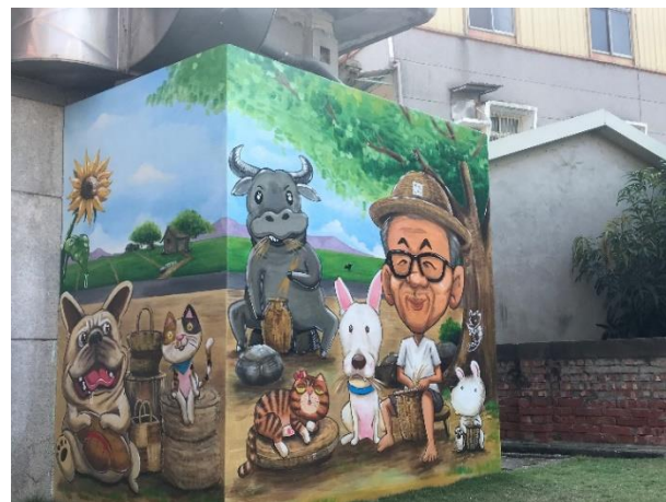
透過視覺色彩的重構，活化老舊牆面，營造有療癒感與激發想像力的校園轉角