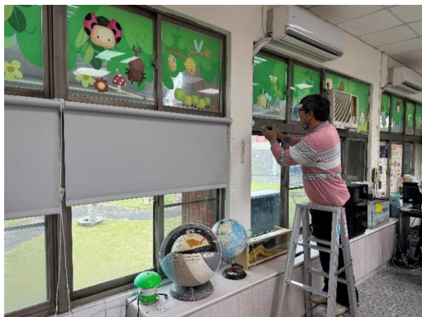
西曬遮光採用卡通圖案，給與學生舒適氛圍