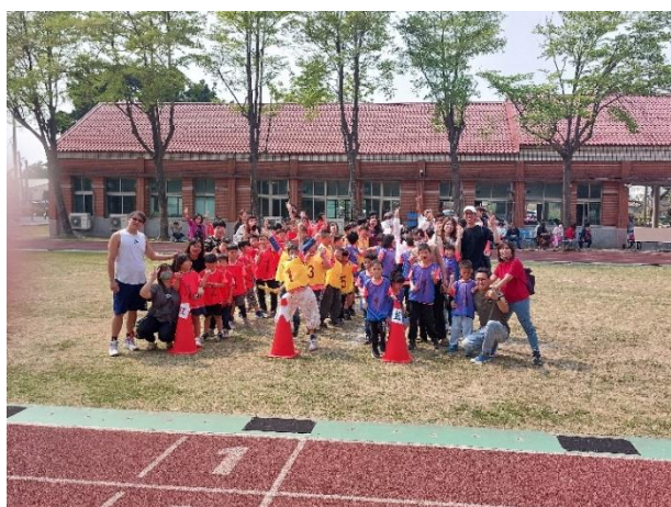
每年舉辦校慶運動會及成果發表會，增進家長和學生的參與感