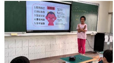
心理健康-學生簡報情緒同理心