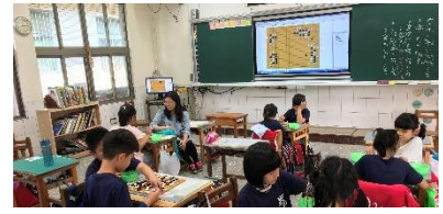
關注心理健康-開設圍棋教學培養學生冷靜思考及平穩心理情緒