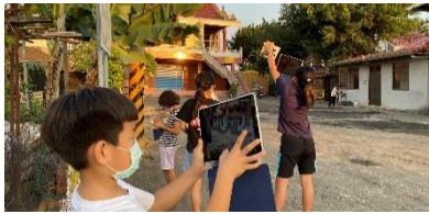
以平板進行社區外拍，以利後續社區福利環境 PBL 之佐證資料

(一)善用數位設備，利用班班大電視及生生有平板之優勢，進行健康促進議題活動或融入各科教學，可即時互動及反饋，有利學習效益之提升。