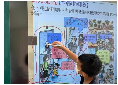
兩性課程-利用 Myviewboard 系統進行性別刻板印象點選