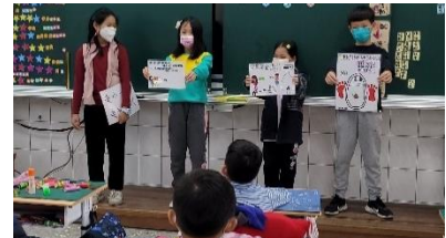
公衛議題-如何如廁最衛生