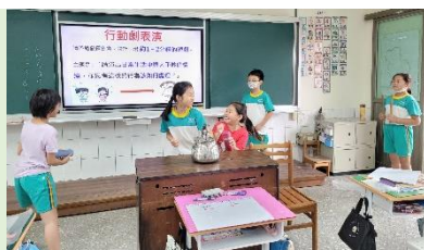
健康促進專題研究型行動劇