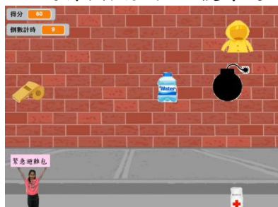
學生設計的 Scratch 避難物品包接物遊戲，同步理解防災安全

(二)程式及機器人課程融入反毒及防災安全議題，學生自行設計 Scratch 逃生包接物遊戲，從設計過程中認識防災避難物資(安全教育)。另將反毒意識與機器人課程結合，嘗試以機器人進行模擬監控及搜尋定位之思維運作，獲得反毒機器人比賽佳作。