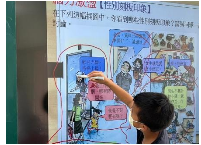
兩性課程-利用 Myviewboard 系統進行性別刻板印象點選