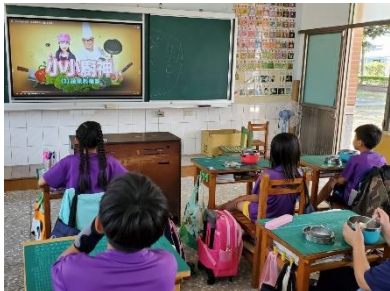
飲食與營養-班級大電視實施餐前五分鐘營養教育，並實施測驗