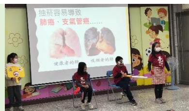
健康促進專題研究型行動劇