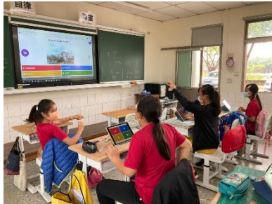
利用平板及大電視，以 kahoot 系統進行課中即時健康知識測驗