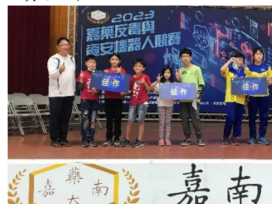
反毒機器人獲得 2023 反毒與資安機器人競賽佳作成績