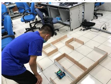
開設程式課程融入健康促進，以機器人進行監控及定位尋找