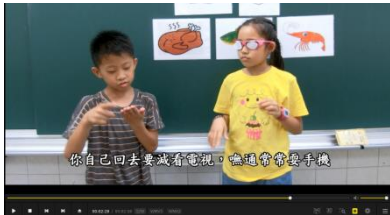
飲食健康答喙鼓影片全市佳作