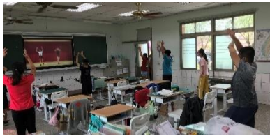
利用大電視在班級進行健康操運動，關注學生體能