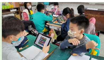
健康促進專題研究型行動劇