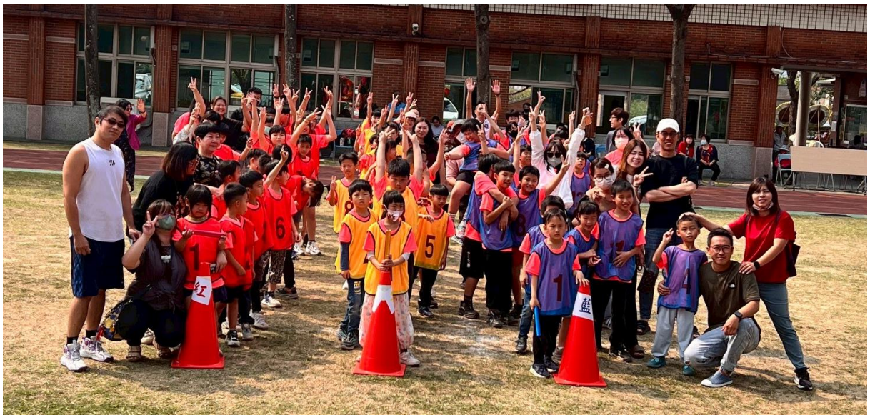
說明：全校大隊接力