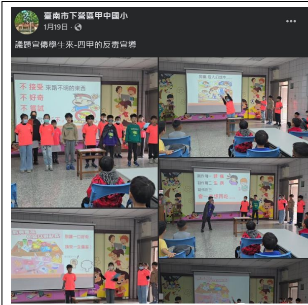
說明：學生設計健康議題進行全校表演