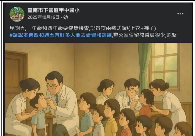
說明：健康檢查通知