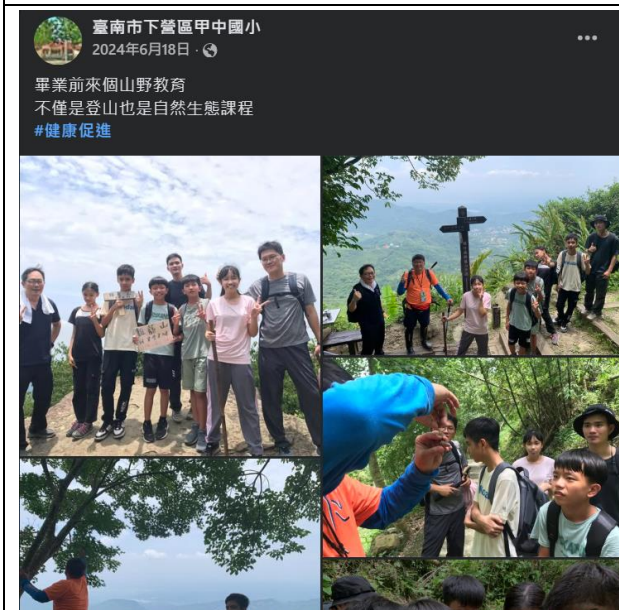
說明：宣傳學校山野教育課程