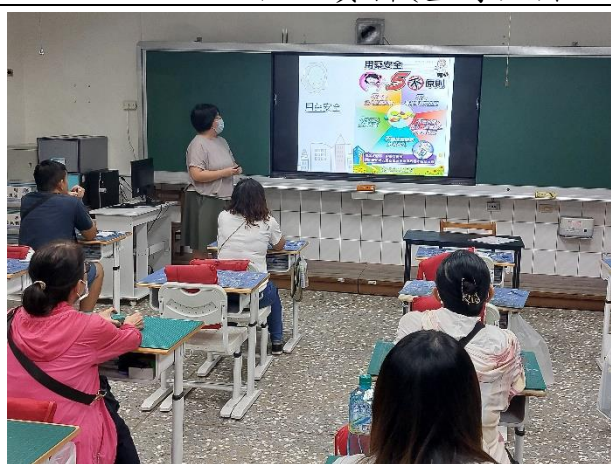
說明：用藥安全宣導