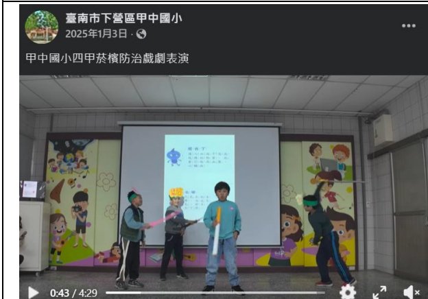
說明：學生設計健康議題進行全校表演