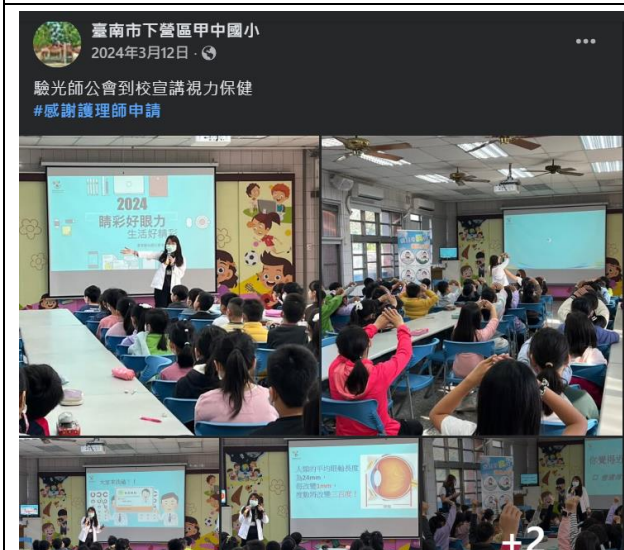
說明：驗光師公會到校宣導視力保健