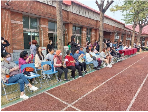
說明：社區人士及家長踴躍參與