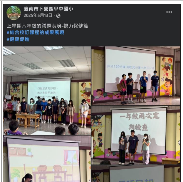
說明：學生設計健康議題進行全校表演