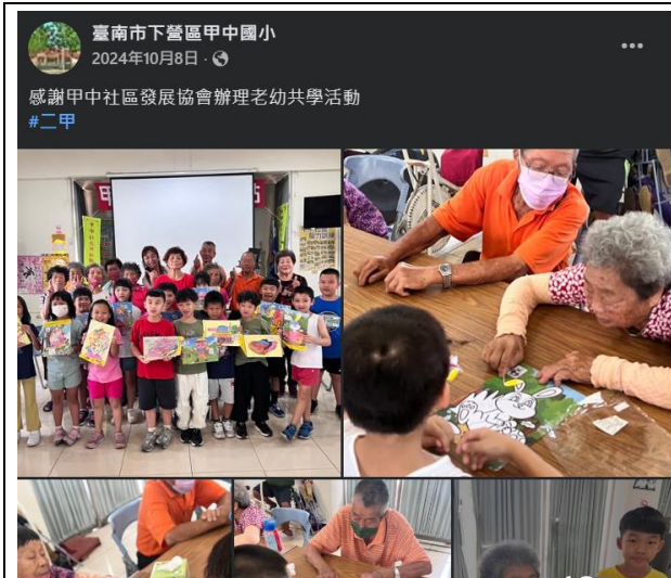
說明：學生參與社區老幼共學活動