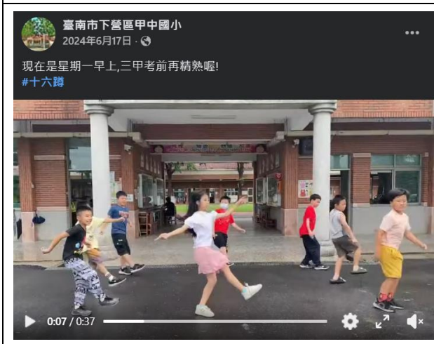
說明：推廣十六蹲影片