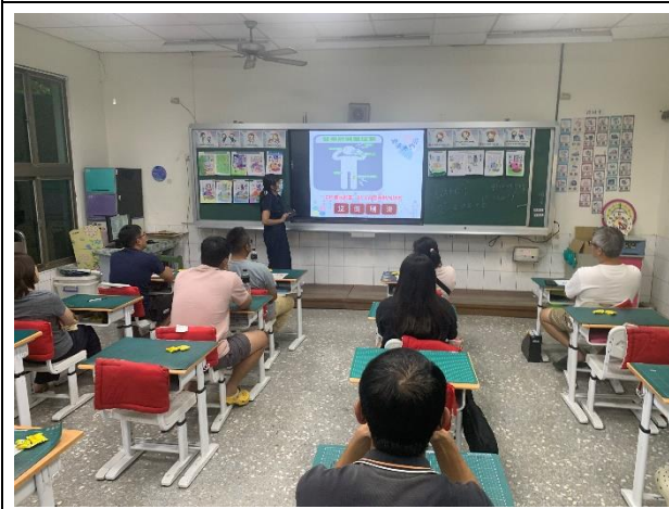
說明：登革熱防治宣導