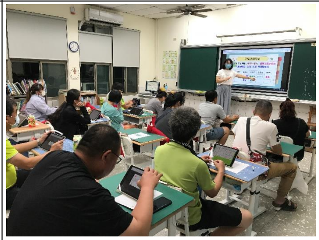
說明：因才網平板使用及使用時限宣導