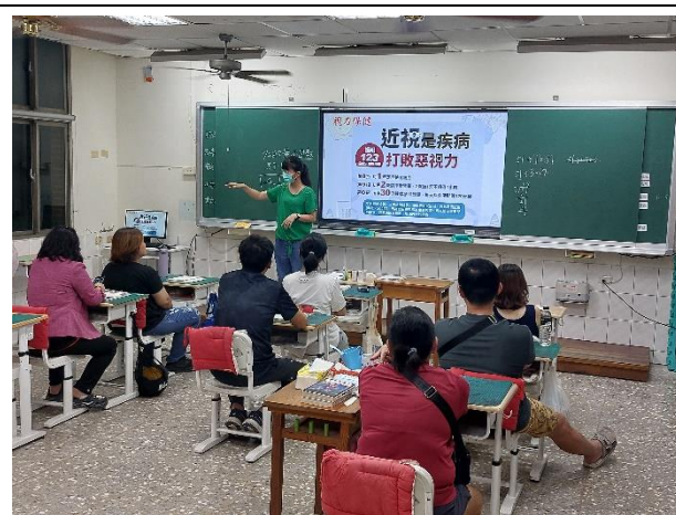
說明：近視預防宣導