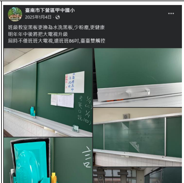
說明：維護學童健康設備改善專案宣傳