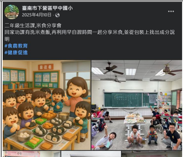
說明：學校推廣米食實作課程