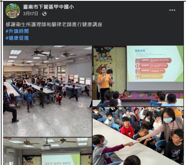
說明：衛生所到校宣導運動與健康飲食