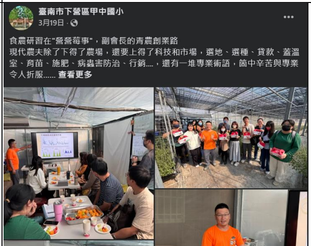
說明：宣傳老師精進健康食農新知