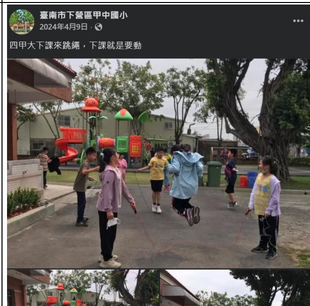
說明：宣傳學校課間運動