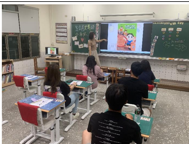
說明：健康體位宣導