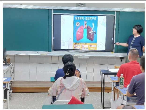
說明：電子菸防治宣導