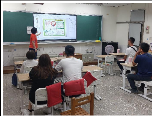
說明：食安腸胃炎宣導