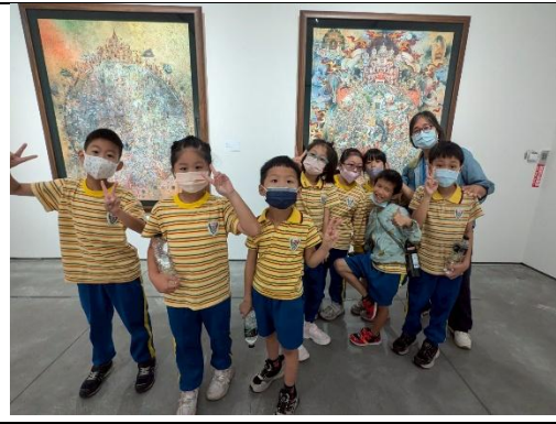
結合公共藝術計畫至南美館參訪