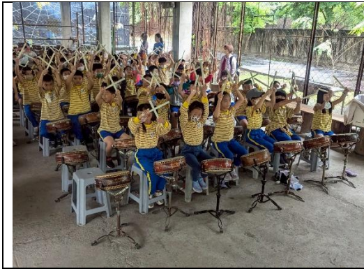
結合公共藝術計畫至十鼓參訪