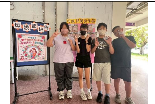
學生表達對媽媽的愛