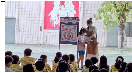
每年節慶進行感恩活動-母親節