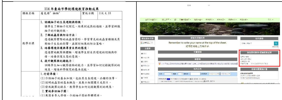
參加綠色學校夥伴環境教育