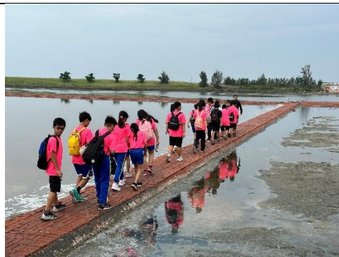
戶外教學至北門鹽田，認識海洋教育重要性