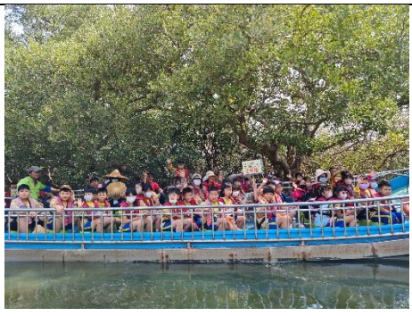
戶外教學至四草綠色隧道，認識紅樹林生態