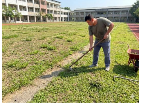
定期投藥，防治孳生