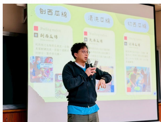
說明：認識在地農產文化。