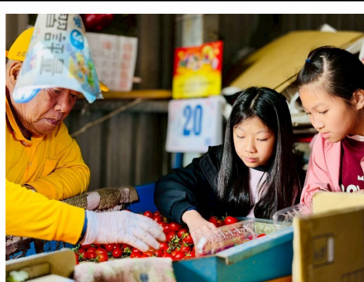
說明：農友介紹番茄採收流程。