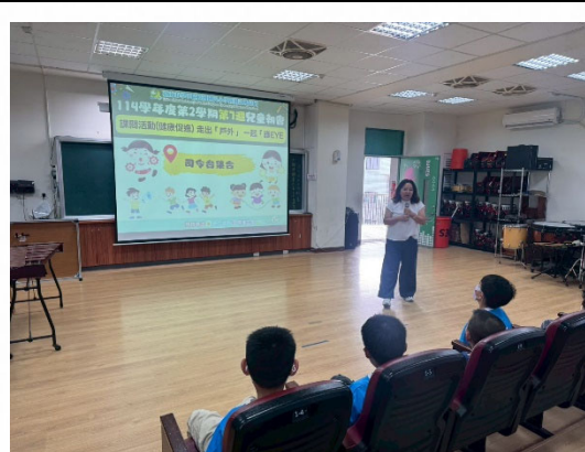
說明：兒童朝會公布本週打卡地點。