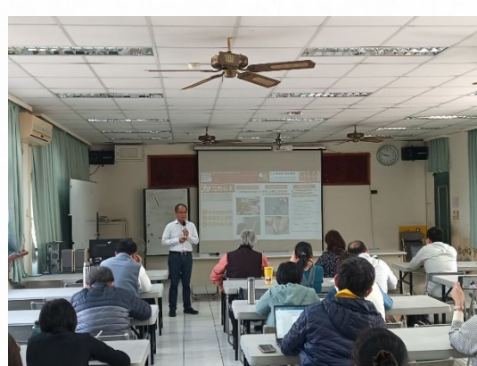
說明：推廣視力保健成功策略。