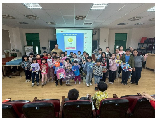
說明：學期末公開抽獎鼓勵參與。