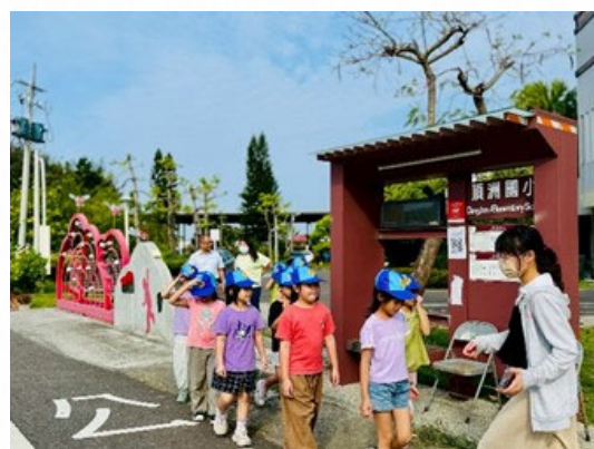
說明：體驗戶外健康學習活動。