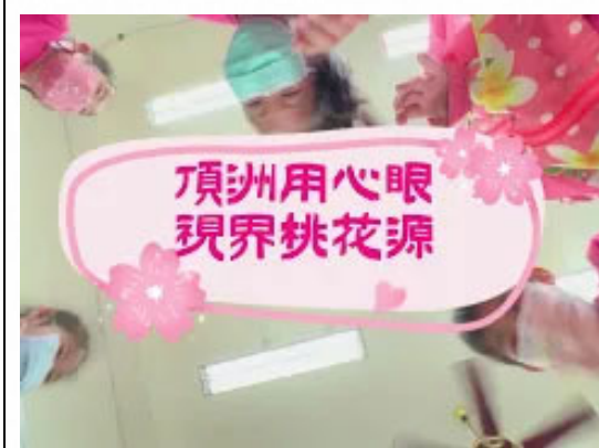
說明：拍攝視力保健成果影片，分享推動策略與執行成果，供校際觀摩交流。