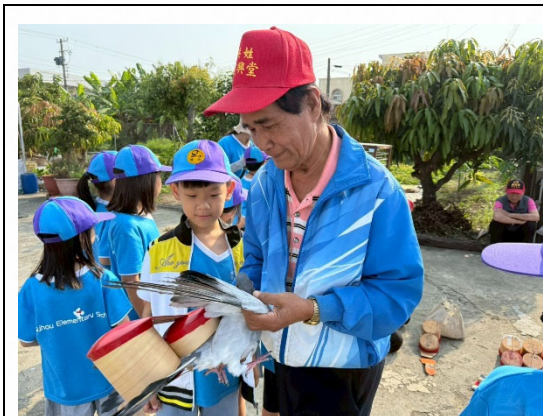
說明：學生認識在地鴿苓文化。