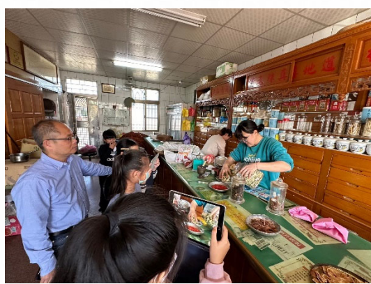
說明：學生認識藥材保存方式。