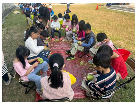
說明：戶外進行食農實作。