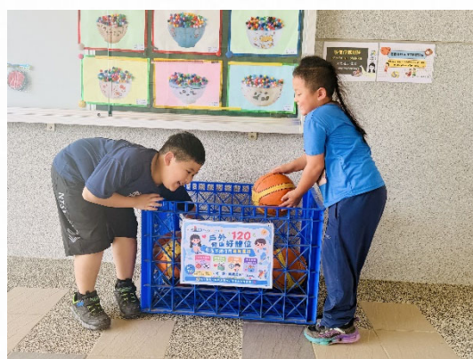
說明：學生借用球具快樂運動。