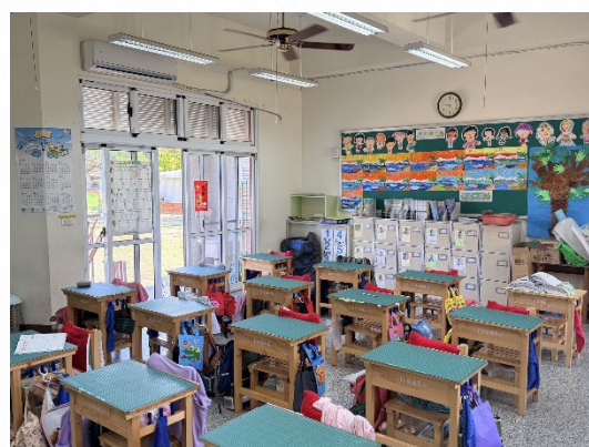
說明：教室淨空提升運動參與。