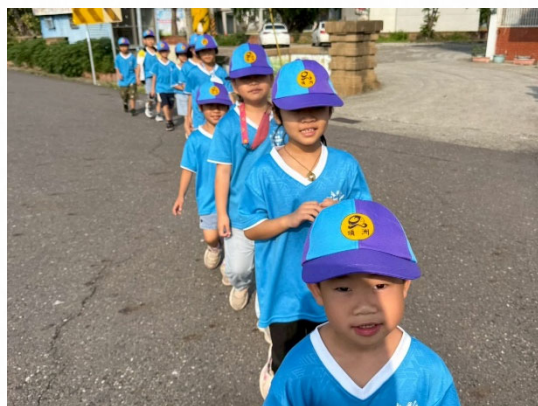
說明：戶外踏查觀察鴿苓活動。