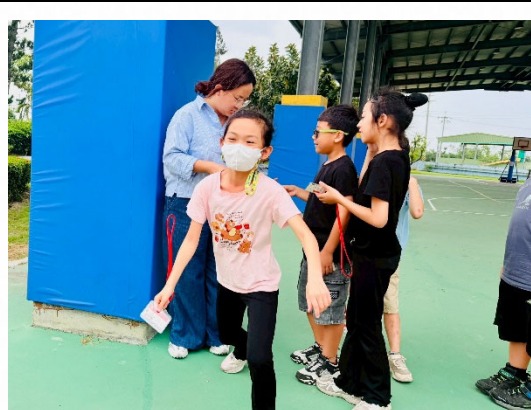
說明：學生到指定地點完成打卡。