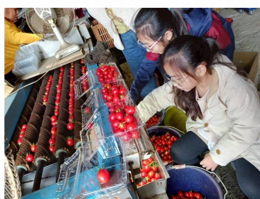
說明：學生觀察農作生長環境。