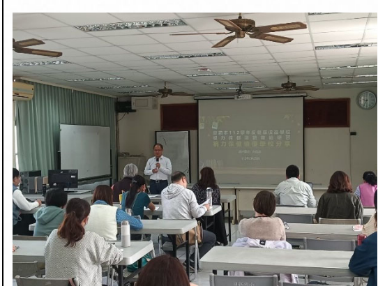
說明：參與校際健康經驗交流。