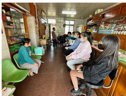
說明：學生與藥師互動提問。