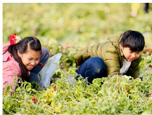
說明：學生體驗番茄採收活動。