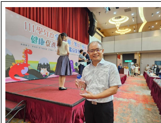
說明：榮獲視力保健績優表揚。