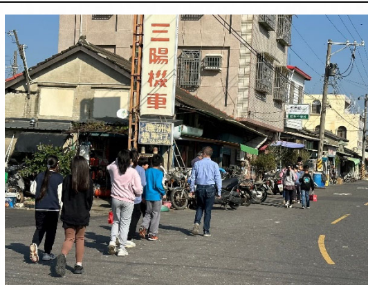
說明：學生參訪社區中藥行。