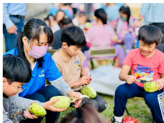
說明：師生共作西瓜綿。