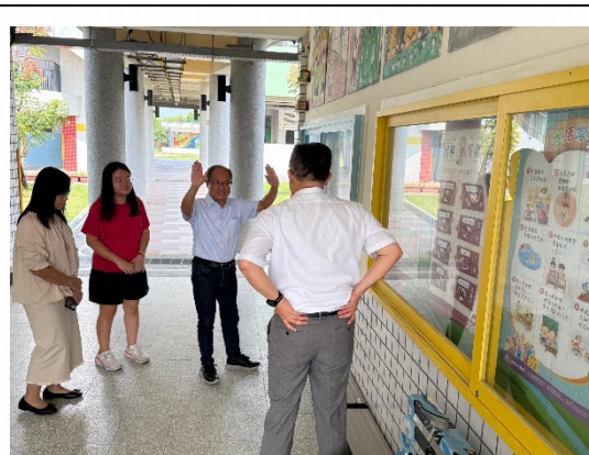
說明：校長分享健康推動成果。