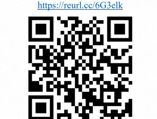
說明：拍攝西瓜綿課程影片分享成果。