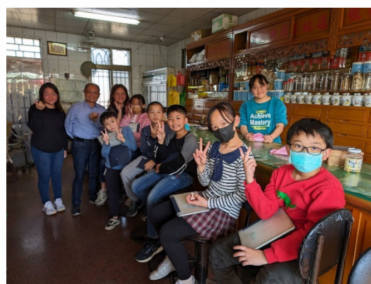
說明：合影紀錄健康參訪活動。