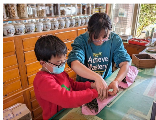
說明：學生動手體驗中藥包製作。