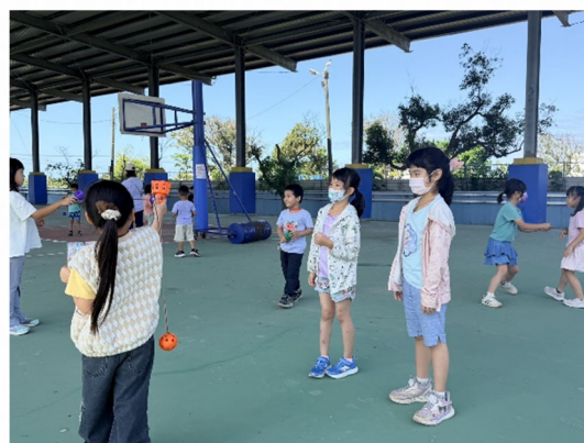
說明：下課踴躍參與戶外活動。