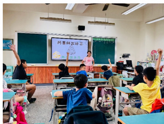
說明：成果展示創意料理。