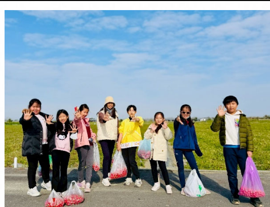
說明：學生認識在地番茄產地。