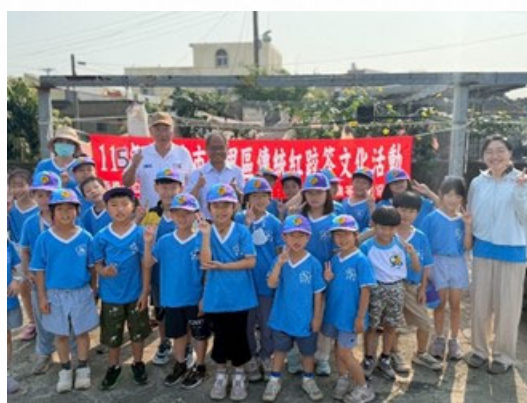
說明：學生參與社區文化探索。