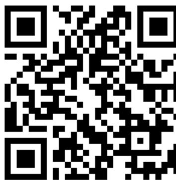
說明：拍攝鴿苓文化影片分享成果。