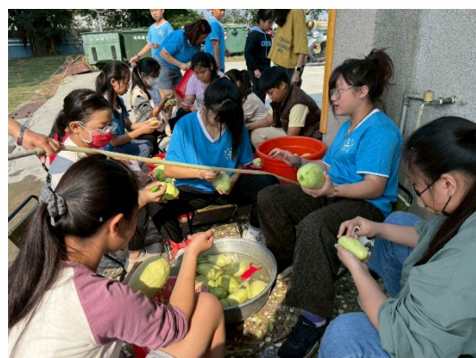
說明：學生動手處理食材。