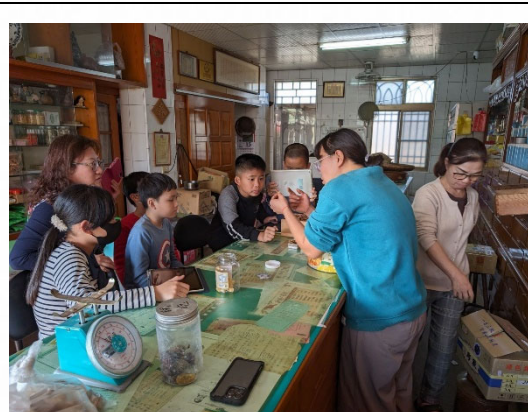
說明：藥師介紹常見中藥材。