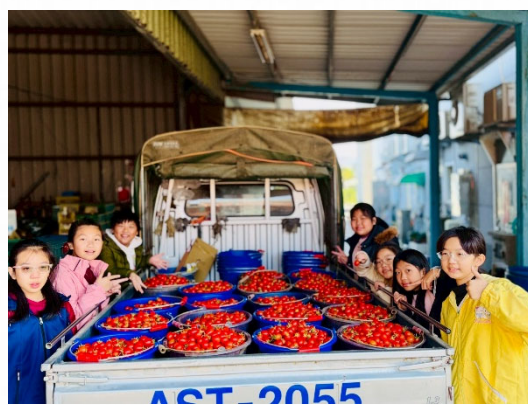
說明：完成小園丁認證活動。