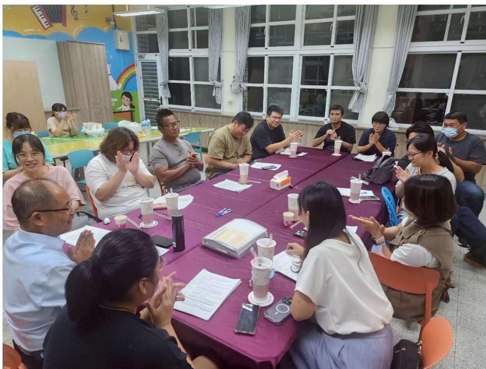
說明：家長會支持學校推動健康促進相關活動。