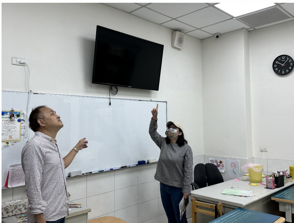
說明：拜訪課後照顧機構，共同推動視力保健與健康生活習慣。