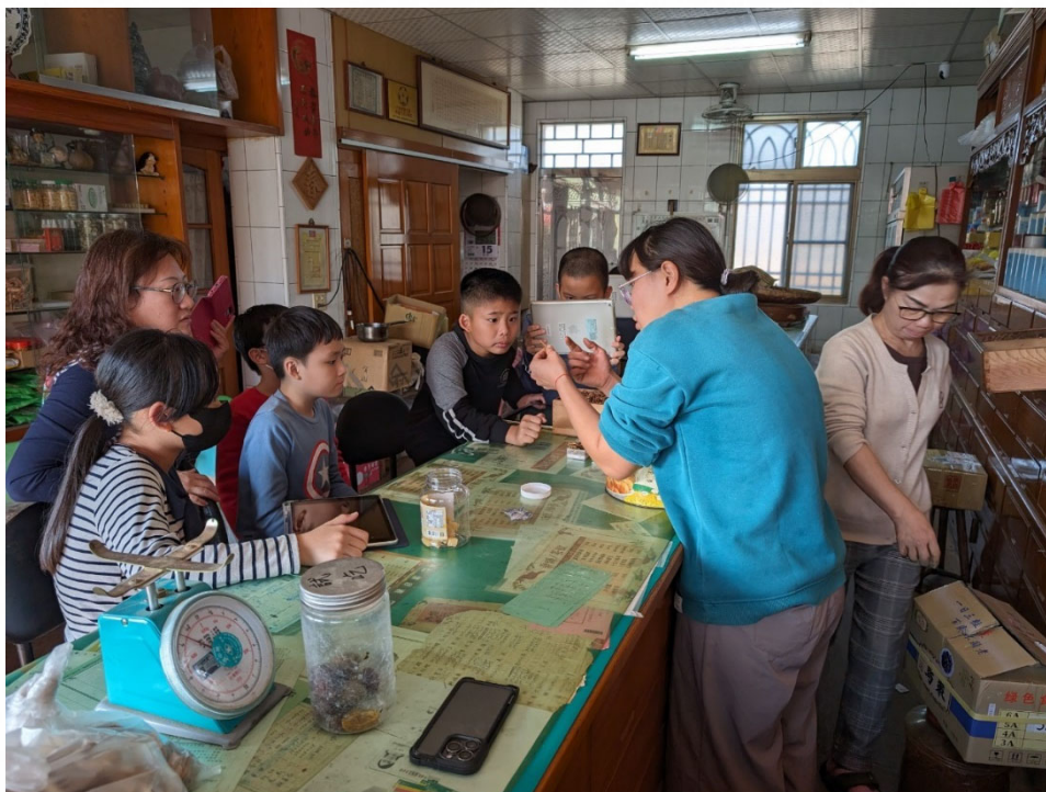
說明：中藥師介紹日常保健與養生觀念。