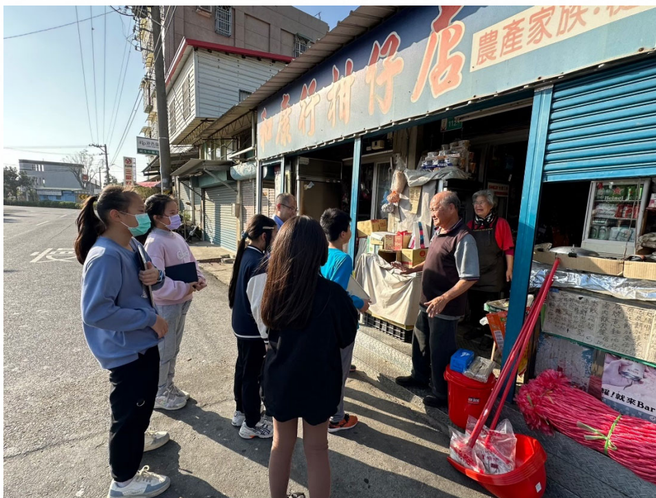
說明：與社區商家交流健康飲食理念，共同支持學生健康飲食。