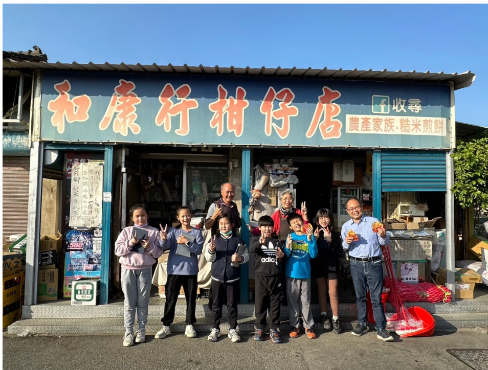
說明：社區商家共同支持學生健康飲食。