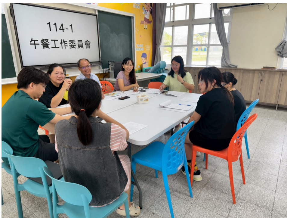
說明：邀請家長和學生代表參與午餐工作委員會，共同把關學生飲食健康。