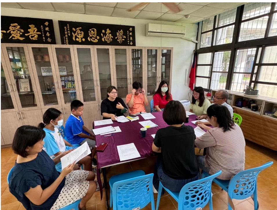
說明：邀請家長及學生代表參與，共同推動健康促進議題。