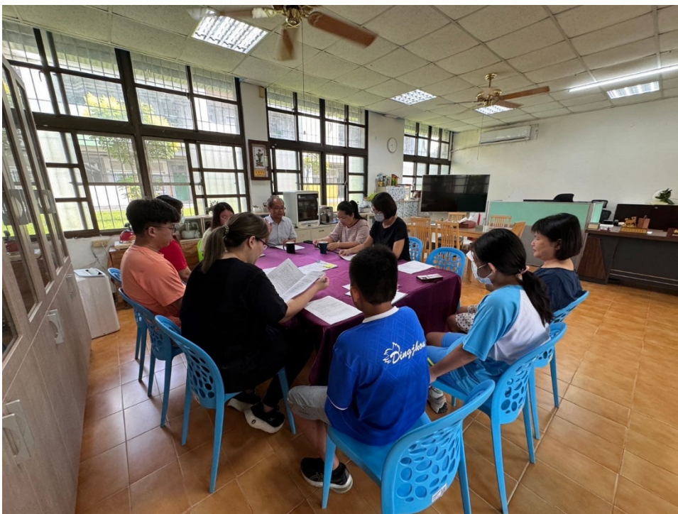
說明：召開健康促進委員會，共同研議學校健康促進工作。

邀請家長代表、學生代表及學校成員共同參與健康促進委員會，研議健康促進推動方向與策略，凝聚健康促進共識，攜手營造健康支持環境。