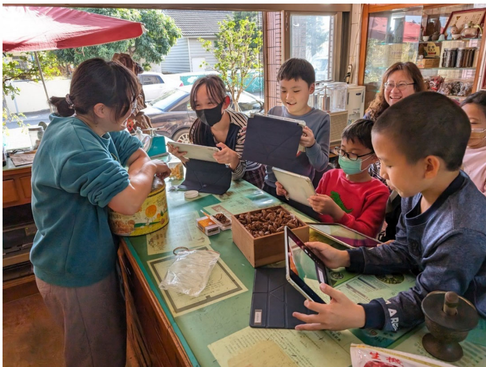
說明：帶領學生參訪中藥行，認識常見中藥材與用途。