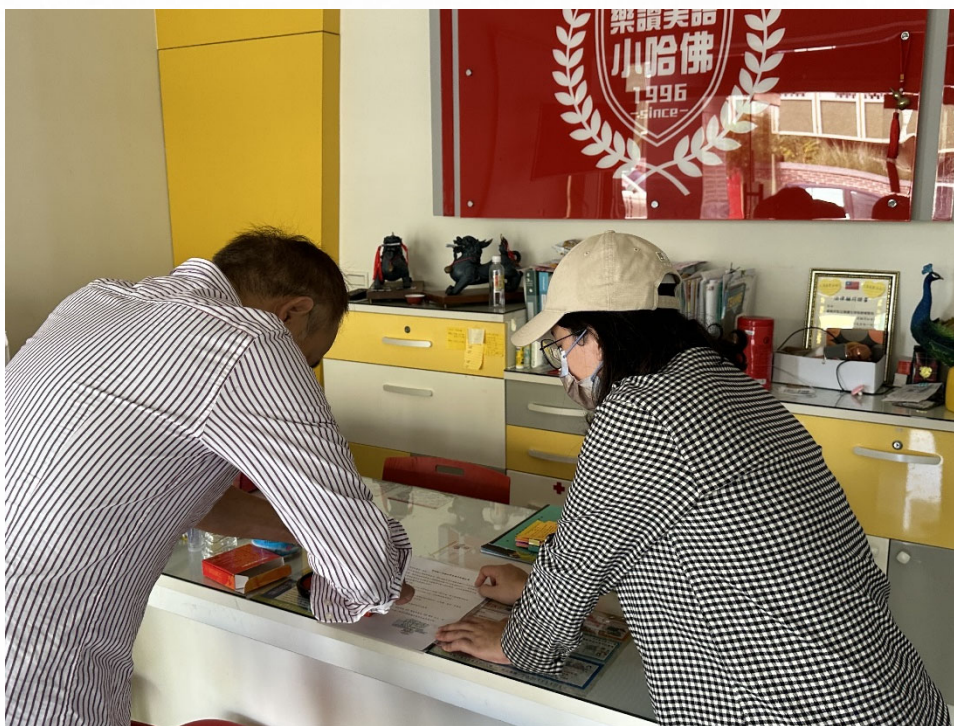
說明：建立學校與課後照顧機構合作機制，延伸健康教育成效。