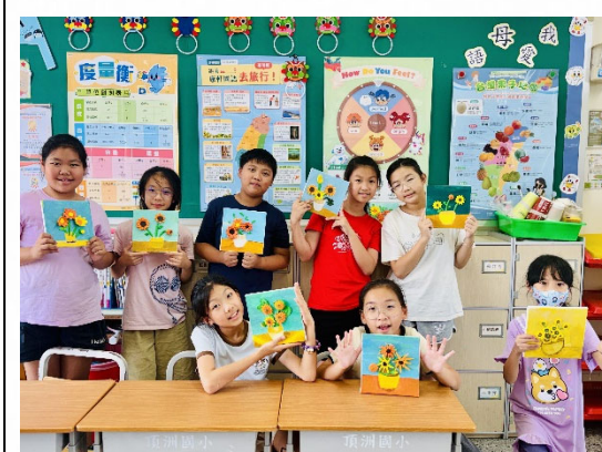
說明：美感教育提升幸福。