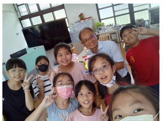
說明：校園充滿幸福氛圍。