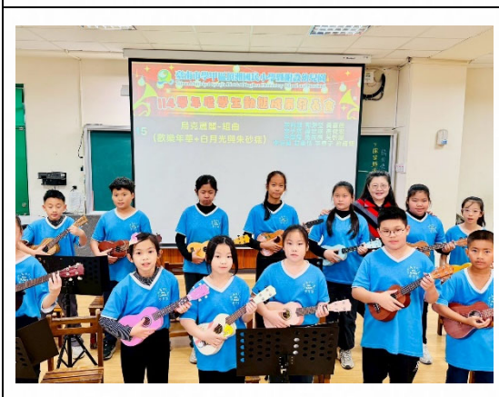
說明：成果發表提升成就。