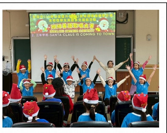
說明：學生展現學習成果。