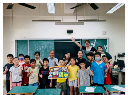
說明：師生共創友善校園。