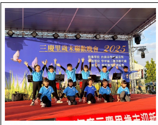
說明：舞蹈展演建立自信。