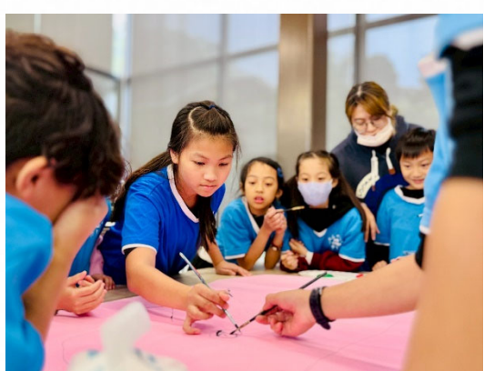
說明：藝術活動凝聚情感。