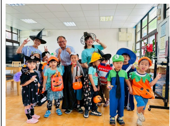
說明：節慶活動增添歡樂。