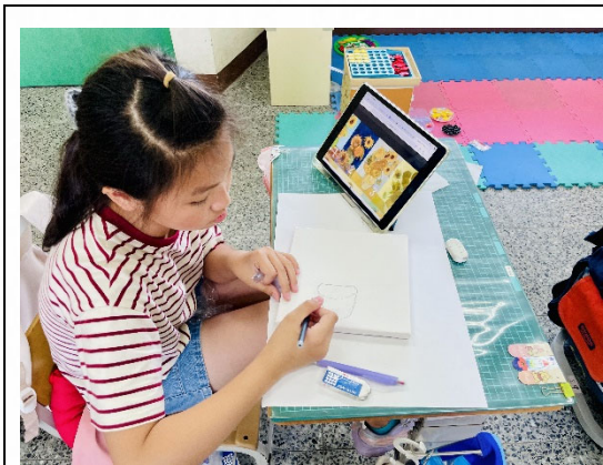
說明：藝術創作培養美感。