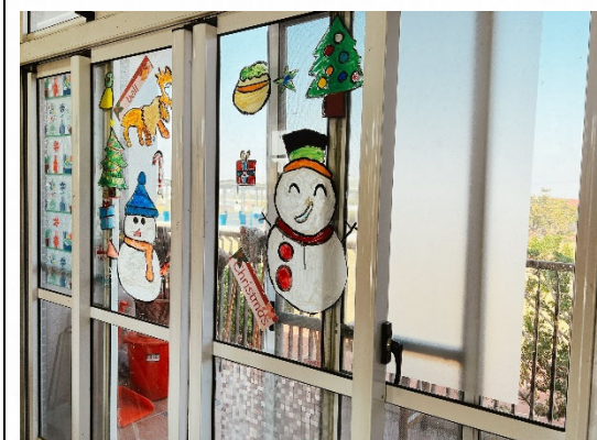
說明：作品展示美化校園。