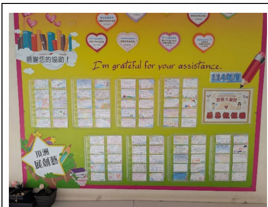
說明：感恩活動傳遞溫暖。