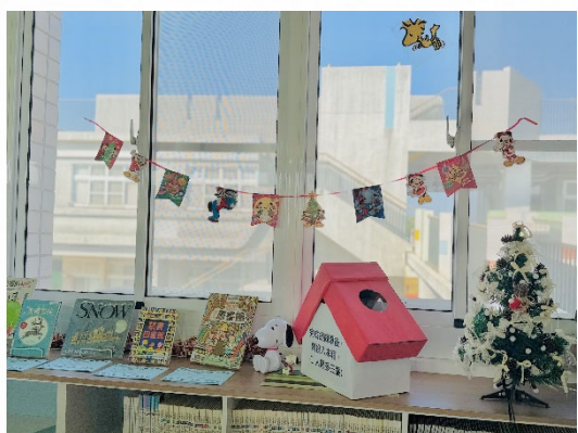
說明：情境布置營造溫馨。