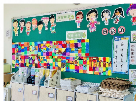
說明：校園布置營造溫暖。