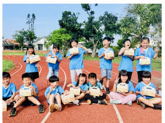
說明：多元活動建立歸屬。