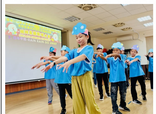
說明：多元展演建立自信。