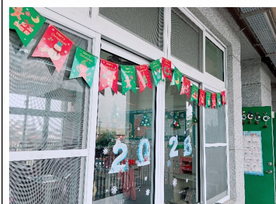
說明：情境布置提升幸福。