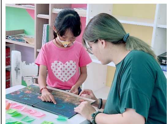
說明：師生互動溫馨和諧。