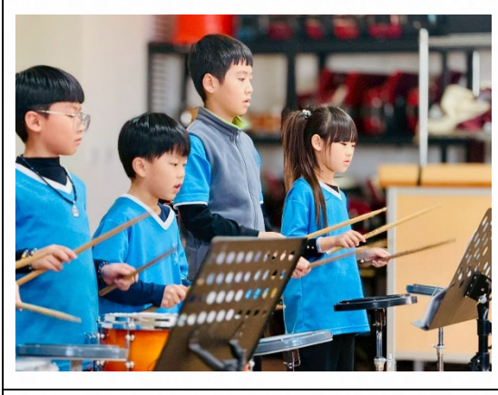
說明：多元活動展現才能。