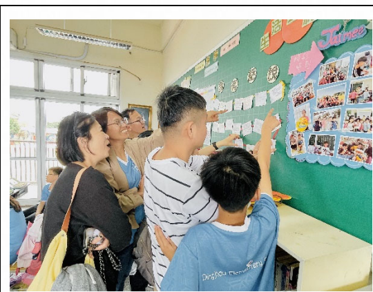
說明：節慶布置增添溫馨。