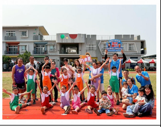
說明：展演活動凝聚情感。