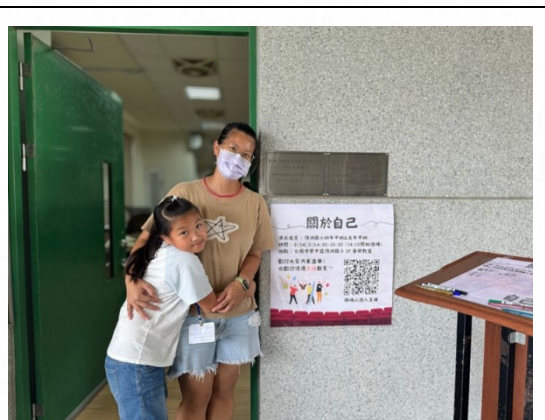
說明：親子互動凝聚情感。