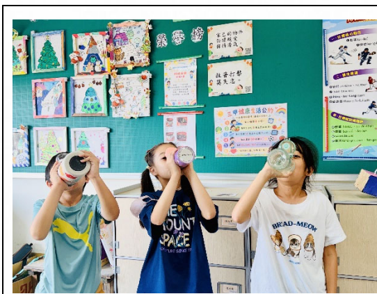
說明：健康公約營造氛圍。