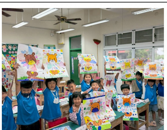
說明：運用自然素材進行環保創作。