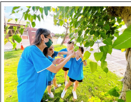
說明：師生觀察校園植物生態。