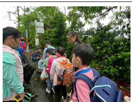
說明：全校約 43% 學生搭乘公車上下學，落實低碳交通生活。