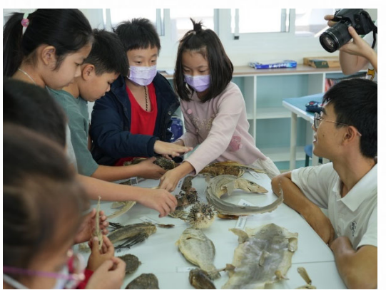
說明：學生認識在地食材營養價值。