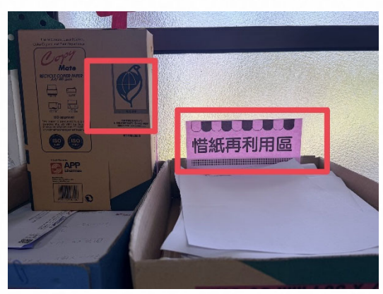
說明：使用再生紙並推動紙張再利用。