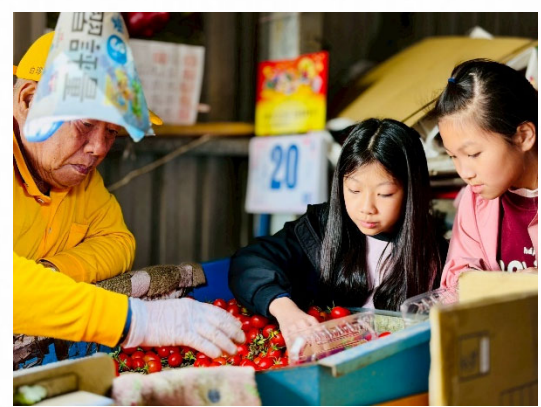
說明：祖孫共同參與食農教育活動。