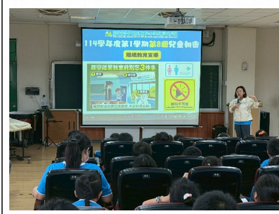
說明：定期辦理節能減碳宣導活動。