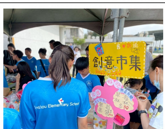
說明：校慶辦理二手創意市集活動。