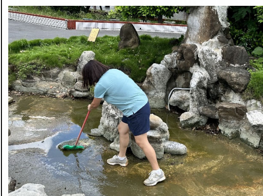
說明：落實登革熱孳生源清除。