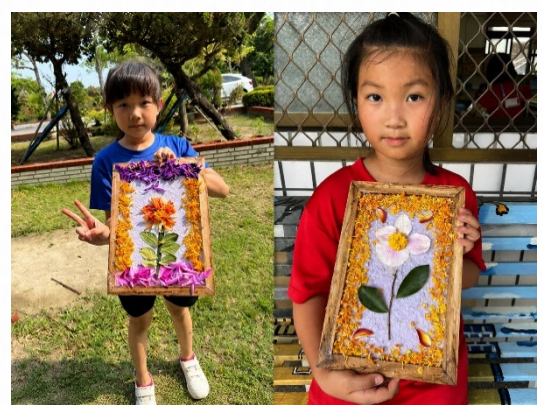
說明：結合再生紙漿與自然素材創作。