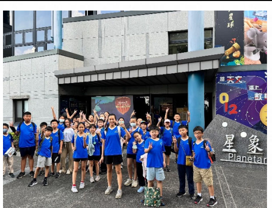
說明：參與南瀛天文館環境教育課程。