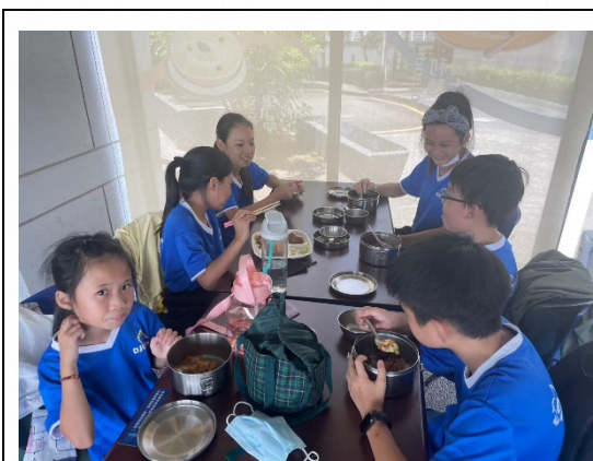
說明：戶外教育落實自備環保餐具。