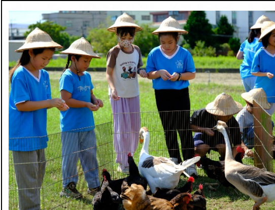
說明：透過戶外課程認識自然生態。