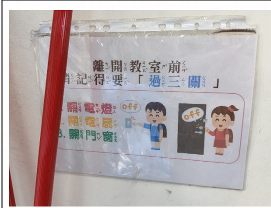
說明：宣導隨手關燈節能觀念。