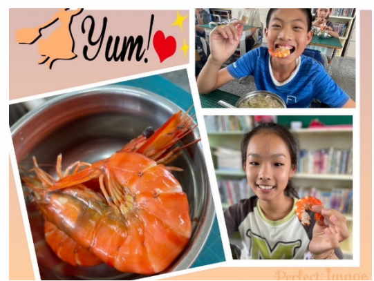
說明：結合健康飲食推廣低碳飲食。