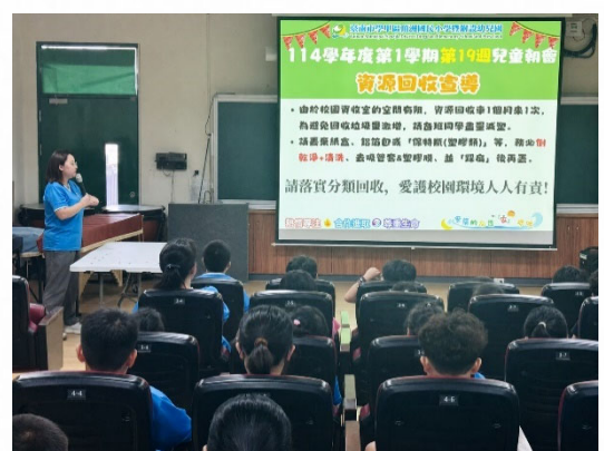
說明：推動資源回收與綠色消費教育。