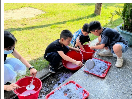
說明：培養學生資源再利用創作能力。