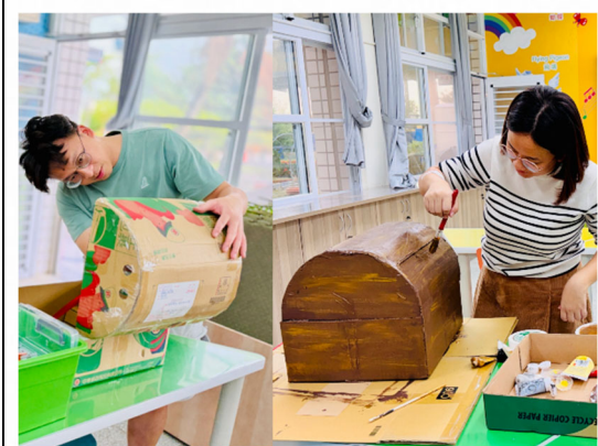
說明：運用回收紙箱製作舞蹈道具。