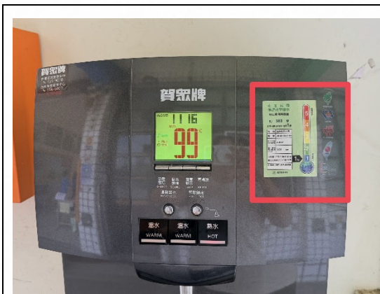
說明：校內飲水機符合環保節能標章。