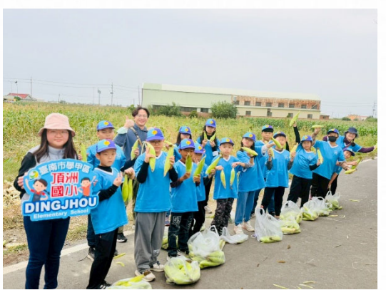
說明：學生體驗採收分享農作成果。