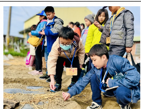
說明：學生體驗在地農作種植。