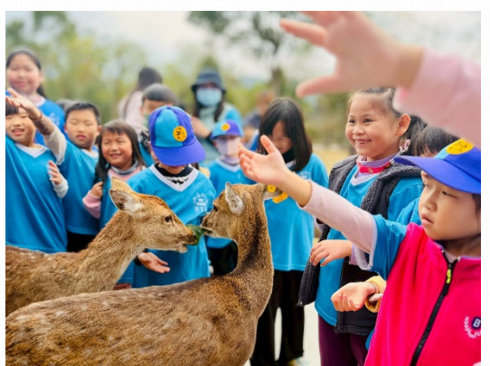
說明：透過戶外活動認識動物生態。