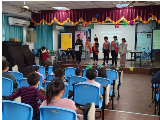
說明：所有市模範生候選人上臺拜票