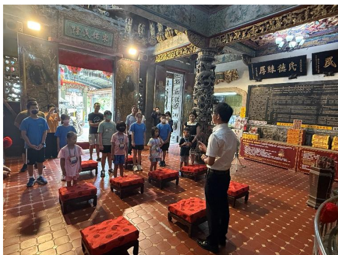
說明：三慈新生都會到當地信仰中心作參拜