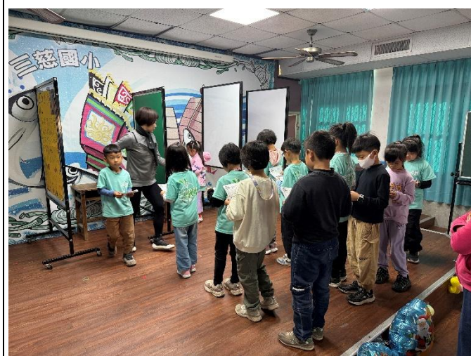
說明：全校師生都可以投票