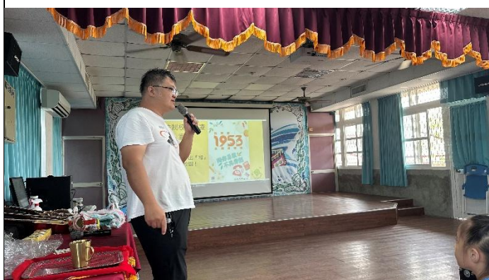
說明：學務組長對全校學生作反霸凌宣導營造良好校園環境。