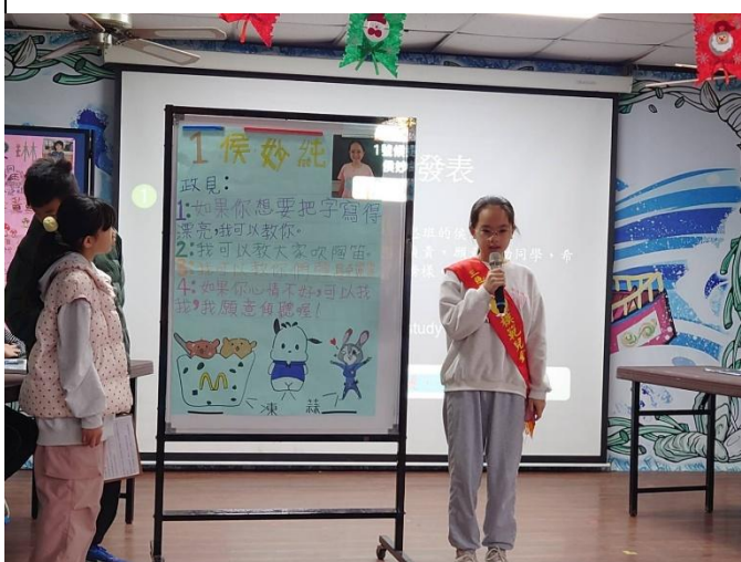
說明：市模範生候選人上臺介紹自己