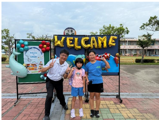
說明：校長及高年級同學迎接新生