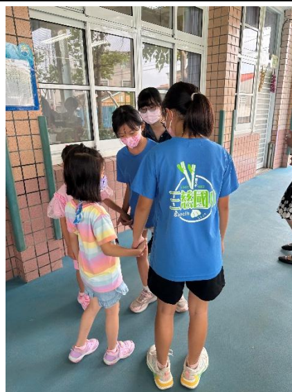
說明：高年級同學帶著新生作校園巡禮