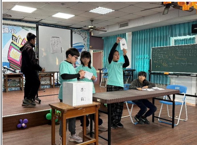
說明：讓學生參與開票，訓練其了解公開、公正的選舉程序。