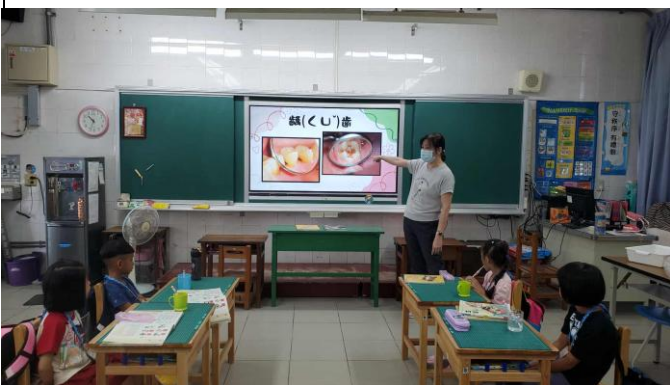
說明：護理師教導學生認識齲齒。