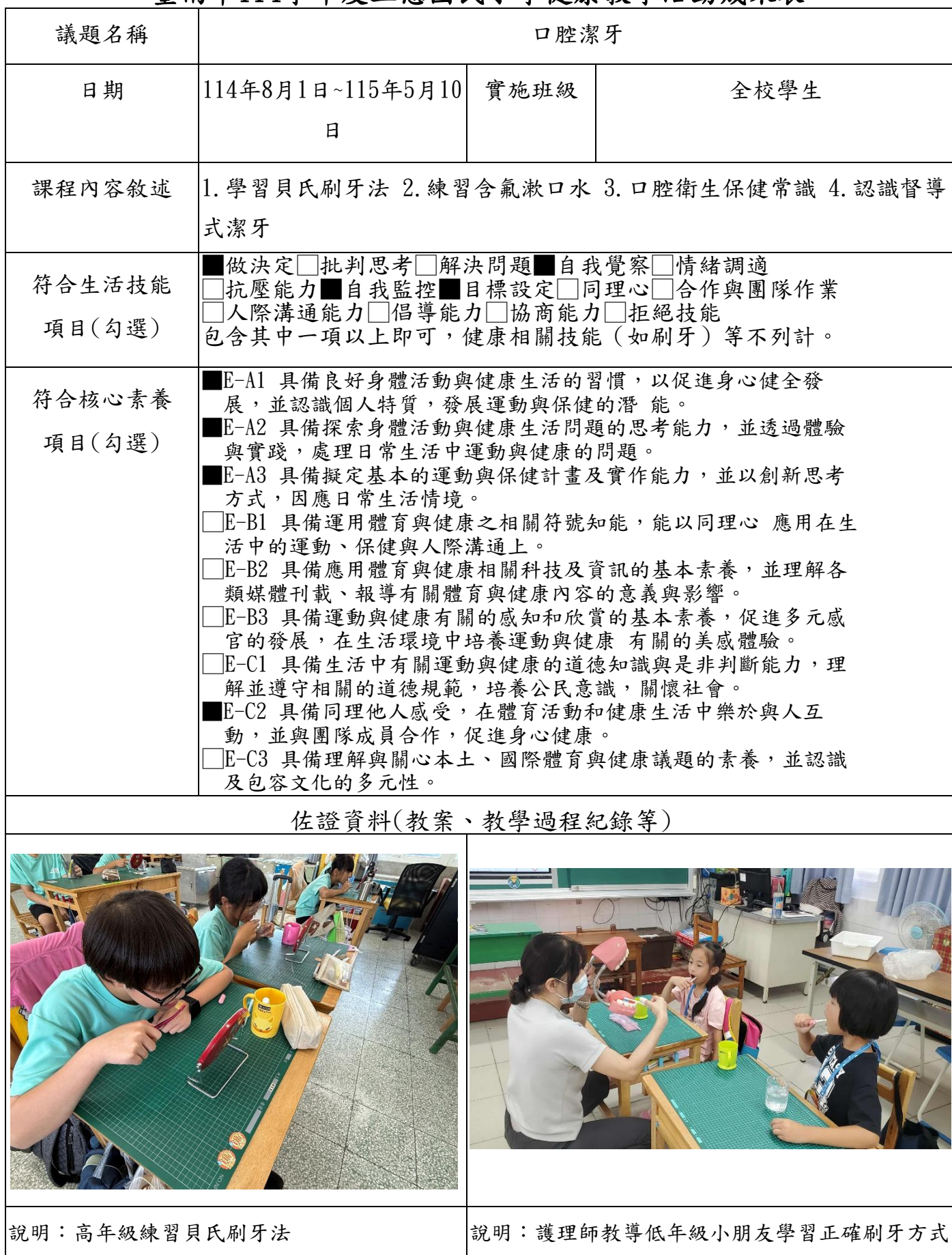
臺南市114學年度三慈國民小學健康教學活動成果表