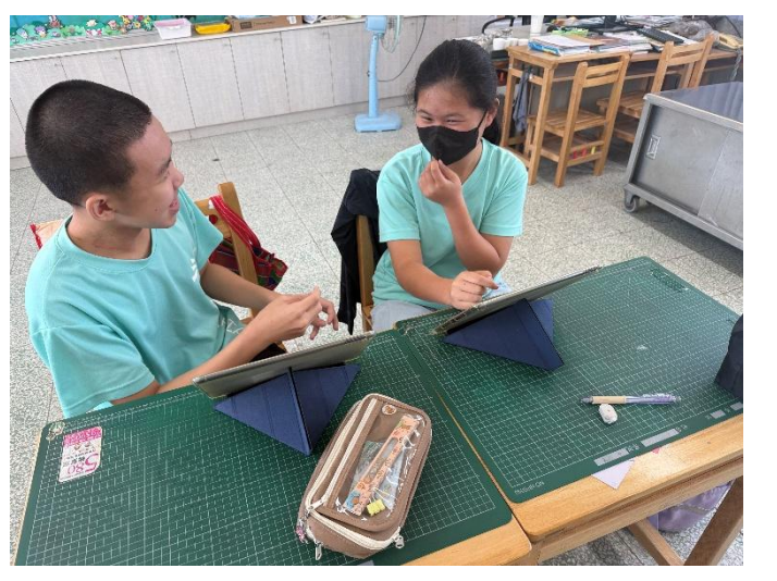
說明：分組討論早餐的優劣