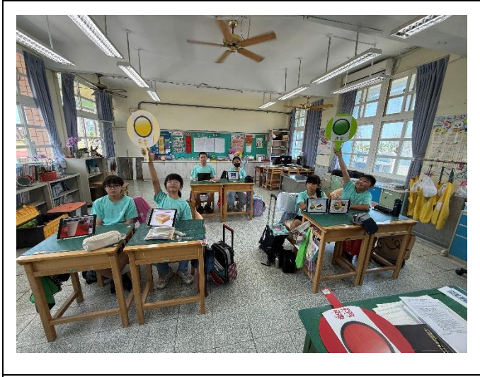
說明：能自己選擇優良的早餐