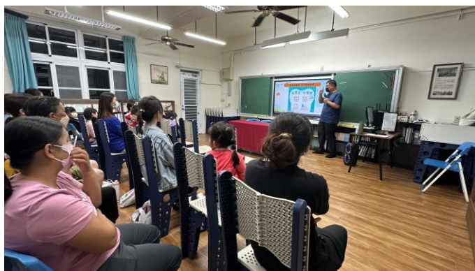
說明：班親會分享正確潔牙資訊