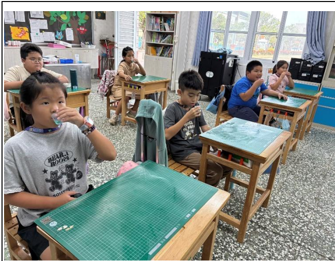
說明：週二為漱口水日，大家認真漱口。