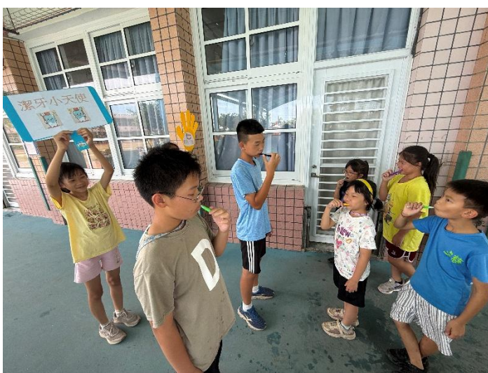
說明：潔牙小天使來督導小朋友刷牙