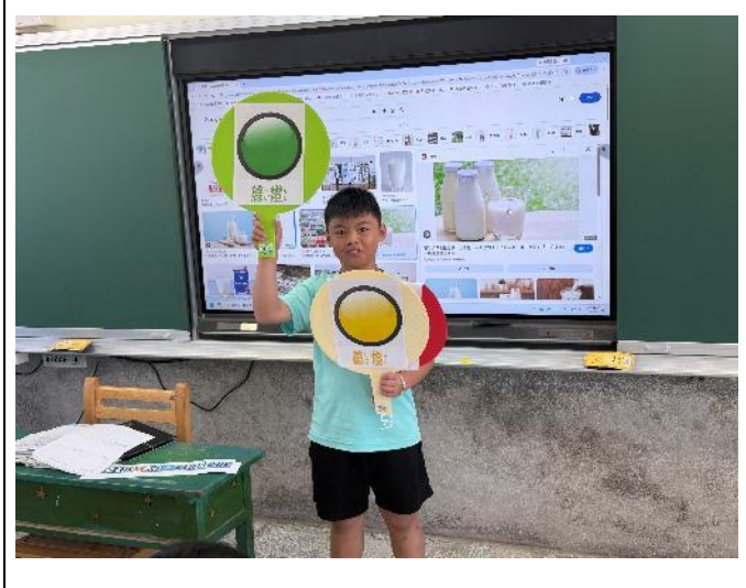
說明：了解食物的好壞