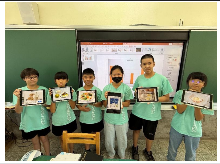
說明：最後能分享自己覺得最優秀的早餐