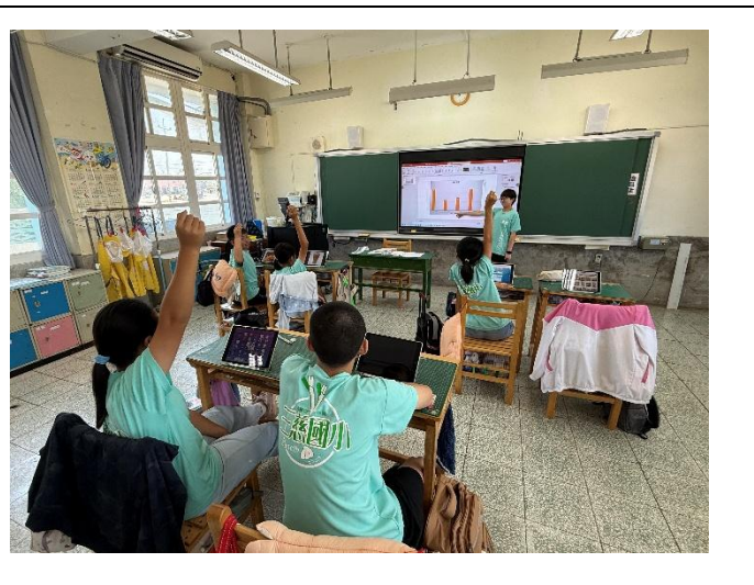
說明：找出為什麼同學們喜歡這幾類的早餐