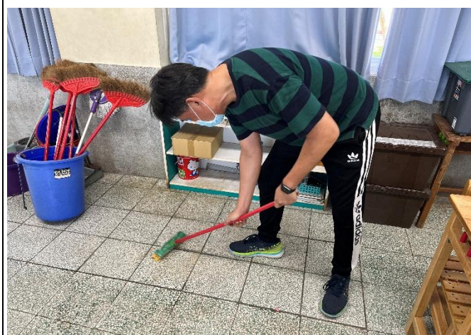
說明：大掃除時，老師一同加入掃地的行列