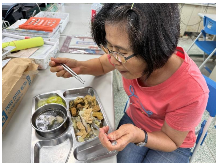
說明：老師午餐營養均衡，多吃蔬菜