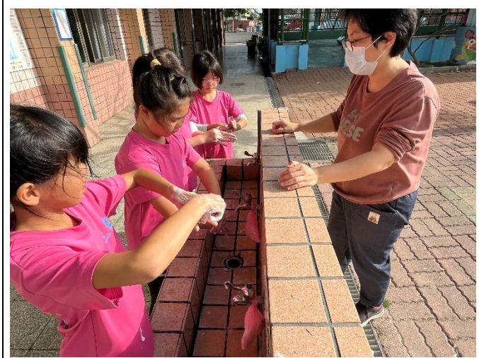
說明：老師督導學生正確洗手