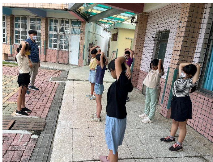
說明：老師指導學生活動前熱身，等等一起跑操場