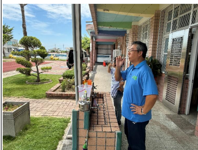
說明：教職員午餐後完成潔牙動作