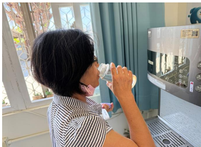
說明：學校老師在校內皆是飲用白開水