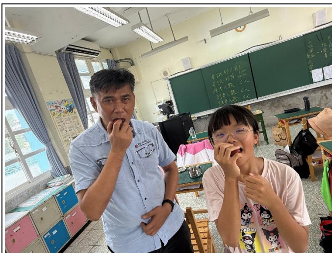
說明：老師和學生一統食用午餐水果