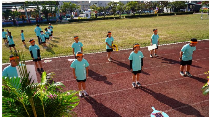
說明：學生利用標語來提醒大家健康體位的重要性