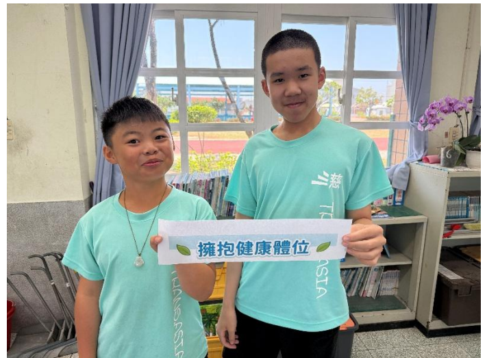
說明：製作健康促進標語，提醒學生時刻促進健康