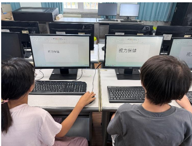
說明：資訊課時教導學生製作健康標語。