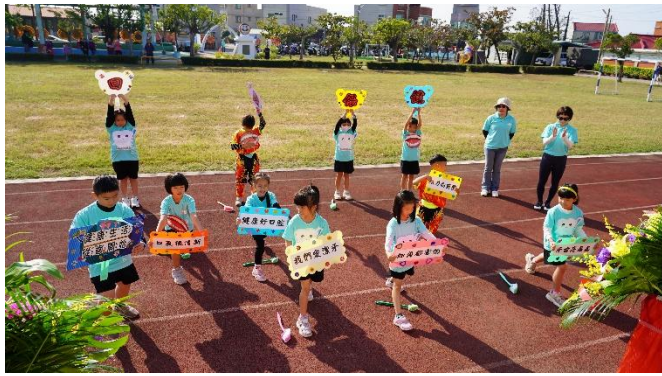
說明：利用社區運動會喚起社區民眾的健康意志