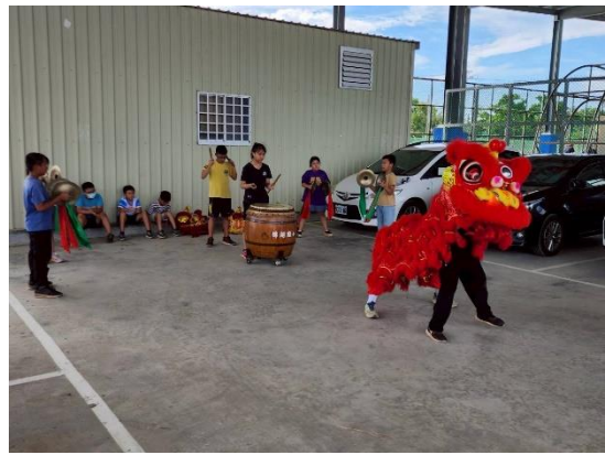
說明：醒獅戰鼓社團練習