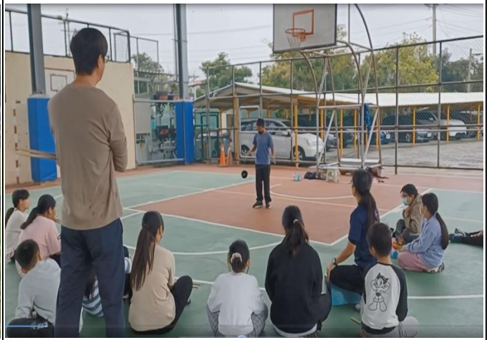
說明：寒假扯鈴營隊