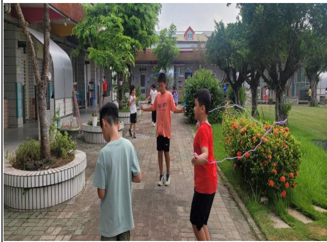
說明：學生課間跳繩情形