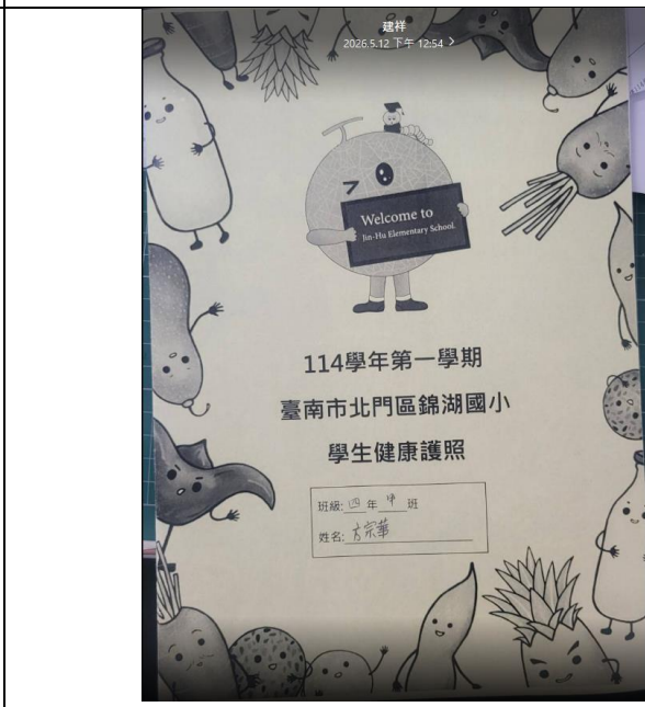
說明：運用健康護照登記每週運動時間