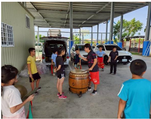
說明：醒獅戰鼓社團練習