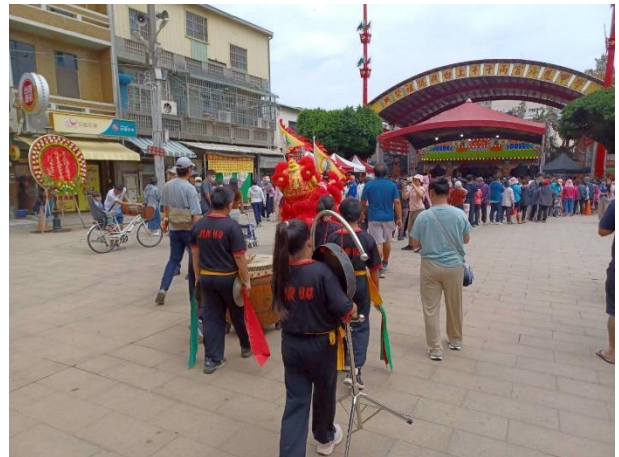
說明：醒獅戰鼓社團受邀至學甲慈濟宮表演