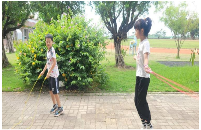
說明：學生課間跳繩情形