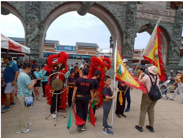
說明：醒獅戰鼓社團受邀至學甲慈濟宮表演