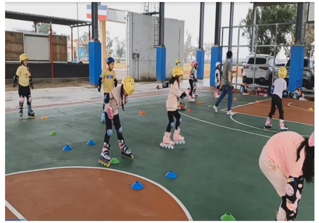
說明：暑期直排輪營