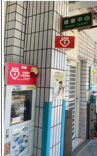
說明：健康中心外設置 AED 保護社區民眾安全