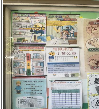
說明：佈告欄提供小黃公車及診所義診等健康服務資訊供社區民眾參考