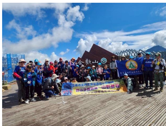
山野教育-無痕山林