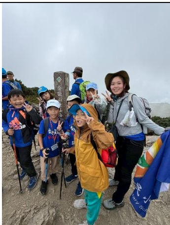
山野教育-無痕山林