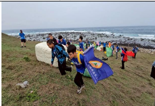
師生至東吉嶼進行淨灘