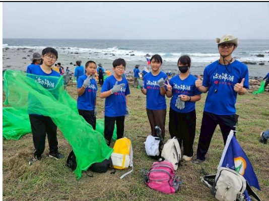
師生至東吉嶼進行淨灘