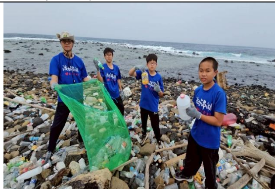
師生至東吉嶼進行淨灘