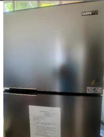
校內皆使用符合環保節能標章的冰箱