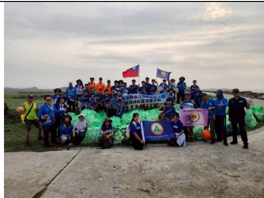
師生至東吉嶼進行淨灘