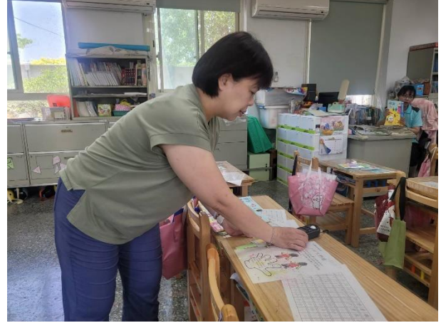
教室桌面照度測量