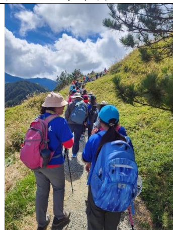
山野教育-無痕山林