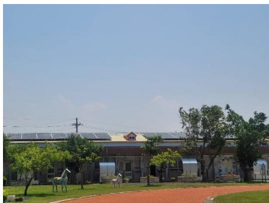
校舍屋頂裝設太陽能板，再生能源