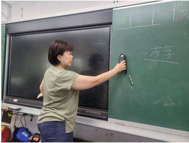
教室黑板照度測量