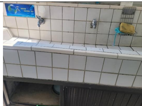
洗手臺部份水龍頭裝設省水裝置