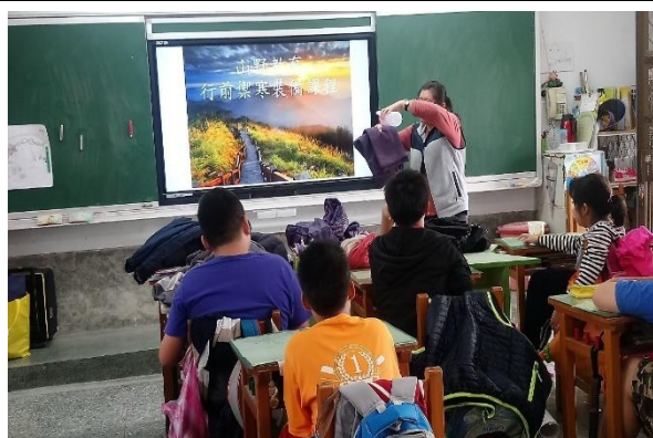
山野教育-無痕山林