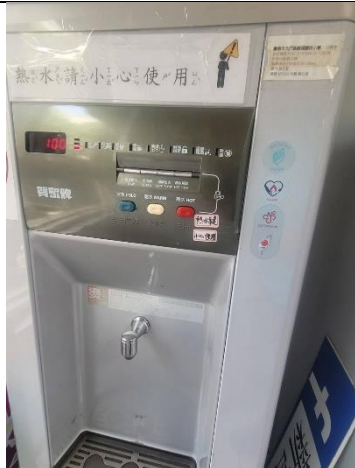
校內皆使用符合環保節能標章飲水機