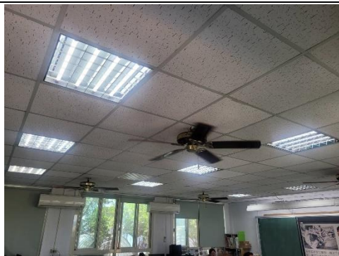
教室全面使用 LED 燈管，節省能源