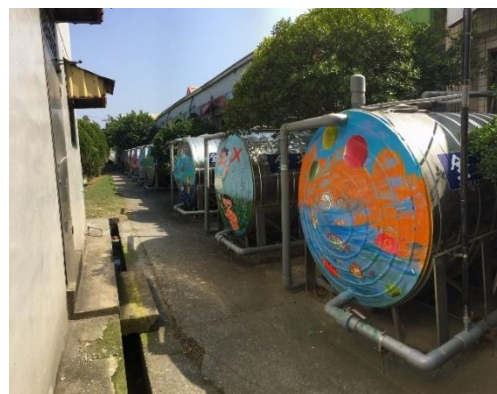
雨水貯留系統-學生利用雨水澆花、拖地，節水又防洪