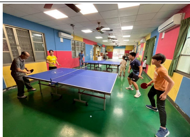
說明：課間師生桌球賽。