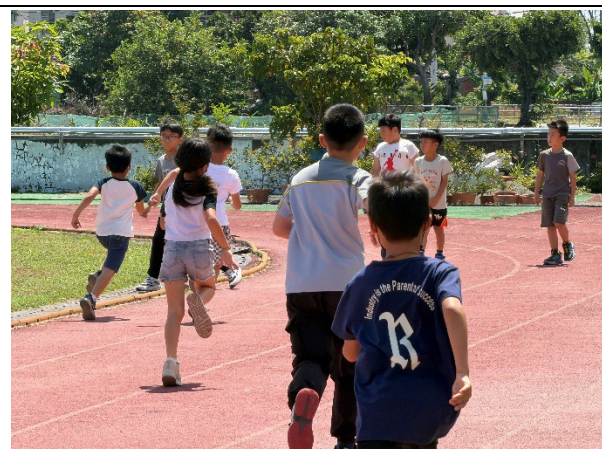
說明：課間活動運動護照跑步。