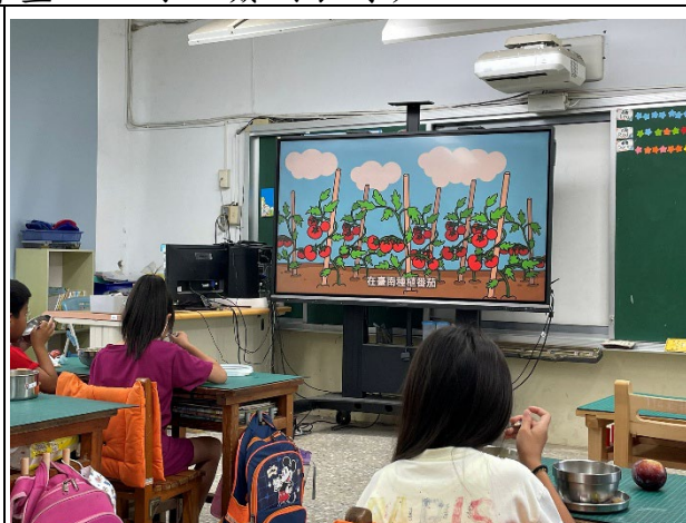
說明：進行飲食教育。