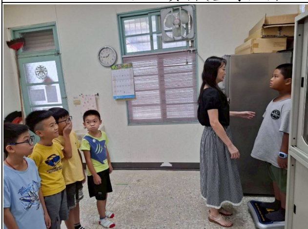
說明：測量身高體重，進行前後測。