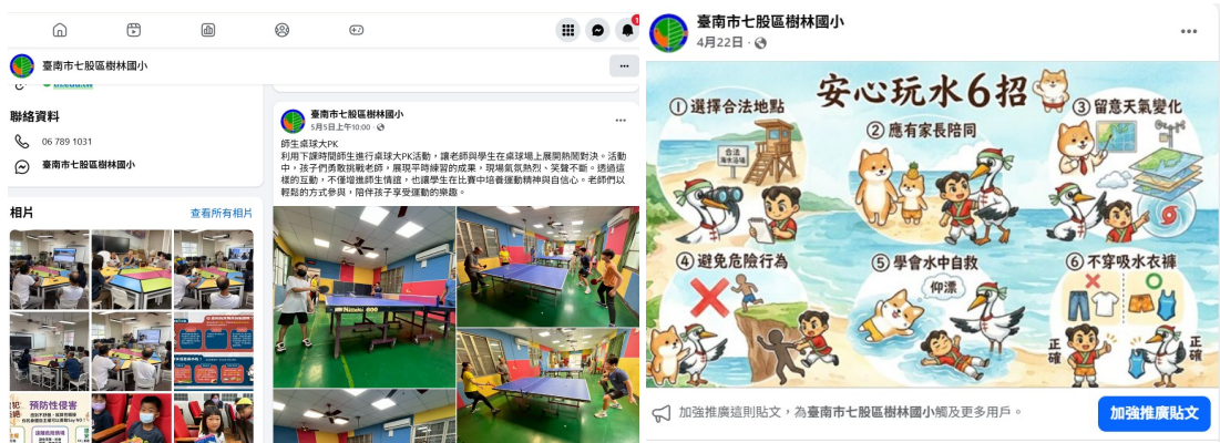
圖說：學校網站上的健康促進相關訊息。

https://schoolweb2.tn.edu.tw/~sules_healthy/index.php