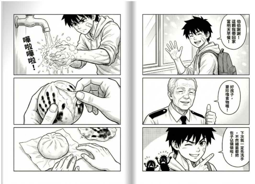
圖說：每月出版的樹林少年上的健康促進宣導。