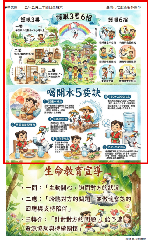
圖說：每週印給學生帶回去，教學活動週報上的的健康促進宣導。