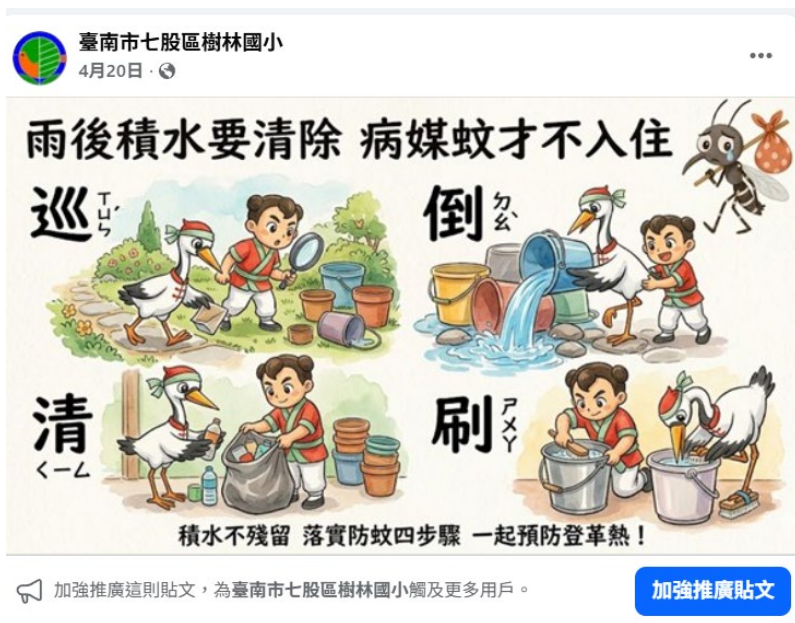
圖說：學校 fb 粉絲團上的健康促進宣導。